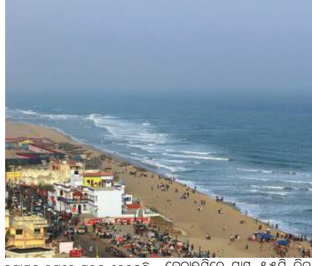
ଭୁପାୟନ ଉପରେ ଗୁରୁତ୍ୱ ଦେଇଛନ୍ତି । ଉପକୂଳ ଓଡ଼ିଶାରେ ଥିବା ଗୋପାଳପୁର, ବାଲିପୁର, ତଳସାରି, ପାରାଦୀପ ଓ ସୋନାପୁର ଜଗତୀ