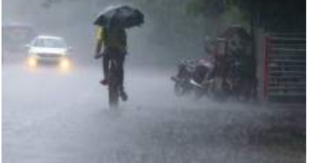
ଭୁବନେଶ୍ୱର, କେନ୍ଦ୍ରାପଡ଼ା, ଜଗତସିଂହପୁର, କଟକ, ଅନୁଗୋଳ, ନୟାଗଡ଼, ଗଞ୍ଜାମ, ପୁରୀ, ରଞ୍ଜାମ, କନ୍ଧମାଳ, ଭାରତୀୟ, କେନ୍ଦୁଝର, ମୟୂରଭଞ୍ଜ, ବାଲେଶ୍ୱର ଓ ପାଳିକାନଗିରି ଜିଲ୍ଲାରେ କେତେକ ସ୍ଥାନରେ ବର୍ଷା ସହିତ ବିଲୁଳି ଓ ଯତ୍ନକ୍ରିୟା ହେବାର ସମ୍ଭାବନା ରହିଛି । ସେଥିପାଇଁ ଯେଲେ ଖୁବ୍ କାରି କରାଯାଇଛି ।

ଭୁବନେଶ୍ୱର, ୮।୯ (ପି.ଏନ): ଆଗାମୀ ୨୪ ଘଣ୍ଟା ଭିତରେ ରାଜ୍ୟରେ କେତେକ ସ୍ଥାନରେ ବର୍ଷା ହୋଇପାରେ । ହେଲେ ଆସନ୍ତା ୯ ଓ ୧୦ ତାରିଖରେ ବର୍ଷା କମିବ । ଚାପପାତ୍ରରେ ସାମାନ୍ୟ ବୃଦ୍ଧି ହେବାର ସମ୍ଭାବନା ରହିଛି । ପୁଣି ୧୧ ତାରିଖରୁ ରାଜ୍ୟରେ ହାଲୁକାକୁ ମଧ୍ୟମ ଧରଣର ବର୍ଷା ହେବ । ସେଥିପାଇଁ ଭୁବନେଶ୍ୱର ଆଞ୍ଚଳିକ ପାଣିପାଗ କେନ୍ଦ୍ର ସର୍କାରୀ ସୂଚନା କାରି କରିଛି । ଭୁବନେଶ୍ୱର ଆଞ୍ଚଳିକ ପାଣିପାଗ କେନ୍ଦ୍ର କାରି କରିଥିବା ବୁଲେଟିନ୍ ଅନୁସାରେ ଆସନ୍ତା ୧୧ ତାରିଖରେ ସୁନ୍ଦରଗଡ଼, କେନ୍ଦୁଝର, ମୟୂରଭଞ୍ଜ, ବାଲେଶ୍ୱର, ଉତ୍ତରାଞ୍ଚଳ, କେନ୍ଦ୍ରାପଡ଼ା, ଜଗତସିଂହପୁର, କଟକ, ଅନୁଗୋଳ, ନୟାଗଡ଼, ଗଞ୍ଜାମ, ପୁରୀ, ରଞ୍ଜାମ, କନ୍ଧମାଳ, ଭାରତୀୟ, କେନ୍ଦୁଝର, ମୟୂରଭଞ୍ଜ, ବାଲେଶ୍ୱର ଓ