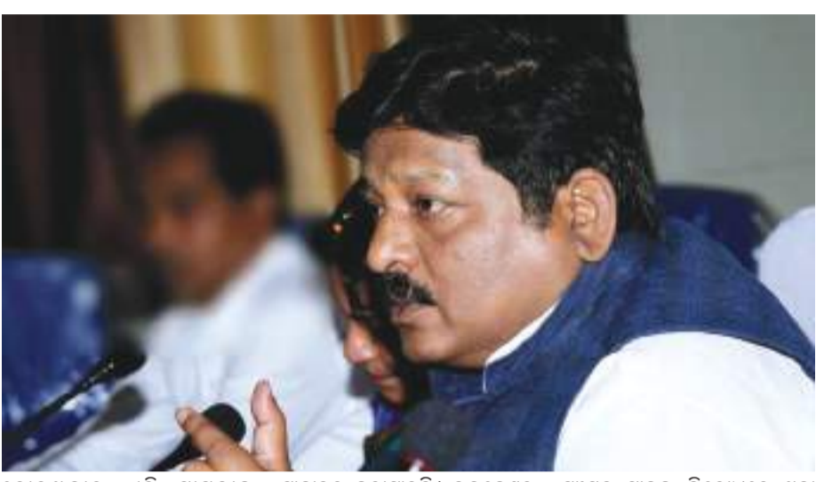
ହୋଇଥିବାରୁ ଏହି ମାମଲାକୁ ଭୁବନେଶ୍ୱର ସେକ୍ସନାଲ କୋର୍ଟକୁ ସ୍ଥାନାନ୍ତର କରାଯାଇଛି। ଭୁବନେଶ୍ୱର ସେକ୍ସନାଲ କୋର୍ଟରେ ବିଧାୟକ ବା ସଂସଦ ମାନଙ୍କ ବିରୋଧରେ ଥିବା ମାମଲାଗୁଡ଼ିକର ଭୂତିକ ବିଚାର