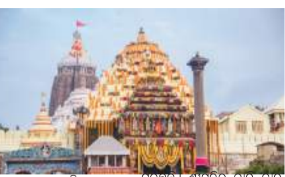
ଶ୍ରୀକ୍ଷେତ୍ର ଆସୁଛନ୍ତି। ହେଲେ ମହାପ୍ରଭୁଙ୍କୁ ଦର୍ଶନ କରିବା ପାଇଁ ଶ୍ରଦ୍ଧାଳୁମାନେ ନାହିଁନଥିବା ଅସୁବିଧାରେ

ଭୁବନେଶ୍ୱର, ୨୫।୯(ପି.ଏନ): ଶ୍ରୀମନ୍ଦିର ଚାରି ଦୁଆର ଖୋଲିବା ଓ ଅନ୍ୟାନ୍ୟ ଦାବି ପୂରଣ ନେଇ ଶ୍ରୀଜଗନ୍ନାଥ ସେନା ଦେଇଥିଲା ଓଡ଼ିଶା ବନ୍ଦ ଡାକରା। ଏହା ଉପରେ ପୁରୀ ଜିଲ୍ଲାପାଳ ତାକିଥିବା ଆଲୋଚନା ବିଫଳ ହୋଇଛି। ୭୨ ଘଣ୍ଟା ଭିତରେ ଦାବି ପୂରଣ ନହେଲେ ଆସନ୍ତା ୩ ତାରିଖରେ ଓଡ଼ିଶା ବନ୍ଦ ଡାକରା ଦେଇଛି ଶ୍ରୀଜଗନ୍ନାଥ ସେନା। କୋଟି ଓଡ଼ିଆଙ୍କୁ ଆଗେଇ ମହାପ୍ରଭୁଙ୍କୁ କାନ୍ଦିଆ ଠାକୁର। ସେଥିପାଇଁ ପ୍ରତିଦିନ ହଜାର ହଜାର ଶ୍ରଦ୍ଧାଳୁ ଦୂରଦୂରାରୁ