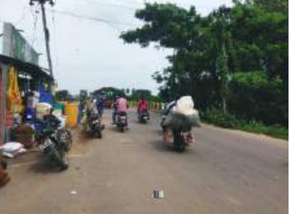
ଲୋକ ମାନେ ପରିବା କରିବାକୁ ଆସୁଥିବାକୁ ଗ୍ରାଫିକ କାମ ହେଉଥାଏ ଓ ବ୍ରିଜ୍ ? ର ଆରପଟେ ଦୋକାନ ଥିବାକୁ ବ୍ରିଜ୍ ? ଉପରେ ଏତେ ଗ୍ରାଫିକ କାମ ହେଉଛି ଯେ ରୋଗୀ ଠିକ ସେ ପହଞ୍ଚିବେ କି ନାହିଁ ସନ୍ଦେହରେ। ଏବେ ପାର୍ଶ୍ୱ ଋତୁ ହେଉଥିବାରୁ ଲୋକମାନେ ବଜାରରୁ ଜିନିଷ କରିବା ପାଇଁ ଆସି ଗାଡି ମଟର ଘଣ୍ଟା ଧରି ଫସି ରହୁଛନ୍ତି ଯାତାୟତ କରୁଥିବା ଲୋକେ, ଏପରିକି ବେଳେ ବେଳେ ବ୍ରିଜ୍ ? ଉପରେ ମୋଟର ସାଇକେଲ ବି ଅଟାକୁମ୍ପ କରିବାକୁ ଘଣ୍ଟା ଘଣ୍ଟା ସମୟ ଲାଗୁଛି। ତିନି ଚାରି ଚକିୟା କାନ କଥା ନକହିବା ଭଲ। ସେଇବ୍ରିଜ୍ ? ଉପରେ ଏତେ ସଂଖ୍ୟାର କାନ ଅଟକ ଥିବାରୁ ଏହି ବ୍ରିଜ୍ ବହୁତ ପୁରୁଣା ହୋଇଥିବାରୁ ସେହି ସ୍ଥାନରେ ଅଟକ ଥିବା ଯାନ ର ଉତ୍ତନ ସମୟା ପାରିବକି ନାହିଁ ଅଞ୍ଚଳ ବାସି ସନ୍ଦେହ ପ୍ରକଟ କରିଛନ୍ତି।

ନିମାପଡ଼ା, ୨୫।୯(ପି.ଏନ): ନିମାପଡ଼ା ପରିବା ବଜାର ରୁ କିଛି ଦୂରରେ କୁଶଭଦ୍ରା ବ୍ରିଜ୍ ? ଅବସ୍ଥିତ, ବିଶେଷ କରି ସେଇ ବ୍ରିଜ୍ ? ଦେଇ କୋଣାର୍କ ଆଉ କାକଟପୁର ଅନ୍ତରାଳ ଯାତାୟତ ପାଇଁ ସେଇ କୁଶ ଭଦ୍ରା ବ୍ରିଜ୍ ? ହିଁ ନିର୍ଭରଶୀଳ, ସେହି ପରି ଏହି ଅଞ୍ଚଳରେ ଲୋକମାନେ ଦିନକୁ ଲାଗି ଚାରିଛକ ଆଉ ନିମାପଡ଼ା ମେଡିକାଲ ଉପରେ ନିର୍ଭର କରନ୍ତି ତା ସହିତ ପାଠ ପଢ଼ିବା ପାଇଁ ବହୁତ ଦୂରରୁ ନିମାପଡ଼ା କଲେଜେ କୁ ସେଇ ବ୍ରିଜ୍ ? ଦେଇ ଯାତାୟତ କରନ୍ତି କିନ୍ତୁ ସେଇ କୁଶଭଦ୍ରା ବ୍ରିଜ୍ ? ଲୋକଙ୍କ ପାଇଁ ଦୁଃଖ ପାଲଟିଛି। ସେଇ ବ୍ରିଜ୍ ? ଉପରେ ବଡ଼ ବଡ଼ ଖାଲ ହେଉଥିବାରୁ ସେଇ ବ୍ରିଜ୍ ? ଏବେ ମରଣ ଜନ୍ମ ପାଲଟିଛି। ଘରୁ ବାହାରିଲେ ଯାତାୟତ କରୁଥିବା ଲୋକମାନେ ଠିକ ସମୟରେ ପହଞ୍ଚିବେ କି ନାହିଁ ତାହାକୁ ନେଇ ସମସ୍ତେ ସନ୍ଦେହରେ ଆସିଛନ୍ତି ନିମାପଡ଼ା ରୁ କାକଟପୁର ଯିବାପାଇଁ ବ୍ରିଜ୍ ? ତ ଉକ୍ତପାଶ୍ୱରେ ନିମାପଡ଼ା ତେଲପରିବା ମାରକେଟ୍ କୁ