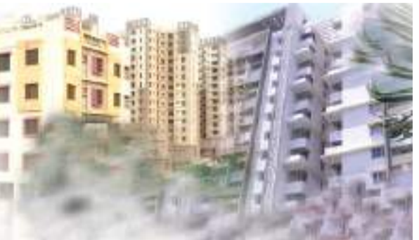
ଆପାର୍ଟମେଣ୍ଟ ମାଲିକାନା ଓ ଆପାର୍ଟମେଣ୍ଟ ଏବଂ ସାଧାରଣ କ୍ଷେତ୍ର ତଥା ଅବିଭକ୍ତ ଆଗ୍ରହକୁ ବିକ୍ରୟ, ବନ୍ଧକ, ଲିଜ୍, ଉପହାର, ବିନିମୟ କିମ୍ବା ଅନ୍ୟ କୌଣସି ଉପାୟରେ ଏହି ଆପାର୍ଟମେଣ୍ଟରେ ଥିବା ସୁବିଧାଗୁଡ଼ିକୁ ସ୍ଥାନାନ୍ତର କରିବାକୁ ବାଟ ଫିଟିଛି। ପୂର୍ବରୁ ଥିବା ନିୟମାବଳୀରେ ଆପାର୍ଟମେଣ୍ଟର ସ୍ୱତନ୍ତ୍ର ମାଲିକାନା ଏବଂ ଏକାଧିକ ମାମଲା ଦାୟର ହୋଇଥିଲା।

ଭୁବନେଶ୍ୱର, ୨୫।୯(ପି.ଏନ): ରାଜ୍ୟରେ ସହଜ, ସରଳ ଓ ସ୍ୱଚ୍ଛ ହେବ ଆପାର୍ଟମେଣ୍ଟ କିଣାବିକା କାରବାର। ଆପାର୍ଟମେଣ୍ଟ କ୍ଲରେଡ଼ମାନଙ୍କର ଏଣିକି ସାଧାରଣ କ୍ଷେତ୍ର କା କମର ଏରିଆରେ ସମାନ ଅଧିକାର ରହିବ। ଏନେଇ ବାଟ ଫିଟିଛି। ବିଧାନସଭାରେ ଓଡ଼ିଶା ଆପାର୍ଟମେଣ୍ଟ ମାଲିକାନା ଓ ପରିଚାଳନା ବିଲ୍ ଆଗତ ହୋଇଛି। କିଛି ଦିନ ତଳେ ଅଧ୍ୟାୟେ ଆକାରରେ ଆଣିଥିବା ଓଡ଼ିଶା ଆପାର୍ଟମେଣ୍ଟ ମାଲିକାନା ଅଧିନିୟମ-୧୯୮୨ ଏବଂ ଓଡ଼ିଶା ଆପାର୍ଟମେଣ୍ଟ ମାଲିକାନା ନିୟମ-୧୯୯୩ ଏବଂ କାର୍ଯ୍ୟକାରୀ ହେବା ପରେ ଏହାକୁ ଆଇନରେ ପରିଣତ କରିବାକୁ ବାଟ ଫିଟିଛି। ପୂର୍ବରୁ ଥିବା ନିୟମାବଳୀରେ ଆପାର୍ଟମେଣ୍ଟର ସ୍ୱତନ୍ତ୍ର ମାଲିକାନା ଏବଂ ଏକାଧିକ ମାମଲା ଦାୟର ହୋଇଥିଲା।