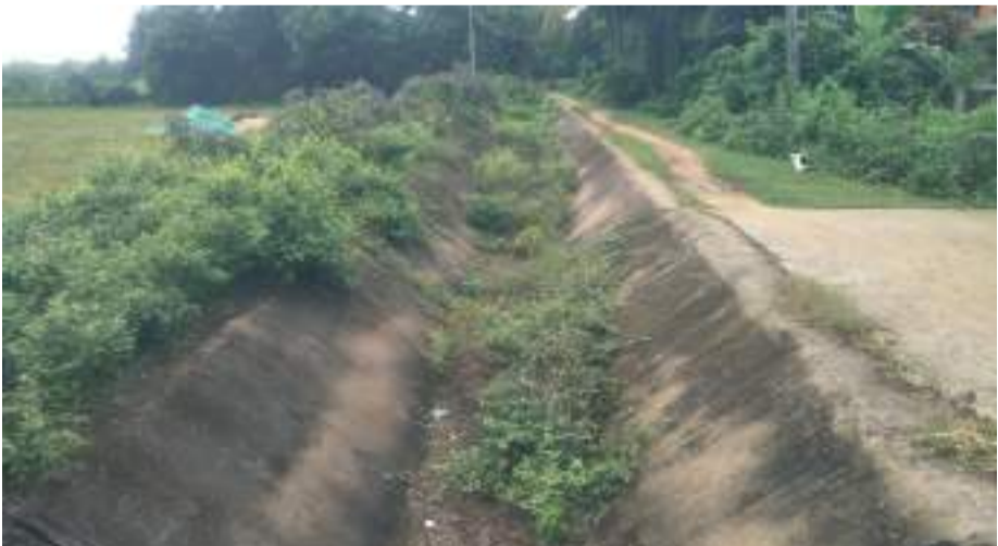
, କୁହୁଡି, କଣବଣ, ମହାଦେବବନ୍ଧୁ, ପାଟପୁରପୁର, ନଳଗୁଆଁ, ବାଉରିଆକଣ, କାକଟପୁର ଡିସ୍‌କ୍ୱାରାଉ, ବାହାରିଥିବା ବିଭିନ୍ନ ଶାଖା, ଉପଶାଖା, ଅତିରିକ୍ତ ଉପଶାଖା କେନାଲରେ ଦେଖିବାକୁ ମିଳୁଛି। ଓସିଆଁଠାରୁ ଅଗନ ଯାଇଥିବା କେନାଲ ମାଟିରେ ମିଶି ଯାଇଥିବା ବେଳେ ପ୍ରତିବର୍ଷ କେନାଲ ସଫେଇ ନାଁରେ ଲକ୍ଷ ଲକ୍ଷ ଟଙ୍କା ହରିଲୁଟ ହେଉଛି। ସେହିପରି ବିଶ୍ୱନିପତା, କଟିଲୋ, ନରସିଂହପୁର, କମନ୍ଦାଧିପୁର, ପାଟପୁର, ସୁହାଗପୁର, ଶଶାଣପୁର ଆଖୁରିଆ, ଯାଚକିଗାଁ, ତରାଆ, ନାଗପୁର, ରତନପୁର, ଉଦୟପୁର ଆଦି କେନାଲ ଶୁଖିଲାପଡିଛି ବୋଲି ଚାଷୀ ଅଭିଯୋଗ କରିଛନ୍ତି। କେନାଲ ସଫା ପରେ ବି କେନାଲ ମଧ୍ୟରେ ଅନାଦାନ ଗଛ ଯଥା ଜଙ୍ଗଲ ଦେଖିବାକୁ ମିଳୁଛି। ଅଭିଯୋଗ କଲେ ବିଭାଗ ପକ୍ଷରୁ ସଫେଇ ବିଆଯାଇଛି ଯେ କେନାଲରେ ଲୋକ ଅଧିଆ ପକାଇ ଥିବାରୁ କେନାଲ ଚଳୁ ମୁଣ୍ଡକୁ ପାଣି ଯାଇପାରୁନି। କାକଟପୁର ଜଳସେଚନ ବିଭାଗ ଉପଖଣ୍ଡ ଅଧିକରେ ଥିବା ୨୨୧ ଜମି ଲୟ

କାକଟପୁର, ୨୫।୯(ପି.ଏନ): କେନାଲ ସଫେଇ, ଯାସଫୁଲ୍ଲା, ଘନିଆପାଲ, ପ୍ରୋଜେକ୍ଟ (ଖୁଲ) କେନାଲ କଂକ୍ରିଟ୍ ଲାଇନିଙ୍ଗ ନିର୍ମାଣ ଓ ମରାମତି ଆକରେ ପ୍ରତିବର୍ଷ କାକଟପୁର ଜଳସେଚନ ବିଭାଗ ପକ୍ଷରୁ କୋଟି କୋଟି ଟଙ୍କା ହେଉଛି ଷ କିନ୍ତୁ କେନାଲ ଚଳୁ ମୁଣ୍ଡରେ ପାଣି ପହଞ୍ଚିପାରୁନଥିବାରୁ ଚାଷୀ ଜମି ପଡିଆ ପଡୁଛି। କେଉଁ ସ୍ୱାର୍ଥରେ ଚାଷୀ ଜଳକର ଦେବେ ବୋଲି ଅଭିଯୋଗ କରୁଛନ୍ତି। ଆଜକୁ ୪ ବର୍ଷ ଧରି କେନାଲ ସଫେଇ କାର୍ଯ୍ୟରୁ ପାଣି ପଞ୍ଚାୟତ ବାଦପଡ଼ିଥିବା ବେଳେ କେନାଲରେ ପାଣି ଆସିବା ପରେ ବିଭାଗ ପକ୍ଷରୁ ଟେଣ୍ଡର ଡକାଯାଇଛି। ଠିକାଦାର ଜନଗହଳି ପୂର୍ଣ୍ଣ ସ୍ଥାନରେ କେନାଲକୁ ଭଲ ଭାବେ ସଫା କରିଦେଇ ଅନ୍ୟ ସ୍ଥାନଗୁଡ଼ିକରେ କେନାଲରେ ଉଠିଥିବା ଅନାଦାନ ଘାସ ଉପରେ କେସିଟି ବୁଡ଼ାଇ ଦେଇ ଚାଲି ଯାଉଥିବାରୁ ସଫେଇର ଆଠ ଦିନ ମଧ୍ୟରେ ଦାବି ଯାଇଥିବା ବେଳା, ଖରା ଋତୁ ସହ ଅନ୍ୟାନ୍ୟ ଗଛ ପୂର୍ବ ଭଳି ଠିଆ ହୋଇଯାଇଛି। ଯାହାରକି (କଳକ) ଉଦାହରଣ ନାଳକଣ୍ଠପୁର, ଆବାପପୁର, ଓଳକପୁର, ଲତାହରଣ, ବିରିଡି, କାହାଳ, ଅଳ୍ପ, ଗବେଠେ