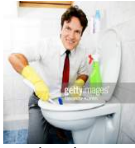
ମାଧ୍ୟମରେ ଭିତରକୁ ଚାଲିଯାଏ ତ ନାକ, ଗଳ, ଏବଂ ଫୁଏସ୍‌ସ୍‌ରେ ଭିତର ଅଂଶ ଜଳାପୋତା ହୋଇପାରେ । ଫିନାଇଲକୁ ନେଇ ଆମର ମତ୍ତିକୁ ଖୁବ୍ ସମ୍ବେଦନଶୀଳ । ଫିନାଇଲ ଦ୍ୱାରା ହୁଦଯାତ ଏବଂ କୋମାକୁ ଚାଲିଯିବାର ସମ୍ଭାବନା ରହିଛି ।

ଫିନାଇଲରେ ଏମିତି କିଛି ବିଷୟକୁ ପଦାର୍ଥ ମିଶିଛି ଯାହା ଆମ ଶରୀରରେ ସ୍ୱୋପକ୍ଷକ ଭଳି କାମ କରିଥାଏ । ବହୁ ଅଧ୍ୟୟନରୁ ଜଣାପଡିଛି ଯେ, ସଫା କରିବା ପାଇଁ ବ୍ୟବହୃତ ହେଉଥିବା ଫିନାଇଲରେ ବହୁତ କ୍ଷତିକାରକ ତତ୍ତ୍ୱ ମିଶିକରି ରହିଥାଏ । ଫିନାଇଲରେ ରହିଥାଏ ଶକ୍ତିଶାଳୀ ଫିନୋଲ୍, ଯାହା ରୋଗାଣୁରୋଧକ ଏବଂ କୀଟାଣୁନାଶକ କାମ କରିଥାଏ । ଯେତେବେଳେ ଏହାକୁ ଲାଗିତ କିମ୍ବା ବାୟୁରୁ ମୁଖାକରିବା ପାଇଁ ବ୍ୟବହାର କରାଯାଏ ତ ଏଥିରେ ଥିବା କେମିକାଲ୍ ବହୁତ ସମୟ ଧରି ନିଶ୍ୱାସ ପ୍ରଶ୍ୱାସରେ ନେଲେ ବହୁ ଗୁରୁତ୍ୱପୂର୍ଣ୍ଣ ଅଙ୍ଗ ଯଥା ପେଟ, ଅନ୍ତ, ଲିଭର, କିଡନୀ ଏବଂ ହାର୍ଟକୁ କ୍ଷତି ପହଞ୍ଚାଇଥାଏ । ବେଳେ ବେଳେ ଏହାର ପରିମାଣ ଖୁବ୍ ଉଚ୍ଚର ହୋଇଥାଏ । ସମୟ ପୂର୍ବରୁ ଯଦି ଏହାର ଚିକିତ୍ସା ନକରାଯାଏ ତ ସ୍ଥିତି ଗମ୍ଭୀର ହୋଇପାରେ । ଫିନାଇଲ ଆଖି ଏବଂ ଚାଟା ସଂସ୍ପର୍ଶରେ ଆସିଲେ ଜଳାପୋତା ହେବା ସହ ଏହାର ଅଧିକ ବ୍ୟବହାର ଦୃଷ୍ଟିଶକ୍ତି ତାଳିଯିବାର ବହୁ ସମ୍ଭାବନା ରହିଛି । ଠିକ୍ ସେହିଭଳି ଏହା ନିଶ୍ୱାସ