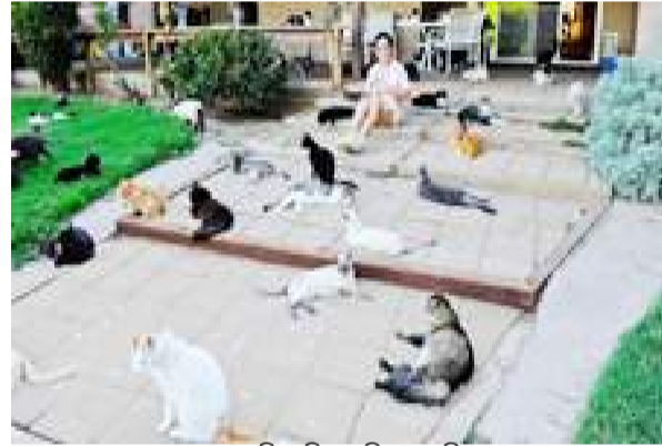
ଏଠାରେ ପୋଷା ଯାଇସାରିଲାଣି ବିଲେଇ ପିଞ୍ଜରରେ କଏଦ ହୋଇ ରୁହନ୍ତୁ । ସେମାନଙ୍କୁ ଖୁବ୍ ଜୋରରେ ଦୋଷିତା ଏବଂ ଗନ୍ଧ ଉପରେ କୁହନ୍ତି, ପୂ୍ ଚାହୁଁ ଯେ, କୌଣସି ଚର୍ଚ୍ଚିତା ଅଧିକାର ଅଛି । ଏହି

ଯଦି ଏହି ପୃଥିବୀରେ ବିଲେଇମାନଙ୍କ ପାଇଁ କେଉଁଠି ସୁଗ୍ରୀବୀ ଦେବେ ତାହା ହେଉଛି କାଲିଫର୍ଣିଆ । ଦି କ୍ୟାଟ ହାରସ୍ ଅଫ୍ ଦି କିଙ୍ଗମ୍ ନାମରେ ପ୍ରସିଦ୍ଧ ଏକ ଘରେ ବର୍ତ୍ତମାନ ୭୦୦ ବିଲେଇ ବାସ କରନ୍ତି । ବିଲେଇମାନଙ୍କ ରହିବା ପାଇଁ ସେଠାରେ ୯୮ ଡିଗ୍ରି ଉନ୍ନତ ପ୍ଲାନ ତିଆରି କରାଯାଇଛି । ଏହାକୁ ବିଶ୍ୱର ସବୁଠାରୁ ବଡ଼ ବିଲେଇ ଅଭୟାରଣ୍ୟ ବୋଲି କୁହାଯାଏ । ଏହି ଘରର ନିର୍ମାଣ ୧୯୯୨ରେ କରାଯାଇଥିଲା । ସେହିଦିନଠାରୁ ବର୍ତ୍ତମାନ ପର୍ଯ୍ୟନ୍ତ ପ୍ରାୟ ୨୫ ହଜାର ବିଲେଇଙ୍କୁ ଫଟୋସପ୍ଟର କମାଳ