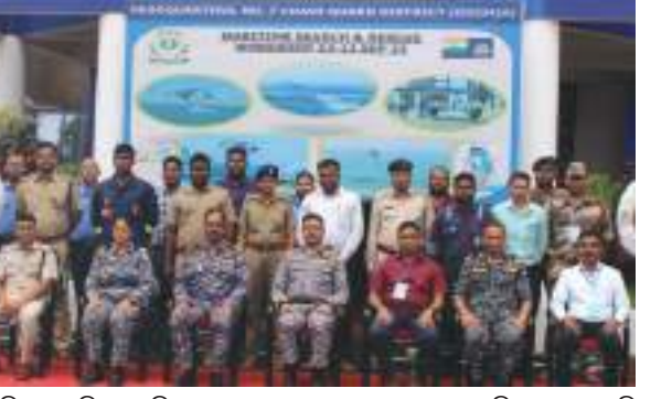
କରିଥିଲେ । ଦ୍ୱିତୀୟ ଦିନରେ ଏକ ମକ୍ ଡ୍ରାଇ ପ୍ରଦର୍ଶିତ ହୋଇଥିଲା । କର୍ମଶାଳାରେ ପାରାଦୀପ ବନ୍ଦର, କଣ୍ଠମ ବିଭାଗ, ସାମୁଦ୍ରିକ ପୋଲିସ୍, ସିଆଇଏସଏଫ, ମସ୍ୟୁ ବିଭାଗ ଅଂଶଗୁଣ କରିଥିଲେ । ଉପକୂଳ