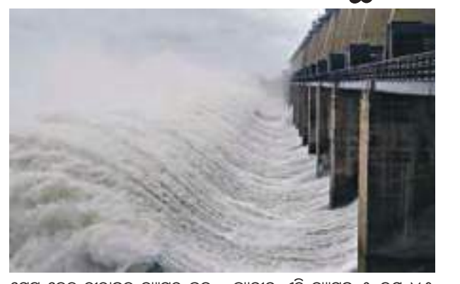
ଗେଟ ଦେଇ ହୀରାକୁଦ ତ୍ୟାମର ଜଳ ନିଷ୍କାସନ ହେବ । ସକାଳ ୬ଟା ସୁଦ୍ଧା ତ୍ୟାମର ଜଳସ୍ତର ୬୨୮.୭୧ ଫୁଟ ରହିଥିବାର ପୂର୍ତ୍ତନ ମିଳିଛି । ଏହା

ସମ୍ବଲପୁର, ୧୪।୯(ପି.ଏନ) : ବଙ୍ଗୋପସାଗରରେ ଲଘୁତାପ ସୃଷ୍ଟି ହୋଇଛି । ଏନେଇ ରାଜ୍ୟରେ ପ୍ରବଳରୂପେ ଅତି ପ୍ରବଳ ଜଗାତାର ଭାବେ ବର୍ଷା କାରି ରହିଛି । ହୀରାକୁଦର ଉପରମୁଣ୍ଡରେ ଲଘୁତାପ ଜନିତ ବର୍ଷା ହେବାରୁ ମୁଖ୍ୟମନ୍ତ୍ରୀ ଗତକାଳି ଅପରାହ୍ଣ ୪ଟା ବେଳେ ତ୍ୟାମର ଗେଟ ଖୋଲିବା ପାଇଁ ଆଦେଶ ଦେଇଥିଲେ । କିନ୍ତୁ ରାଜ୍ୟରେ ବର୍ଷା ଲାଗି ରହିଥିବାରୁ ଆଜି ପୁଣି ୮ଟି ଗେଟ ଖୋଲା ଯାଇଛି । ପୂର୍ତ୍ତନ ଅନୁସାରେ, ହୀରାକୁଦ ତ୍ୟାମର ଗତକାଳି ୨ଟି ଗେଟ ଖୋଲା ଯାଇଥିବା ବେଳେ ଆଜି ପୁଣି ୮ଟି ଗେଟ ଖୋଲା ଯାଇଛି । ବର୍ତ୍ତମାନ ମୋଟ ୧୦ଟି