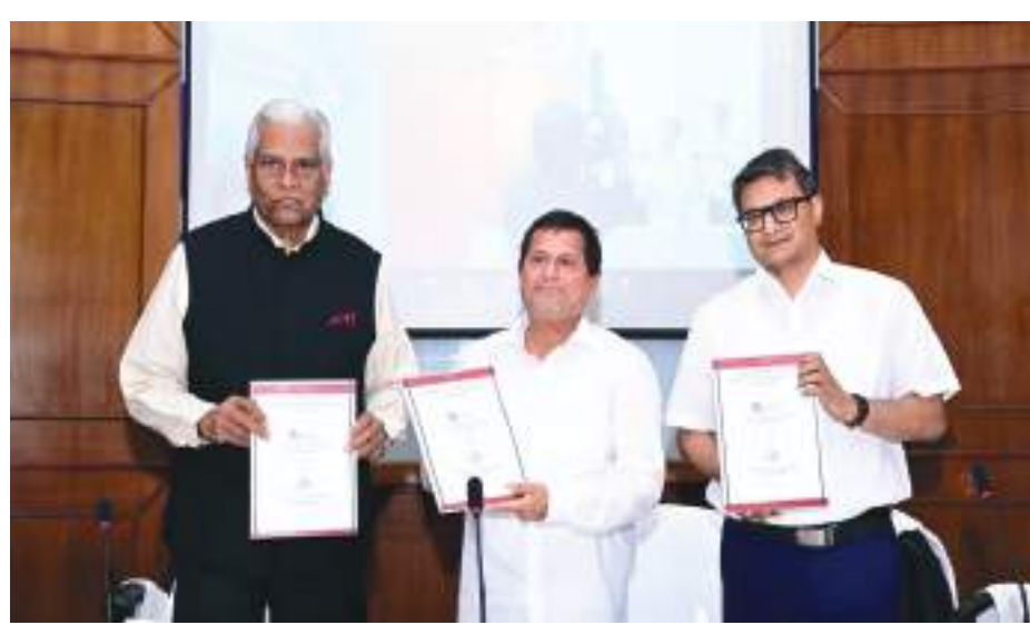
ବିଭିନ୍ନ କାର୍ଯ୍ୟକ୍ରମ ପ୍ରଦାନ ପ୍ରମାଣ ପତ୍ର ଗ୍ରହଣ କରାଯାଇଛି । ଏହି ପତ୍ରରେ କିସ କାର୍ଯ୍ୟକ୍ରମ ଓ ସମସ୍ତ ପ୍ରକାର ପ୍ରଭାବ ନେଇ ଆସ୍କି ପକ୍ଷରୁ ଉତ୍ତମ ପ୍ରଶଂସା କରାଯାଇଛି । କିସର କାର୍ଯ୍ୟକ୍ରମ

ଭୁବନେଶ୍ୱର, (ପି.ଏନ): ଶିକ୍ଷା କମିଶନର ଦୀର୍ଘ ୩୦ ବର୍ଷ ହେଲା କଳକାଳି ସମ୍ମାନକରଣ କଳିଆସ୍କି ପ୍ରତିଷ୍ଠା କଲିକା ଜନଶ୍ରେଣୀର ଅର୍ଥ ଯୋଗିଆଳି ଯାଜନସେବ (କିସ)ର ପ୍ରଭାବକୁ ଯାଜନସେବର ଆଦିନିଷ୍ଠେଷ୍ଟିରୁ ଅର୍ଥ କଲେଜ ଅର୍ଥ ଉଦ୍ଧାର (ଆସ୍କି) ଭୂୟସୀ ପ୍ରଶଂସା କରିଛି । ଆସ୍କି ହେଉଛି ଭାରତ ସରକାରଙ୍କ ସର୍ବ ପ୍ରଗତିତ ଗବେଷଣା ଓ ତାଲିମ୍ ଅନୁଷ୍ଠାନ । ଏହା ବିଶ୍ୱର ବୃତ୍ତୀୟ ଅନୁଷ୍ଠାନ ହୋଇଥିବା ବେଳେ ଏସିଆର ଏକମାତ୍ର ଅନୁଷ୍ଠାନ । ବିଶ୍ୱର ସର୍ବବୃହତ ଜନକାଳି ଅନୁଷ୍ଠାନ କିସ ସର୍ବଦା କାଳିଆସ୍କିର ପ୍ରାଥମିକ ଲକ୍ଷ୍ୟ ପୂରଣ ଦିଗରେ କାର୍ଯ୍ୟ କରିଆସୁଛି । ଏ ଦିଗରେ କିସର ବିଭିନ୍ନ କାର୍ଯ୍ୟକ୍ରମର ପ୍ରଭାବ କିପରି ରହିଛି ସେ ନେଇ ପୂର୍ଣ୍ଣାୟତନ କରିବା ପାଇଁ ଆସ୍କିକୁ ଦୀର୍ଘଦିନ ଆୟାଜିତ ହେଲା । ଆସ୍କି ପକ୍ଷରୁ ଦୀର୍ଘ ୧ ବର୍ଷ ଧରି କିସ କାର୍ଯ୍ୟକ୍ରମ