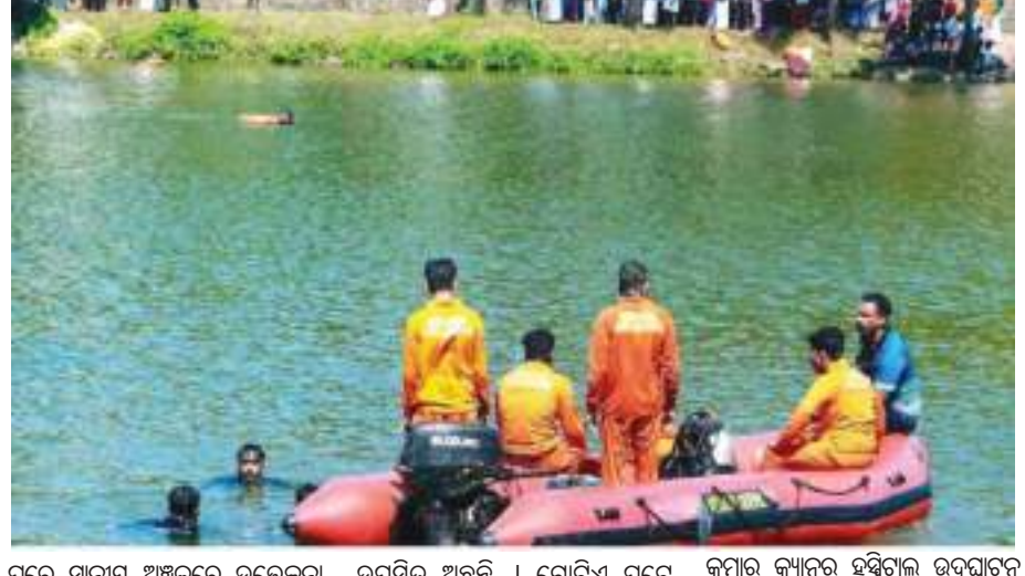
ପରେ ସ୍ଥାନୀୟ ଅଞ୍ଚଳରେ ଉଦ୍ଧାରକାରୀ ପରିଷ୍ଟିତ ଦେଖା ଦେଇଛି । ଉଦ୍ଧାରକାରୀ ଦଳ ପୋଲିସ୍ ଅନେକ ବଡ଼ ଅଧିକାରୀ ଉପସ୍ଥିତ ଅଛନ୍ତି । ଗୋଟିଏ ପଟେ ଏଠାରେ ଡଙ୍ଗା ଓଲଟି ଥିବା ବେଳେ ଅନ୍ୟପଟେ ଆଜି ମୁଖ୍ୟମନ୍ତ୍ରୀ ନୀତିଶ

ବିହାର, ୧୪।୯(ପି.ଏନ): ବିହାରର ମୁଜାଫରପୁର ଜିଲ୍ଲାରେ ଘଟିଛି ଏକ ଦୁଃଖଦ ଘଟଣା । ଏଠାରେ ବାଗମତି ନଦୀରେ ଏକ ଡଙ୍ଗା ଓଲଟି ଯାଇଛି । ଏହି ଡଙ୍ଗାଟି ଛୋଟ ପିଲାଙ୍କୁ ନେଇ ସ୍କୁଲରେ ଛାଡ଼ିବାକୁ ଯାଉଥିଲା । ପୂର୍ତ୍ତନା ଅନୁସାରେ ଡଙ୍ଗାରେ ୩୪ ପିଲାଥିଲେ । ଏପରିକି କିଛି ପିଲାଙ୍କୁ ଉଦ୍ଧାର କରାଯାଇଛି ଏହା ସହ ଅନେକ ପିଲା ନିଶୋକ ରହିଛନ୍ତି । ଏହି ଘଟଣାର ପୂର୍ତ୍ତନା ପାଇବା ପରେ ଘଟଣାସ୍ଥଳରେ ପୋଲିସ୍ ଏବଂ ଉଦ୍ଧାରକାରୀ ଦଳ ପହଞ୍ଚି ପିଲାମାନଙ୍କ ଉଦ୍ଧାର କାର୍ଯ୍ୟ ଜାରି ରଖିଛନ୍ତି । ତେବେ ଅନେକ ପିଲା ଏବେ ନିଶୋକ ଥିବା ଜଣାପଡ଼ିଛି । ପ୍ରଥମେ ଘଟଣାସ୍ଥଳରେ ପୋଲିସ୍ ପହଞ୍ଚିଥିଲା ଓ ପରେ ଉଦ୍ଧାରକାରୀ ଦଳ ପହଞ୍ଚି ଉଦ୍ଧାର କରିଥିଲେ । ଏହି ଘଟଣା