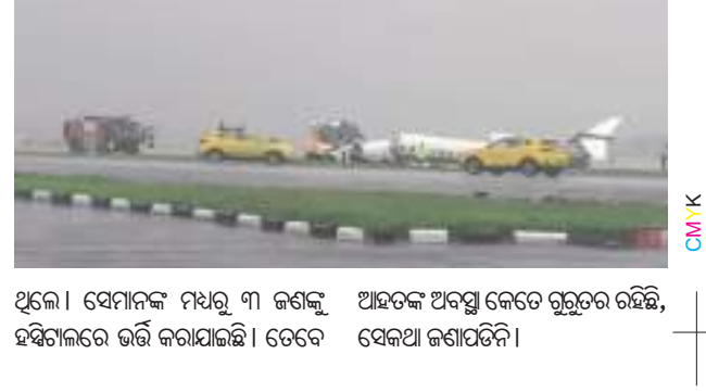
ଥିଲେ । ସେମାନଙ୍କ ମଧ୍ୟରୁ ୩ ଜଣଙ୍କୁ ଆଘାତ ଅନୁଭବ କେତେ ଗୁରୁତର ରହିଛି, ସେକଥା ଜଣାପଡ଼ିନା ।

ମୁମ୍ବାଇ, ୧୪।୯(ପି.ଏନ): ମୁମ୍ବାଇ ଏୟାରପୋର୍ଟରେ ପ୍ରବଳ ବର୍ଷା ଯୋଗୁ ବଡ଼ ଅଘଟଣ ଘଟିଛି । ଗୋଟିଏ ଘରୋଇ ଚୁର୍ଚ୍ଚିତ ବିମାନ ଆଜି ମୁମ୍ବାଇ ଏୟାରପୋର୍ଟରେ ଲ୍ୟାଣ୍ଡ କରୁଥିବା ବେଳେ ରନଫ୍ଲୋ ଖସି ଯାଇଛି । ବିମାନଟି ରନଫ୍ଲୋ ଖସିବା ପରେ ଦି'ଖଣ୍ଡ ହୋଇଯିବା ସହ ଏଥିରେ ନିଆଁ ମଧ୍ୟ ଲାଗି ଯାଇଛି । କ୍ରାନ୍ତ ବେଳେ ବିମାନରେ ୬ ଜଣ ଯାତ୍ରୀ ଓ ଦୁଇ ଜଣ କ୍ରୁ ସଦସ୍ୟଙ୍କୁ ମିଶାଇ ମୋଟ ୮ ଜଣ ଲୋକ