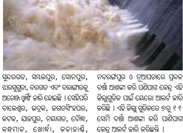
ହୀରାକୁଦରେ ୧୦ଟି ଗେଟ ଖୋଲିଲା ଯୋଗୁଁ ଜଳସ୍ତର ୬୨୮.୬୭ ଫୁଟ ରହିଛି ।

ସମ୍ବଲପୁର, ୧।୧୦(ପି.ଏନ) : ଆସନ୍ତା ୨ ଦିନ ପର୍ଯ୍ୟନ୍ତ ରାଜ୍ୟରେ ବର୍ଷା ଜାରି ରହିବ । ଏନେଇ ପାଣିପାଗ ବିଭାଗ ୧୩ଟି ଜିଲ୍ଲାକୁ ଯେଲୋ ଓ ଖାଣ୍ଟି ଜାରି କରିଛନ୍ତି । ଏହି ସବୁକୁ ଦୃଷ୍ଟିରେ ରଖି ହୀରାକୁଦରେ ୧୦ଟି ଗେଟ ଖୋଲା ଯାଇଛି । ସକାଳ ୬ଟା ସୁଦ୍ଧା ତ୍ୟାଗର ଜଳସ୍ତର ୬୨୮.୬୭ ଫୁଟ ରହିଛି । ହୀରାକୁଦ ତ୍ୟାଗରେ ୮୯,୩୯୯ କ୍ୟୁସେକ ଜଳ ପ୍ରବେଶ କରୁଥିବା ବେଳେ ୨,୦୩୧.୬୫୨ କ୍ୟୁସେକ ଜଳ ନିଷ୍କାସିତ ହେଉଛି । ସୂଚନା ଅନୁଯାୟୀ, ରାଜ୍ୟରେ ଲଗୁତ୍ୟାପ ଜିନିତ ବର୍ଷା ଯୋଗୁଁ ଆଜି ମୟୂରଭଞ୍ଜ, କେନ୍ଦୁଝର, ଡେଙ୍କାନାଳ, ଅନୁଗୁଳ ସହିତ ଦେବଗଡ଼, କନ୍ଧମାଳ, ଖୋର୍ଦ୍ଧା, କଳାହାଣ୍ଡି, ନବରଙ୍ଗପୁର ଓ ନୂଆପଡ଼ାରେ ପ୍ରବଳ ବର୍ଷା ଆଶଙ୍କା କରି ପଶିପାଗ କେନ୍ଦ୍ର ଏହି ଜିଲ୍ଲାଗୁଡ଼ିକ ପାଇଁ ଯେଲୋ ଆଲର୍ଟ ଜାରି କରିଛି । ଏହାପରେ ଦିନ ପର୍ଯ୍ୟନ୍ତ ଓଡ଼ିଶା ସହିତ କିଛି କେନ୍ଦ୍ରୀୟ ଜିଲ୍ଲାରେ ଏହି ସ୍ଥିତି ଜାରି ରହିବ ବୋଲି ପଶିପାଗ କେନ୍ଦ୍ର କହିଛି ।