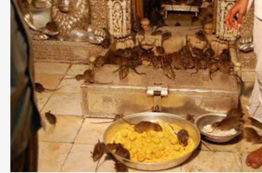
ଭାରତର ରାଜସ୍ଥାନରେ ବିଭିନ୍ନ ପ୍ରକାର ଲୋକ ଦେଖିବାକୁ ମିଳୁଥିବା ବେଳେ ସେମାନଙ୍କର ପରମ୍ପରା ମଧ୍ୟ ଅଲଗା ପ୍ରକାରର ହୋଇଥାଏ । ଥାର ମରୁଭୂମି ନିକଟରେ ଦେଶବାସୀଙ୍କ ନାମକ ଏକ ଛୋଟ ସହର ରହିଛି । ଏହି ସହରରେ କରଣା ମାତା ମନ୍ଦିର ୨୦୫୩ରେ ମୁଷାଙ୍କୁ ସୈନିକ ରହିଛି । ଏହି ମନ୍ଦିର ସେଠାରେ ଥିବା ସବୁକି ନିୟୋଜିତ କରାଯାଇଥିଲା ।

ଅନ୍ୟ ହିନ୍ଦୁ ମନ୍ଦିର ମଧ୍ୟରୁ ଗୋଟିଏ । କରଣା ମନ୍ଦିରକୁ ନେଇ ଲୋକମାନଙ୍କ ମନରେ ଅନେକ ଆଧ୍ୟାତ୍ମିକ ଭାବନା ରହିଛି । ମନ୍ଦିରରେ କରଣା ମାତାଙ୍କୁ ପୂଜା କରିବା ସହିତ ସେଠାରେ ମୁଷାମାନଙ୍କୁ ମଧ୍ୟ ପୂଜା କରାଯାଏ । ଆଶ୍ଚର୍ଯ୍ୟର କଥା ସେଠାରେ ଗୋଟିଏ ଦୁଇଟି ମୁଷା ନୁହେଁ ବରଂ ପାଖାପାଖି ୨୦୫୩ରେ ମୁଷା ରହନ୍ତି ସେହି ମନ୍ଦିରରେ । ସେଠାକାର ମୁଷାମାନେ କବାଟ ନାମରେ ପରିଚିତ । ଲୋକକଥା ଓ ପରମ୍ପରା ଅନୁସାରେ, ମୁଷାମାନଙ୍କୁ ନେଇ ଦୁଇଟି କାହାଣୀ ରହିଛି । କୁହାଯାଏ ସେଠାରେ ଜନ୍ମ ହୋଇଥିବା ସବୁ ଶିଶୁ ମୁଷା ହୋଇ ଏକ ଛୋଟ ସହର ରହିଛି । ଜନ୍ମ ନେଲେ । ଦ୍ୱିତୀୟତଃ ଯେଉଁଠାରେ କରଣା ମାତା ମନ୍ଦିର ୨୦୫୩ରେ ମୁଷାଙ୍କୁ ସୈନିକ ରହିଛି । ଏହି ମନ୍ଦିର ସେଠାରେ ଥିବା ସବୁକି ନିୟୋଜିତ କରାଯାଇଥିଲା ।