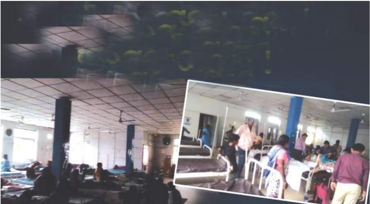
ଲାଇଟ ନଥିବାରୁ ମୋବାଇଲ ଲାଇଟରେ ହୋଇଛି ରୋଗୀ ସେବା । ଶନିବାର କଟକ ବଡ଼ ମେଡିକାଲ ମେଡିସିନ୍ ବିଭାଗରେ

କଟକ, ୧।୧୦(ପି.ଏନ): କଟକ ବଡ଼ ମେଡିକାଲରେ ମୋବାଇଲ ଲାଇଟରେ ହେଉଛି ରୋଗୀ ସେବା। ପୁଣି ଘଣ୍ଟା ଘଣ୍ଟା ଲାଇଟ ନଥିବାରୁ ରୋଗୀ ହେଉଛନ୍ତି କଲବଳ। ନିଦାନ ବିଭାଗରେ ଚେଷ୍ଟା ବି ବନ୍ଦ। ରୋଗୀଙ୍କ ଜୀବନ ସହ ଚାଲିଥିବା ଏ ଖେଳକୁ ବି କ'ଣ ବିଶ୍ୱାସରାୟ ବୋଲି ପ୍ରଶ୍ନ କଲେଣି ରୋଗୀଙ୍କ ସଂପର୍କୀୟ । ଏସ୍‌ସିକୁ ସରକାର ବିଶ୍ୱାସରାୟ ମେଡିକାଲ କରିଥିବା କହୁଥିବେଳେ ଏଠାରେ ଥିବା ଅନ୍ଧାକଣ୍ଠ ନେଇ ଶୋଭା ପ୍ରକାଶ କରୁଛନ୍ତି ରୋଗୀଙ୍କ ସମ୍ପର୍କୀୟ । କେବଳ ଅଭିଯୋଗ ଆସିବି ବନ୍ଦ ଏସ୍‌ସିରେ ଚାଲିଥିବା ଅନ୍ଧାକଣ୍ଠ ଦୁଇଟି ତାଳା ଅଦେଖା ବୃତ୍ତ ବି ସମ୍ପର୍କୀୟ ପାମ୍ପୁଲୁ ଆସିଛି । ଗୋଟିଏ ମୋବାଇଲ ଲାଇଟରେ ରୋଗୀସେବା ବେଳର ଦୁଃଖ ଓ ଅନ୍ଧାରି ହେଲା ଲାଇଟ ନଥିବାରୁ ନିଦାନ ବିଭାଗରେ ପଡିଛି ତାଳା । ଶନିବାର କଟକ ବଡ଼ ମେଡିକାଲ ମେଡିସିନ୍ ବିଭାଗରେ