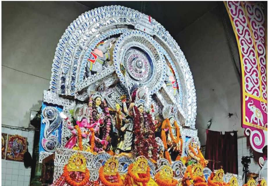
ଶହାଦ ନଗର ଦୁର୍ଗା ମଞ୍ଚପରେ ମହାଷ୍ଟମୀ ସହି ପୂଜା