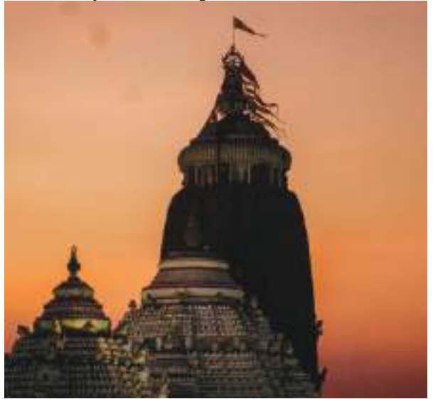
ସମେତ ୧୫ ଜଣିଆ ଟିମ୍ ଏହି ଯାତ୍ରରେ ସାମିଲ ରହିଅଛି । ୩୫ କ୍ୟାମେରା ବ୍ୟବହାର କରି ଉନ୍ନତ ବୈଷୟିକ ଜ୍ଞାନ କୌଶଳରେ ଯାତ୍ରା କରାଯାଇଛି । ଯାତ୍ରା ପରେ ଏସବୁଆଜି ସର୍ବିଶେଷ ରିପୋର୍ଟ ଶ୍ରୀମନ୍ଦିର ପ୍ରଶାସନକୁ ପ୍ରଦାନ କରିବ ବୋଲି ଜଣାପଡ଼ିଛି ।

ଭୁବନେଶ୍ୱର, ୨୮।୧୧(ପି.ଏନ.): ପ୍ରତୀକ୍ଷାର ଅନ୍ତ ଘଟିଲା । ଆରମ୍ଭ ହେଲା ଶ୍ରୀମନ୍ଦିର ରତ୍ନଭଣ୍ଡାର ଲେଜର ଧ୍ୟାନ । ଶ୍ରୀମନ୍ଦିର ପାଟଅଗଣାରେ ଥିବା ସୂର୍ଯ୍ୟମନ୍ଦିର ସମ୍ମୁଖରେ ରହିଛି ରତ୍ନ ଭଣ୍ଡାର । ଯାହାକୁ ଅନୁମୋଦିତ ବୋଲି କୁହାଯାଇଥାଏ । ସେହି ମନ୍ଦିରର ଚୂଡ଼ା ନାହିଁ । ଆଜି ଏସବୁ ? ଆଜ ପକ୍ଷରୁ ପ୍ରଥମେ ନାଲିକଟା ମଣ୍ଡପ ସମ୍ମୁଖରୁ ପର୍ଯ୍ୟାୟ କ୍ରମେ ଲେଜର ଧ୍ୟାନ କରାଯାଇଥିଲା । ବାହାର ପାର୍ଶ୍ୱରୁ ଏହି ଧ୍ୟାନ କରାଯାଇଛି । ଯାହା ପାଇଁ ଆଜି ଏସବୁ ? ଆଜର ଏକ ସ୍ୱତନ୍ତ୍ର ବୈଷୟିକ ଟିମ୍ ଅନୁସନ୍ଧାନ ଆରମ୍ଭ କରିଛି । ସ୍ୱତନ୍ତ୍ର ଅତ୍ୟାଧୁନିକ ଜ୍ଞାନ କୌଶଳ ସମ୍ପନ୍ନ ୩୫ ଗୋଟିଏ ଲେଜର ଧ୍ୟାନ ଦ୍ୱାରା ରତ୍ନ ଭଣ୍ଡାର ବାହାର ପାର୍ଶ୍ୱରୁ ଆରମ୍ଭ ହୋଇଛି । ମୁସାଇର ୩ ଜଣ ଇଞ୍ଜିନିଅରଙ୍କ