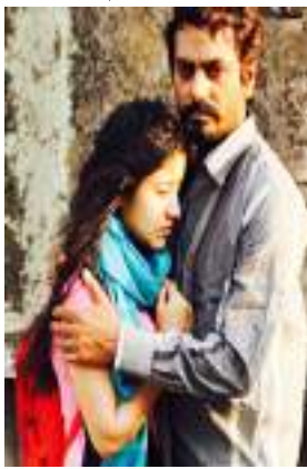
ପ୍ରଫେସରଙ୍କ ସହ ପ୍ରେମକାହାଣୀକୁ ଦର୍ଶାଯାଇଛି । ନିଜକୁ ଗାଁର ଛବି ଓ ଏହାର ସଜ୍ଜାତ ଟ୍ରେଲରଟିକୁ ଅଧିକ ଆକର୍ଷଣୀୟ କରିଛି ।

ନୃତ୍ୟକରଦିନ ସିଦ୍ଧିକି ଓ ଶ୍ୱେତା ଚୂପାଠାଙ୍କ ଅଭିନୀତ ଫିଲ୍ମ 'ହରାମ୍‌ଖୋର'ର ଟ୍ରେଲର ରିଲିଜ୍ କରାଯାଇଛି । ପୂର୍ବରୁ ଫିଲ୍ମକୁ ନେଇ କିଛି ସମସ୍ୟା ଦେଖାଦେଇଥିଲା । ମାତ୍ର ଫିଲ୍ମଟି ସମାଜକୁ ଏକ ସୁନ୍ଦର ବାର୍ତ୍ତା ପ୍ରଦାନ କରୁଥିବାରୁ ଏହାର ବ୍ୟାପକ ହଟ୍‌ଟାକ୍‌ଦିଆଯାଇଛି । ଗୁଜୁରାଟର ଏକ ଛୋଟ ଗାଁରେ ସୂଚି କରାଯାଇଛି ସମ୍ପୂର୍ଣ୍ଣ ଫିଲ୍ମ । ଶ୍ଳୋକ ଶର୍ମାଙ୍କ ନିର୍ଦ୍ଦେଶନାରେ ମାତ୍ର ୧୨ଦିନରେ ଶେଷ ହୋଇଛି ପୂରା ଫିଲ୍ମର ସୂଚି । ଫିଲ୍ମର କାହାଣୀରେ ଜଣେ ୧୪ବର୍ଷର ଝିଅର ନିଜ