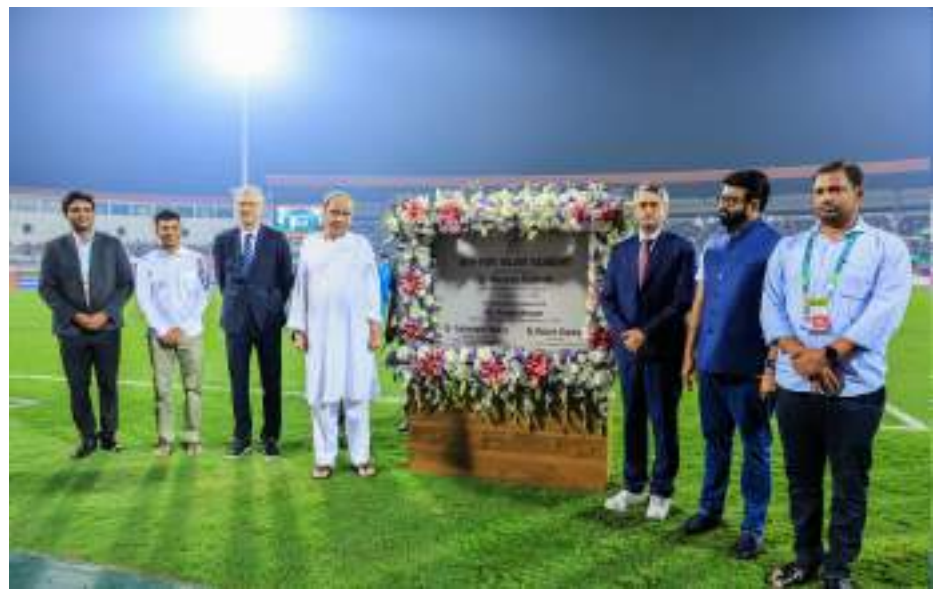
ଏଥାକ୍ଷୟ-ଏଫ୍-ସିଆ ଟ୍ୟାଲେଣ୍ଟ ଏକାଡେମୀ ଉଦ୍‌ଘାଟନ କଲେ ମୁଖ୍ୟମନ୍ତ୍ରୀ ନବୀନ ପଟ୍ଟନାୟକ

ଯୁବରାଜ ମଧ୍ୟ ଦାଉଁ ଦିନ ଧରି ଦଳ ବାହାରେ ରହିବାକୁ ପୁଣି ଥରେ ଏହାକୁ ଅଣଦେଖା କରାଯାଇଛି। ନିକଟରେ ଘରୋଇ ମ୍ୟାଚ୍ରେ ସେ ଭଲ ପ୍ରଦର୍ଶନ କରିଛନ୍ତି। ସୁପି ପାଇଁ ଖେଳୁଥିବା ବେଳେ ଭୁବନେଶ୍ୱର ପଞ୍ଚାବ ବିପକ୍ଷରେ ୨ ଟ୍ରେକେଟ ନେଇଥିଲେ। ଗୁଜୁରାଟ ବିପକ୍ଷରେ ୩ ଟ୍ରେକେଟ ନେଇଥିଲେ। ଅଷ୍ଟ୍ରେଲିଆ ବିପକ୍ଷରେ ୨୦ ବିଶ୍ୱକପ ଖେଳିବା ପାଇଁ ଖେଳାଳିଙ୍କୁ ଚିନି ଲୁଣିଆ ସୁଯୋଗ ଦେଇଛି।