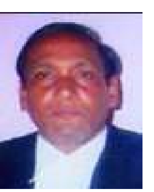
ଓଡ଼ିଆ ମାଟିର ସୁଯୋଗ୍ୟ ସହୀଦ ଭାରତ ମାତାର ବୀର ପୁତ୍ର ସହୀଦ ଲକ୍ଷ୍ମଣ ନାୟକ ଦେଶର ସ୍ୱାଧୀନତା ପାଇଁ ନିଜ ପ୍ରାଣବଳୀ ଦେଇଥିଲେ । ସେ ୧୮୯୯ ମସିହା