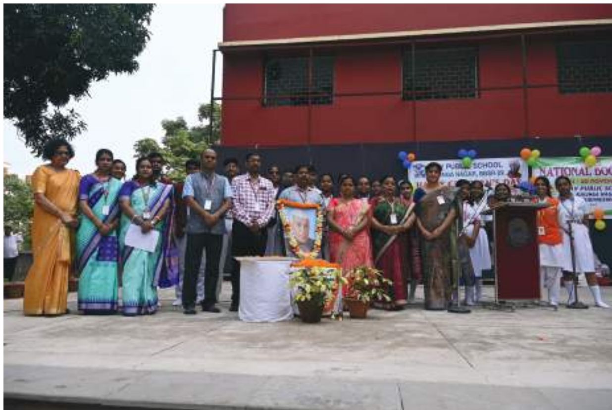
ଡି.ଏ.ଭି କଲିଙ୍ଗ ନଗରଠାରେ ଶିଶୁ ଦିବସ ଉତ୍ସବ ପାଳିତ । ଏହି ଅବସରରେ ଶିକ୍ଷକ ଶିକ୍ଷୟିତ୍ରୀ ମାନଙ୍କ ଦ୍ୱାରା ସମବେତ କଣ୍ଠ ସଂଗୀତ, ନୃତ୍ୟ ଏବଂ ଏକ ନାଟକ ମଞ୍ଚସ୍ଥ କରାଯାଇଥିଲା