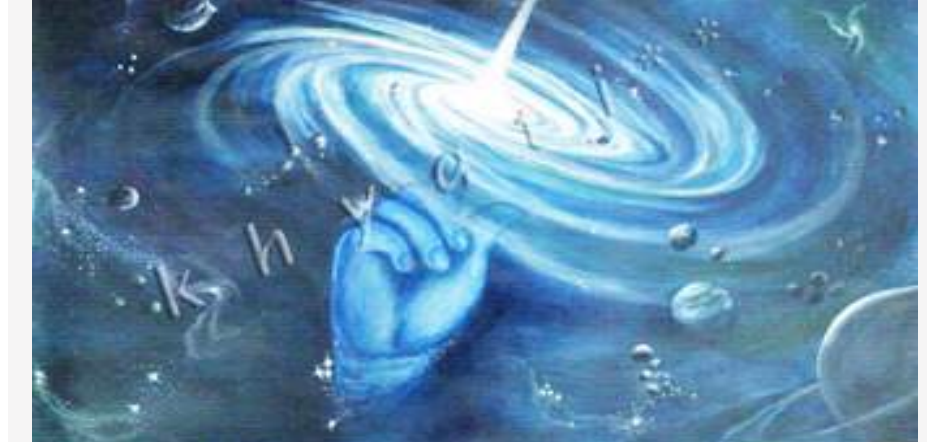
କାବନରେ କୌଣସି ଜିନିଷ ହଜିଯିବା, ହଜିଯାଇଥିବା ଜିନିଷ ଖୋଜିଲେ ନ ମିଳିବା ଆଦି ସମସ୍ୟା ମନକୁ ଭାରାନ୍ତ କରିଦିଏ । ଏଭଳି

ପରିସ୍ଥିତିରେ କାର୍ତ୍ତିକେୟଙ୍କୁ ରାଜା ଯିଏ ହେଉ ବ୍ୟତୀତ ତା ଭଗବାନ ବିଷ୍ଣୁଙ୍କ ସୁଦର୍ଶନ ଚକ୍ରର ଅବତାର ବୋଲି କୁହାଯାଇଥାଏ । ତାଙ୍କର ସାଧନା କରିବା ଦ୍ୱାରା ଏହି ସବୁ ସମସ୍ୟାରୁ ଉଦ୍ଧୃତ ମିଳିଥାଏ । ପୁରାଣରେ ବର୍ଣ୍ଣିତ ହୋଇଛି ଯେ ସୁଦର୍ଶନ ଚକ୍ର ଯେ କୌଣସି ଦିନକୁ ଯାଇ ହଜିଥିବା ଜିନିଷ ଖୋଜି ଆଣିବାର ସାଧନା କରିଥାଏ । ଏହାର ସାଧନା ପାଇଁ ଦୀପାଳୀ ପୂର୍ଣ୍ଣିମା ଅଥବା ଭଗବାନ ବିଷ୍ଣୁଙ୍କୁ ପୂଜା କରିବା ଦ୍ୱାରା ମନକୁ ଭାରାନ୍ତ କରିଦିଏ । ଏଭଳି