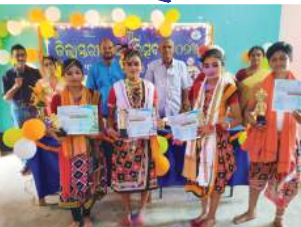
ନୃତ୍ୟ, ଏକକ ଅଭିନୟ, ଚିତ୍ରାଙ୍କନ ପ୍ରଭୃତି ପ୍ରତିଯୋଗିତା ଅନୁଷ୍ଠିତ ହୋଇଯାଇଛି । ଏହି କାର୍ଯ୍ୟକ୍ରମରେ

ପୁରୀ, (ପି.ଏନ): ଜିଲ୍ଲା ସ୍ତରୀୟ କଳା ଉତ୍ସବ ମଙ୍ଗଳବାର ସ୍ଥାନୀୟ ଏଲଆଇସି କଲୋନା ବିଦ୍ୟାଳୟ ପରିସରରେ ଅନୁଷ୍ଠିତ ହୋଇଯାଇଛି । ଏହି ଜିଲ୍ଲା ସ୍ତରୀୟ କଳା ଉତ୍ସବ-୨୦୨୩ କାର୍ଯ୍ୟକ୍ରମ ବିଦ୍ୟାଳୟ ଓ ଗଣଶିକ୍ଷା ବିଭାଗ, ଓଡିଶା ସରକାରଙ୍କ ଏକ ଅଭିନବ ପ୍ରୟାସ । ଏହି କାର୍ଯ୍ୟକ୍ରମ ମୁଖ୍ୟ ଉଦ୍ଦେଶ୍ୟ ହେଉଛି, ପ୍ରତ୍ୟେକ ଛାତ୍ରଛାତ୍ରୀଙ୍କୁ ନିଜର ଉତ୍ତମ କଳାତalentକୁ ପରିପ୍ରକାଶ ଏବଂ ଶିକ୍ଷା ମାଧ୍ୟମରେ ପିଲାମାନଙ୍କର ପୂର୍ଣ୍ଣାଙ୍ଗ ବିକାଶ ଓ ବିଦ୍ୟାଳୟର ସର୍ବାଙ୍ଗୀନ ଉନ୍ନତି ସାଧନ କରିବା । କଳା ଉତ୍ସବରେ ଶାସ୍ତ୍ରୀୟ କଣ୍ଠ, ସଙ୍ଗୀତ, ଶାସ୍ତ୍ରୀୟ ନୃତ୍ୟ, ଲୋକ