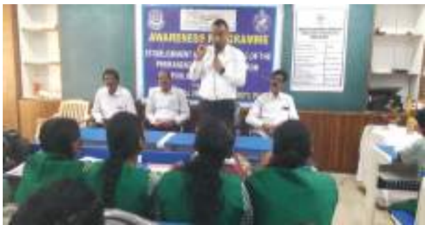
ବ୍ୟବସ୍ଥାର ଉଦ୍ଦେଶ୍ୟ ଓ କେନ୍ଦ୍ର ଏବଂ କିଶୋର ନ୍ୟାୟ ଉପରେ ଆଇନ ପ୍ରାଧିକରଣ ଅଧିକାରୀଙ୍କ ଦ୍ୱାରା ଆଇନ ସଚେତନତା ଶିବିର ଅନୁଷ୍ଠିତ ହୋଇଯାଇଛି ।

ପୁରୀ, (ପି.ଏନ): ପୁରୀ ଜିଲ୍ଲା ଆଇନ ସେବା ପ୍ରାଧିକରଣ ଅଧିକାରୀ ଡାକ୍ତରୀ ଓ ଦୌରାକଳ ଆଦେଶନୁସାରେ ପୁରୀ ଜିଲ୍ଲା ଆଇନ ସେବା ପ୍ରାଧିକରଣ ସଚିବ ଅଧିକାରୀଙ୍କ ଦ୍ୱାରା ଆଇନ ସଚେତନତା ଶିବିର ଅନୁଷ୍ଠିତ ହୋଇଯାଇଛି । ଏହି କାର୍ଯ୍ୟକ୍ରମ ପ୍ରାଧିକରଣ ସଚିବ ଅଧିକାରୀଙ୍କ ଦ୍ୱାରା ଆଇନ ସେବା ପ୍ରାଧିକରଣ ଅଧିକାରୀଙ୍କ ଦ୍ୱାରା ଆଇନ ସଚେତନତା ଶିବିର ଅନୁଷ୍ଠିତ ହୋଇଯାଇଛି । ଏହି କାର୍ଯ୍ୟକ୍ରମ ପ୍ରାଧିକରଣ ଅଧିକାରୀଙ୍କ ଦ୍ୱାରା ଆଇନ ସେବା ପ୍ରାଧିକରଣ ଅଧିକାରୀଙ୍କ ଦ୍ୱାରା ଆଇନ ସଚେତନତା ଶିବିର ଅନୁଷ୍ଠିତ ହୋଇଯାଇଛି ।