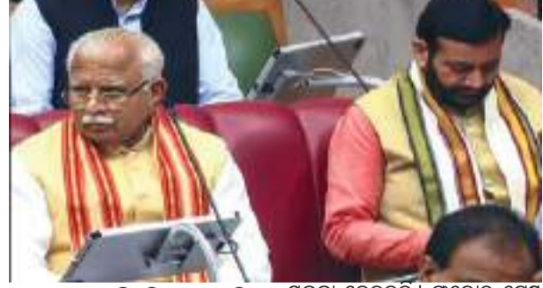
କାଠଗଡ଼କୁ ଚାଲିଛନ୍ତି। ଜେଜେପିର ୬ ଜଣ ବିଧାୟକ ବିଜେପି ସମ୍ପର୍କରେ ଥିବା ନେଇ ସୂଚନା ଦେଇଛନ୍ତି। ଏହାସହ କଂଗ୍ରେସରେ ୩୦ ବିଧାୟକ ମଧ୍ୟରୁ ୫ ଜଣ ବିଧାୟକ ମଧ୍ୟ ବିଜେପି ସମ୍ପର୍କରେ ଥିବା ନେଇ ଖଜୁରୀ

ଭୁବନେଶ୍ୱର, ୧୨।୫(ପି.ଏନ): ହରିଆଣାରେ ଜାରି ରହିଛି ରାଜନୈତିକ ସଙ୍କଟ। ସରକାରୀ ପୁଲିସ୍ ଭିତରେ ବି ଏଠାରେ ସରକାରୀ ଭାଙ୍ଗିଯିବା ସମ୍ଭାବନା ରହିଛି। ଏହାରି ଭିତରେ ହରିଆଣାର ପୂର୍ବତନ ମୁଖ୍ୟମନ୍ତ୍ରୀ ମନୋହର ଲାଲ୍ ଖଟ୍ଟର ଏକ ବଡ଼ ଦାବି କରିଛନ୍ତି। ବିଧାନସଭାରେ ଖୁବଶୀଘ୍ର ହରିଆଣା ସରକାରଙ୍କ ଫଲୋର ଟେଷ୍ଟ ହେବ ବୋଲି ସେ କହିଛନ୍ତି। ଏଥିପାଇଁ ହରିଆଣା ବିଧାନସଭାର ଏକ ସ୍ୱତନ୍ତ୍ର ଅଧିବେଶନ ଡକାଯିବ। ହରିଆଣାର ପୂର୍ବତନ ମୁଖ୍ୟମନ୍ତ୍ରୀ ମନୋହର ଲାଲ୍ ଖଟ୍ଟର କହିଛନ୍ତି ଯେ, ଜେଜେପିକୁ ଏହି କଥା ଉଚ୍ଚେକାର ନଥିଲା। ଏବେ ସେ ଏହି କଥାକୁ ଉଚ୍ଚେକାର ନିଜକୁ