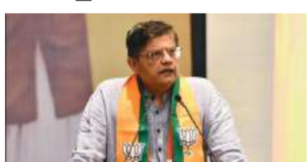
ପୋଷ କରି ବୈଜୟନ୍ତ ଲେଖୁଛନ୍ତି ଯେ ଓଡ଼ିଶାର ମୁଖ୍ୟମନ୍ତ୍ରୀଙ୍କୁ ତାଙ୍କ ପୂର୍ବତନ ପ୍ରଶାସକ ତଥା ଏବେକାର ପଲିଟିସିଆନ୍ ହ୍ୟାଣ୍ଡେଲର ଯେଉଁଭଳି

ଭୁବନେଶ୍ୱର, ୧୨।୫(ପି.ଏନ): ମୁଖ୍ୟମନ୍ତ୍ରୀ ନବୀନ ପଟ୍ଟନାୟକ ଶନିବାର ରାତି ପ୍ରାୟ ସାଢ଼େ ୯ଟାରେ ଏକ ଭିଡ଼ିଓ ଜାରି କରି ପ୍ରଧାନମନ୍ତ୍ରୀ ମୋଦିଙ୍କୁ ସମାଲୋଚନା କରିଥିଲେ। ମୁଖ୍ୟମନ୍ତ୍ରୀଙ୍କ ଭିଡ଼ିଓ ବାବୁ ପ୍ରସଙ୍ଗରେ ଓଡ଼ିଶାବାସୀଙ୍କୁ ବିଜେପିର ରାଷ୍ଟ୍ରୀୟ ଉପାଧ୍ୟକ୍ଷ ବୈଜୟନ୍ତ ପଣ୍ଡା ନିଜ ସୋଶାଲ ମିଡ଼ିଆ ହ୍ୟାଣ୍ଡେଲ୍ ଏକ୍ସରେ ବଡ଼ ଅପିଲ୍ କରିଛନ୍ତି। ନିଜର ସୋଶାଲ ମିଡ଼ିଆ ହ୍ୟାଣ୍ଡେଲ୍ ଏକ୍ସରେ