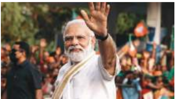
ଆସିବେ। ସେ ରାଉରକେଲା, କଣ୍ଟାବାଞ୍ଚି ଓ ସୋରଡ଼ରେ ସଭା କରିବେ। ୧୭ ତାରିଖରେ ଆସିବେ ବିଜେପି ରାଷ୍ଟ୍ରୀୟ ଅଧ୍ୟକ୍ଷ ଜେପି ନନ୍ଦା। ସେ ସୁନ୍ଦରଗଡ଼, ହିଞ୍ଜିଳି ଓ ପଦ୍ମପୁରରେ ନିର୍ବାଚନ ସଭାରେ ଯୋଗ ଦେବେ।