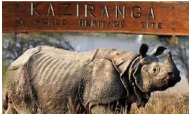
KALIRANGA WILDLIFE HERITAGE SITE

କିଛିବର୍ଷ ତଳୁ ମରାମତି ହୋଇନାହିଁ । ୧୦ରୁ ଉର୍ଦ୍ଧ୍ୱ ନିର୍ମାଣାଧୀନ ନଦୀସେତୁ ଦୀର୍ଘବର୍ଷ ତଳୁ ଅଧ୍ୟାପତନିଆ ଭାବେ ପଡ଼ି ରହିଛି । ଯେଉଁଥିପାଇଁ ହଜାର ହଜାର ଲୋକେ ନିଜ ଚାଷ, ସଦର ମହକୁମାରେ ପହଂଚିବାରେ ନାନା ଅସୁବିଧାର ସମ୍ମୁଖୀନ ହେଉଛନ୍ତି । ସମୁଦ୍ର ତଟବର୍ତ୍ତୀ ଗାଁଗୁଡ଼ିକର ଅବସ୍ଥା ଭାରି ସଂଯାତକ । ଭୃତ୍ୟଧର ଅନେକ ଗାଁ ସମୁଦ୍ର ଓ ନଦୀର ମହାପୁରୁଷରେ ମିଳେଇଯାଇଛି । ସାତଭାୟା ଅଂଚଳର ଅଧିକାଂଶ ଗ୍ରାମ ସମୁଦ୍ର ମହାପୁରୁଷରେ ଲୀନ ହୋଇଯାଇଥିବା ବେଳେ ବାକି ଥିବା ଗାଁଗୁଡ଼ିକ କେଉଁ ମୁହୂର୍ତ୍ତରେ ସମୁଦ୍ର ଗର୍ଭରେ ଲୀନ ହୋଇଯିବ, ତାହା ଭବବାନଙ୍କୁ ଜଣା । ଲୁଣା ଘେରିବନ୍ଧ ଖୁବ୍ ଦୁର୍ବଳ ଥିବାରୁ ସମୁଦ୍ରରୁ ଲୁଣାପାଣି ଆସି ଭେଡ଼ା ଭିତରେ ପଶୁଛି