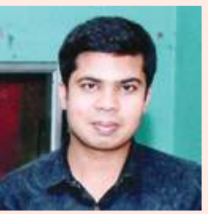
ଭୁବନାନନ୍ଦ ଅଧିକାରୀ କୀଟ ବିଦ୍ୟାଳୟ - ୪

ଅଧିକାରୀ କିମ୍ବା ଦେଖାଯାଏ ଏବଂ ଏହି କିମ୍ବା ପାଖରେ ପୋକ ଦ୍ୱାରା ନଷ୍ଟ ହୋଇଥିବା ଦୃଶ୍ୟ ତନ୍ମୁଗୁଡ଼ିକର ଅବଶିଷ୍ଟା ଦେଖିବାକୁ ମିଳେ । ମାତ୍ରାଧିକ ଶକ୍ତି ହେବା ପୂର୍ବରୁ ଏହି ଯୋଗର ଦମନ ନ କରାଗଲେ ନଡ଼ିଆଗଛ ଅଧିକ ଶକ୍ତିକାରୀ କୀଟ ଆକ୍ରମଣ ତଥା କବକଜନିତ ରୋଗ ଆକ୍ରମଣ ପାଇଁ ଉପଯୋଗୀ ହୋଇଯାଏ । ନିୟନ୍ତ୍ରଣ : ପୂର୍ଣ୍ଣାଙ୍ଗପ୍ରାୟ ଯୋଗଟି ସାଧାରଣତଃ ନଡ଼ିଆଗଛର ବାହୁଳ୍ୟ ଏବଂ ଫୁଲକୁ ମାତ୍ରାଧିକ ଆକ୍ରମଣ କରି ଶକ୍ତି ପ୍ରଦାୟ । ଏହି ଯୋଗ ଆକ୍ରମଣ ନଡ଼ିଆ ଫସଲରେ ହାରାହାରି ୧୦ ପ୍ରତିଶତ ଅନଳ ହାସଲ କରେ । ୩-୧୦ ବର୍ଷ ବୟସ ଗଛ ଗୁଡ଼ିକରେ ଏହି ଯୋଗର ଆକ୍ରମଣ ଜନିତ ଶକ୍ତି ଅଧିକ ହୋଇଥାଏ । ଆକ୍ରମଣ ବହୁଳ ଗୁଡ଼ିକର ପତ୍ର କଟିଯାଇଥିବା ଲକ୍ଷଣ କରାଯାଏ । ଏହାକୁ ବୈଜ୍ଞାନିକ ଭାଷାରେ ଜିଓମେଡିକ କବ, ଫ୍ୟାନକବ୍ ବୋଲି କୁହାଯାଏ । ସାଧାରଣତଃ ବିଶେଷ ଆକ୍ରମଣ ହୋଇ ନଥିଲେ ଗୋଟିଏରୁ ଦୁଇଟି ପତ୍ର କଟିଥାଏ । ଯଦି ଏହି ଯୋଗର ପ୍ରାକୃତ୍ୱିକ ମାତ୍ରାଧିକ ହୁଏ ଓ ଏହାର ଆର୍ଥିକ ହେତୁକା ସାମାଜିକ ଉତ୍ପାଦନ କରେ, ସମସ୍ତ ପତ୍ର ଏହିଭଳି କଟିଥିବା ଲକ୍ଷଣ କରାଯାଏ । ଏହା ଫଳରେ ସମ୍ପୂର୍ଣ୍ଣ ଖୋଲି ନଥିବା ବାହୁଳ୍ୟ ମୂଳରେ