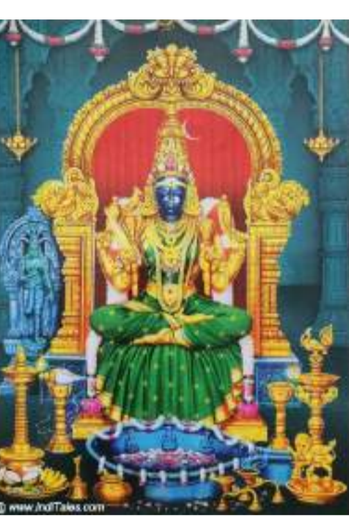
ଏହା ଉକ୍ତ ମାନଙ୍କ ସମାନ ପାଇବାର ବର ପ୍ରଦାନ କରିଥାଏ।

ଭୁବନେଶ୍ୱର (ସିଏନ୍) - ରାଜ୍ୟର ସର୍ବପ୍ରଥମ ରଞ୍ଜନ ଦୈନିକ ଓଡ଼ିଆ ଖବରକାଗଜ 'ସମୟ'ର ୨୫୦ତମ ବାର୍ଷିକ ସମାରୋହ ସଦର ଆଜି ଅଭରଣ୍ଡ ମନା କୋର୍ଟିଆର୍ ପରିସରରେ ଶୁକ୍ରବାର ଅନୁଷ୍ଠିତ ହୋଇଥିଲା।