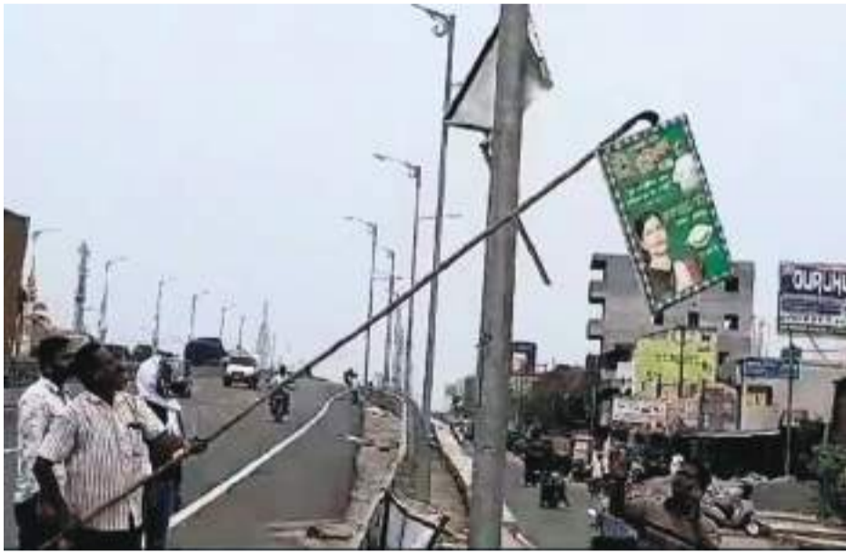
ବେଳେ ଅବଶ୍ୟକ ନୁହେଁ କିନ୍ତୁ ଆବଶ୍ୟକ ହୋଇଥିବା ବ୍ୟବସ୍ଥାକୁ ଲୋକେ ନେଇ ଯାଉଥିବା ତେବେ ଗ୍ରାମାଞ୍ଚଳରେ ଲଗାଯାଇଥିବା ଅଭିଯୋଗ ହୋଇଛି ।

ଧର୍ମଶାଳା, (ପି.ଏନ): ସାଧାରଣ ନିର୍ବାଚନ ପାଇଁ ଆବଶ୍ୟକ ବିଧି ଲାଗୁ ହେବାପରେ ଧର୍ମଶାଳା ବ୍ଲକ୍ ପ୍ରଶାସନ ପକ୍ଷରୁ ଫେଙ୍କୁ ହୋଡ଼ିଂ ଛକ ବଜାରରୁ ବିଭିନ୍ନ ରାଜନୈତିକ ଦଳ ଏବଂ ସରକାରୀ ଯୋଜନାର ଫେଙ୍କୁ ହୋଡ଼ିଂ ହଟାଯାଇଛି । ଗତବର୍ଷ ଡିସେମ୍ବର ମାସରେ ନୂଆବର୍ଷ ଅଭିନନ୍ଦନ, ଶୁଭେଚ୍ଛା ଜଣାଇବା ପାଇଁ ନେତାମାନେ ରାସ୍ତା ପାର୍ଶ୍ୱରେ ଫେଙ୍କୁ ବ୍ୟାନର ଓ ହୋଡ଼ିଂ ଲଗାଇବା ସହିତ ରାସ୍ତା ଉପରେ ଚୋରଣ କରିଥିଲେ । ମାମଲା ବିଚାରଣ ହେବା ପରେ ଫେଙ୍କୁ ହୋଡ଼ିଂ ହଟାଯାଇବା କାର୍ଯ୍ୟରେ ଲାଗିଛନ୍ତି । ସେହିପରି ବିଭିନ୍ନ ସରକାରୀ ଯୋଜନା ଏବଂ ପବ୍ଲିକ୍ କାର୍ଯ୍ୟ ପାଇଁ ଫେଙ୍କୁ ହୋଡ଼ିଂ ହଟାଯାଇଛି । କେତେକ ଫେଙ୍କୁ ହୋଡ଼ିଂ ବେଳେ ଅବଶ୍ୟକ ନୁହେଁ କିନ୍ତୁ ଆବଶ୍ୟକ ହୋଇଥିବା ବ୍ୟବସ୍ଥାକୁ ଲୋକେ ନେଇ ଯାଉଥିବା ତେବେ ଗ୍ରାମାଞ୍ଚଳରେ ଲଗାଯାଇଥିବା ଅଭିଯୋଗ ହୋଇଛି ।