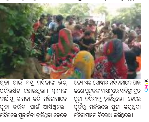
ପୂଜା ପାଇଁ ବହୁ ମହିଳାଙ୍କ ଭିଡ଼ ପରିଲକ୍ଷିତ ହୋଇଥିଲା । ସ୍ୱାମୀଙ୍କ ଦୀର୍ଘାୟୁ କାମନା କରି ମହିଳାମାନେ ପୂଜା କରିବା ପାଇଁ ଆସିଥିଲେ । ମନ୍ଦିରରେ ପୂଜାର୍ଚ୍ଚନା ଚାଲିଥିବା ବେଳେ ଅନ୍ୟ ଏକ ଗୋଷ୍ଠୀର ମହିଳାମାନେ ଆଉ ଜଣେ ପୂଜକଙ୍କ ମଧ୍ୟମରେ ସାବିତ୍ରୀ ବ୍ରତ ପୂଜା କରିବାକୁ ଚାହୁଁଥିଲେ । ହେଲେ ପୂର୍ବରୁ ମନ୍ଦିରରେ ପୂଜା କରୁଥିବା ମହିଳାମାନେ ବିରୋଧ କରିଥିଲେ ।

ଭୁବନେଶ୍ୱର, ୬।୬ (ପି.ଏନ.): ସ୍ୱାମୀଙ୍କ ଦୀର୍ଘାୟୁ କାମନା ପାଇଁ ଉପବାସ ରହି ସାବିତ୍ରୀ ବ୍ରତ ପୂଜା କରିବାକୁ ମହାଦେବ ମନ୍ଦିର ଆସିଥିଲେ ମହିଳା । ହେଲେ ମନ୍ଦିରରେ ପୂଜାର୍ଚ୍ଚନା କରିବେ କ'ଣ, ପିତାପିତା ଲାଗିଲେ । ପରିସ୍ଥିତି ଏମିତି ହେଲେ ଯେ ପୂଜିତ୍ୱକୁ ଆସିବା ପାଇଁ ପଡ଼ିଲା । ଆଜି ସକାଳେ ଏପରି ଘଟଣା ବାଲେଶ୍ୱର ଜିଲ୍ଲାରେ ଘଟିଛି । ଜଳେଶ୍ୱର ଥାନା ମହଲିଆ ଗାଁରେ ରହିଛି ମହାଦେବ ମନ୍ଦିର । ଏହି ମନ୍ଦିରରେ ଥିବା ପୂଜକ ପ୍ରତିଦିନ ଭୋଗଲେବାକୁ ପୂଜା କରନ୍ତି । ଆଜି ସକାଳେ ସାବିତ୍ରୀ ବ୍ରତ ଥିବାରୁ