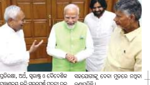
ପ୍ରତିରକ୍ଷା, ଅର୍ଥ, ସ୍ୱାସ୍ଥ୍ୟ ଓ ବୈଦ୍ୟଶିଳ୍ପ ମନ୍ତ୍ରୀମାନଙ୍କ ଭଳି ଗୁରୁତ୍ୱପୂର୍ଣ୍ଣ ପଦବୀ ଦଳ ସହଯୋଗୀଙ୍କୁ ଦେବା ପୂର୍ବରୁ ନଥିବା ଜଣାପଡିଛି ।

ଭୁବନେଶ୍ୱର, ୬।୬ (ପି.ଏନ.): ଏନଡିଏ ମେଣ୍ଟରେ ବହୁବାର ନାଲିକଣ୍ଠା ଚିତ୍ତିପି ଓ ନାଡ଼ାଗ କୁମାରଙ୍କ କେଡିପୁର ଗୁରୁତ୍ୱ ଦର୍ଶି ଯାଇଛି । ବିଜେପିକୁ ଏକାକୀ ସରକାର ଗଠନ କରିବାକୁ ମ୍ୟାଜିକ ନମ୍ବର ମିଳି ନଥିବାରୁ ଏହି ଦୁଇ ଦଳର ଆବଶ୍ୟକତା ରହିଛି । ଏହାକୁ ଦୃଷ୍ଟିରେ ରଖି ଭଉଣ ଦଳ କେନ୍ଦ୍ର କ୍ୟାବିନେଟର ବଡ଼ବଡ଼ ମନ୍ତ୍ରୀମାନଙ୍କୁ ନେବାକୁ ବାଧି କରିଛନ୍ତି । କିନ୍ତୁ ବିଜେପି ଅତି ସହଜରେ ସେମାନଙ୍କ କଥାକୁ ଗ୍ରହଣ କରିବ ନାହିଁ ।