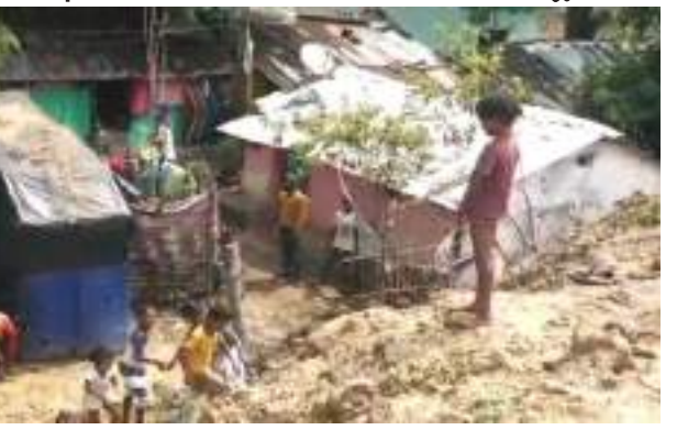
ଘରଗୁଡ଼ିକରେ ଭରି ହୋଇଯାଇଥିଲା । ଯାହାଫଳରେ ଘରର ସମସ୍ତ ଆସବାବପତ୍ର ଏବଂ ବୈଦ୍ୟଶିଳ୍ପ ସାମଗ୍ରୀ ପାଣିରେ ଭିଜି ନଷ୍ଟ ହୋଇଥିଲା । ଏପରିକି ଘରେ ରହିବା ପାଇଁ ମଧ୍ୟ କୌଣସି ଜାଗା ରହିଲା ନାହିଁ ।

ମାଲକାନଗିରି, ୬।୬ (ପି.ଏନ.): ମାଲକାନଗିରିର ବାଲିସାଗରରୁ ଏବେ ଉନ୍ନତ କରଣ କରାଯାଉଛି । କୋଟି-କୋଟି ଟଙ୍କା ବ୍ୟୟରେ ଏହି ବାଲି ସାଗରକୁ ପୁନଃ ମରାମତି ସହ ଏହାର ଉନ୍ନତକରଣ କରାଯାଉଥିବା ବେଳେ ସାଗର ପାର୍ଶ୍ୱରେ ଥିବା ଘରଗୁଡ଼ିକ ଏବେ ବିପଦପୂର୍ଣ୍ଣ ଅବସ୍ଥାରେ ରହିଛି । ସାଗରର ହୁତାଗୁଡ଼ିକ ବହୁ ଉଚ୍ଚ ହୋଇଥିବା ବେଳେ ପାର୍ଶ୍ୱରେ ଥିବା ଘରଗୁଡ଼ିକ ପ୍ରାୟ ୨୦ ଫୁଟ ଉଚ୍ଚ ରହିଛି । କାଳବୈଶାଖୀ ବର୍ଷା ହେବା ଯୋଗୁଁ ଏହି ଠଳିଆ ଲୋକେ ବହୁ ହଇଜା ହୋଇଛନ୍ତି । ବର୍ଷାର ପାଣି ନିଷାସନ ହୋଇନପାରି ଏହି