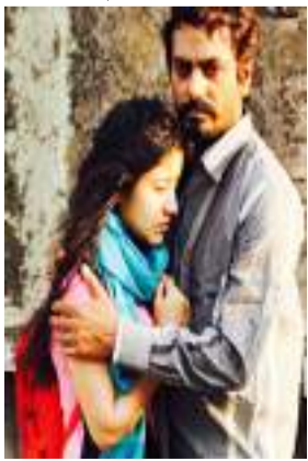
ପ୍ରଫେସରଙ୍କ ସହ ପ୍ରେମକାହାଣୀକୁ ଦର୍ଶାଯାଇଛି । ନିଜକୁ ଗାଁର ଛବି ଓ ଏହାର ସଜ୍ଜାତ ଟ୍ରେଲରଟିକୁ ଅଧିକ ଆକର୍ଷଣୀୟ କରିଛି ।

ନୂତନଭାବିନ ସିଦ୍ଧିକି ଓ ଶ୍ୱେତା ଚୂପାଠାଙ୍କ ଅଭିନୀତ ଫିଲ୍ମ 'ହରାମ୍‌ଖୋର'ର ଟ୍ରେଲର ରିଲିଜ୍ କରାଯାଇଛି । ପୂର୍ବରୁ ଫିଲ୍ମକୁ ନେଇ କିଛି ସମସ୍ୟା ଦେଖାଦେଇଥିଲା । ମାତ୍ର ଫିଲ୍ମଟି ସମାଜକୁ ଏକ ସୁନ୍ଦର ବାର୍ତ୍ତା ପ୍ରଦାନ କରୁଥିବାରୁ ଏହାର ବ୍ୟାପକ ହଟ୍ଟାକାଦି ଆସାଇଛି । ଗୁଜୁରାଟର ଏକ ଛୋଟ ଗାଁରେ ସୂଚି କରାଯାଇଛି ସମ୍ପୂର୍ଣ୍ଣ ଫିଲ୍ମ । ଶ୍ଳୋକ ଶର୍ମାଙ୍କ ନିର୍ଦ୍ଦେଶନାରେ ମାତ୍ର ୧୨ଦିନରେ ଶେଷ ହୋଇଛି ପୂରା ଫିଲ୍ମର ସୂଚି । ଫିଲ୍ମର କାହାଣୀରେ ଜଣେ ୧୪ବର୍ଷର ଝିଅର ନିଜ