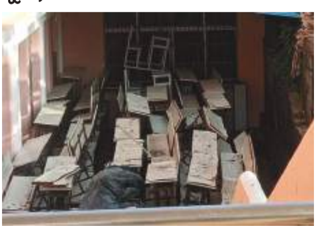
ହିଁ ଚୈକି ଟେବୁଲ ପ୍ରଥମ ଥର ପାଇଁ ଆରମ୍ଭ ହୋଇଥିଲା । ଏହି ମହାବିଦ୍ୟାଳୟରେ ଶ୍ରେଣୀ ଗୁହ ଗୁଡ଼ିକରେ ଛାତ୍ର ଛାତ୍ରୀମାନେ ବସି କି ପାଠ ପଢ଼ୁଥିବା ଚୈକି ଟେବୁଲ ଗୁଡ଼ିକୁ ଶ୍ରେଣୀ ଗୁହରୁ ବାହାର କରି ଖୋଲା ଆକାଶ ତଳେ ଫୋପାଡ଼ି ଦେଇଛନ୍ତି, ଯାହା ଫଳରେ ବର୍ତ୍ତମାନ ଚୈକି ଟେବୁଲ ଗୁଡ଼ିକ ଖରା ବର୍ଷାରେ ପଡ଼ି ଖଟ ଖାଉଡ଼ି ଦେଖାଯାଉଛି । ଆଉ କେଜଣା ଦିନରେ ପିଲାଙ୍କ ମହାବିଦ୍ୟାଳୟ ଖୋଲିବ ପାଠ ପଢ଼ା ଆରମ୍ଭ ହେବା ବେଳକୁ ଏହି ଚୈକି

ଭୁବନେଶ୍ୱର, (ପି.ଏନ): ଗଜପତି ଜିଲ୍ଲା ସଦରମହକୁମା ପାରଳାଖେମୁଣ୍ଡିର ଶ୍ରୀକୃଷ୍ଣଚନ୍ଦ୍ର ଗଜପତି ସ୍ୱୟଂ ଶାସିତ ମହାବିଦ୍ୟାଳୟ ପରିସରରେ ମହାବିଦ୍ୟାଳୟର ଶ୍ରେଣୀବିଭାଗ ମଧ୍ୟରେ ଥିବା ଚୈକି ଟେବୁଲ, ଛାତ୍ର ଛାତ୍ରୀ ମାନେ ବସି ପାଠ ପଢ଼ିବାର, ଆସବାବପତ୍ର ଗୁଡ଼ିକ ବାହାରେ ଖରା ବର୍ଷା କାଳରେ ପଡ଼ି ଖଟ ଖାଉଡ଼ି ଦେଖିବାକୁ ମିଳିଛି । ସୁଦୂରଯୋଗ୍ୟରେ ଆଉ ୫ ଦିନ ପରେ କଲେଜ ଖୋଲିବାକୁ ଯାଉଛି । ହେଲେ ଟେବୁଲ ଚୈକି ଆଦି ବାହାରେ ପଡ଼ି ରହିଥିବା ଯୋଗୁଁ କଲେଜରେ ଛାତ୍ରଛାତ୍ରୀ କି ପଢ଼ି ପାଠ ପଢ଼ିବେ ବୋଲି ସାଧାରଣରେ ପ୍ରଶ୍ନବାଚୀ ସୃଷ୍ଟି ହୋଇଛି । ପ୍ରକାଶପାଠକି ଚୈକି ଟେବୁଲର ନିର୍ବାହନରେ ଗଜପତି ଜିଲ୍ଲାର ମୋହନା ନିର୍ବାହନ ମଣ୍ଡଳୀର ଏବଂ ପାରଳାଖେମୁଣ୍ଡି ନିର୍ବାହନ ମଣ୍ଡଳୀର ଜିଲ୍ଲା ପ୍ରଶାସନ ନିର୍ବାହନର ସମସ୍ତ କାର୍ଯ୍ୟକୁ ପାରଳାଖେମୁଣ୍ଡିର ଶ୍ରୀକୃଷ୍ଣଚନ୍ଦ୍ର ଗଜପତି ସ୍ୱୟଂ ଶାସିତ ମହାବିଦ୍ୟାଳୟ