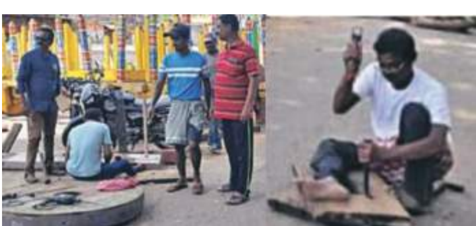
ଭାବେ ଉପସ୍ଥିତ ରହି କାର୍ଯ୍ୟର ତଦାରଖ କରୁଛନ୍ତି । ବର୍ତ୍ତମାନ ତିନି ରଥର ଚୈକି ନିର୍ମାଣ କାର୍ଯ୍ୟ ଚାଲିଥିବା ଜଣାପଡ଼ିଛି ।

ଭୁବନେଶ୍ୱର, (ପି.ଏନ): ଦକ୍ଷିଣ ଓଡ଼ିଶାର ଶ୍ରୀକ୍ଷେତ୍ର ଭାବେ ପରିଚିତ ପାରଳାଖେମୁଣ୍ଡି ସହରରେ ରଥଯାତ୍ରା ପାଳନ ପାଇଁ ତିନି ରଥ ନିର୍ମାଣ କାର୍ଯ୍ୟ ଆଗେଇ ଚାଲିଛି । ଆଗାମୀ ଜୁଲାଇ ୭ ତାରିଖ ଦିନ ହେବାକୁ ଥିବା ରଥଯାତ୍ରା ଲାଗି ୩ ରଥ ନିର୍ମାଣ ହେଉଛି । ଏଥିପାଇଁ ରଥ ନିର୍ମାଣ କାର୍ଯ୍ୟକୁ ତ୍ୱରାନ୍ୱିତ କରିଛନ୍ତି । ରଥ ନିର୍ମାଣ କମିଟି ସଦସ୍ୟମାନେ ପ୍ରତ୍ୟକ୍ଷ