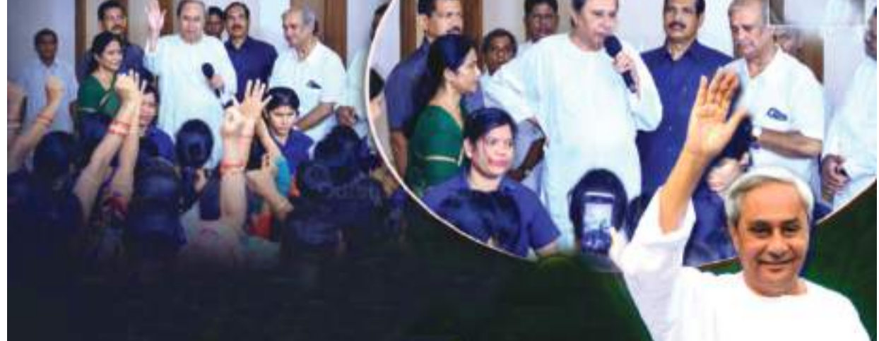
ଦେଖନ୍ତୁ । କେମିତି ନବୀନ ମାଲକ ଧରି କର୍ମୀ ମାନଙ୍କୁ କହୁଛନ୍ତି । କହୁଛନ୍ତିକି ମୁଁ ବଞ୍ଚିଛି ଏପର୍ଯ୍ୟନ୍ତ ମରି ନାହିଁ । ଆମେ ହାରିଲେ କିନ୍ତୁ ଦଳ ଭାଙ୍ଗି ନାହିଁ । ଲୋକଙ୍କୁ ସେବା କରିବା ଆମ ଧର୍ମ । ଆଉ ଆମେ ଯେମିତି ସେବା କରୁଥିଲେ ସେମିତି ଲୋକଙ୍କର ସେବା କରି ଚାଲିବା । କାରଣ ଓଡ଼ିଶାବାସୀଙ୍କ ସେବା ହେଉଛି ଆମର ସକଳ । ଆଉ ସଂକଳକୁ ସାକାର କରିବା ଦିଗରେ ଆମେ ସମସ୍ତେ ଆଗକୁ ବଢ଼ିବା । ଯେତେବେଳେ ରାଜ୍ୟରୁ ନୂଆ ମୁଖ୍ୟମନ୍ତ୍ରୀ ଶପଥ ନେବାକୁ ଯାଉଛନ୍ତି ତିକେ ସେମିତି ବେଳେ ମୁଖ୍ୟମନ୍ତ୍ରୀ ତାଙ୍କ ବାସଭବନରେ କର୍ମୀ ମାନଙ୍କୁ ଏମିତି ମନ୍ତ୍ରଣା ଦେଉଥିବାର ଦେଖିବାକୁ ମିଳିଛି । ସେପରେ ଏହି ଦେଖିବା ଏପର୍ଯ୍ୟନ୍ତ ନବୀନଙ୍କ ଉତ୍ତରାଧିକାରୀ କିଏ ହେବ ତାହା ଜଣା ପଡି ନାହିଁ । ଅନ୍ତରାଳ ବାରମ୍ବାର ବୁଝାଉଛନ୍ତି ନବୀନ । ହେଲେ ସେ ବୁଝିବାକୁ ନାହାନ୍ତି । ଏମିତି ସମସ୍ତଙ୍କର ନବୀନ କର୍ମୀ ମାନଙ୍କୁ ତଳି ଉତ୍ସାହିତ କରୁଛନ୍ତି । ଯାହା ସବୁ ଠାରୁ ଆଶ୍ଚର୍ଯ୍ୟକ କଥା । ଆଗାମି ଦିନରେ ବିଜେଡିର ଭବିଷ୍ୟତ କଣ ହେବ ତାହା ସମୟ କହିବ ।

ଭୁବନେଶ୍ୱର, ୧୨।୬(ପି.ଏନ.): ୨୪ ବର୍ଷର ସରକାର ଭାଙ୍ଗି ଯାଇଛି । ବିଜେଡି କର୍ମୀ ମାନେ ବି ଭାଙ୍ଗି ପଡ଼ିଛନ୍ତି । ସମସ୍ତେ ଏବେ ଝଟକା ଖାଇଛନ୍ତି । ହଠାତ୍ ସରକାର ବଦଳି ଯିବ କେହି କେବେ ଭାବି ନଥିଲେ । କର୍ମୀ ମାନଙ୍କର ଭାବନାରୁ ପୁରା ବିପରୀତ ଘଟଣା ସବୁ ଘଟି ଯାଇଛି । ଯାହାକୁ ନେଇ ଏବେ ଦୁଃଖରେ ଭାଙ୍ଗି ପଡ଼ିଛନ୍ତି ବିଜେଡିର କର୍ମୀ ମାନେ । ହେଲେ ଜଣିବ କେବଳ ଭାଙ୍ଗି ନାହିଁ ଆଉ ସେ ହେଉଛନ୍ତି ଦଳର ମୁଖ୍ୟ । ନବୀନ ପଢ଼ନାୟକ । ବିଜେଡିର କର୍ମୀ ମାନଙ୍କୁ ପାଖକୁ ଡାକି ସେମାନଙ୍କ ମନରେ ଉତ୍ସାହ ଭରିଛନ୍ତି । ସରକାର ଭାଙ୍ଗିଗଲା ପରେ ନବୀନ କର୍ମୀ ମାନଙ୍କୁ ଉତ୍ସାହିତ କରିବାରେ ଲାଗି ପଡ଼ିଛନ୍ତି । ଯେମିତି ଦଳ ନଭାଙ୍ଗି ଆଗକୁ ଶକ୍ତ ହେବ ସେ ଦିଗରେ ଆରମ୍ଭ କରିଛନ୍ତି ପ୍ରକ୍ରିୟା । ନିଜେ ମାଲକ ଧରି କର୍ମୀ ମାନଙ୍କୁ ଏମିତି କହିଛନ୍ତି । ତିକେ ଏହି ସବୁ ଫଟୋକୁ