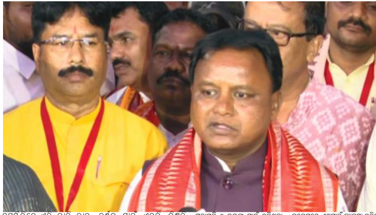
ଉପସ୍ଥିତରେ ଏହି ଦ୍ୱାର ଦ୍ୱାର ଖୋଲାଯିବ । ଲକ୍ଷ୍ମଣ ଓ ଭଗବାନଙ୍କ ମଧ୍ୟରେ କୌଣସି ପ୍ରତିବନ୍ଧକ ରହିବ ନାହିଁ ଓ ସମସ୍ତଙ୍କ ପାଇଁ ସୁବ୍ୟବସ୍ଥିତ ଦର୍ଶନ ପାଇଁ ଏଭଳି ନିଷ୍ପତ୍ତି ନିଆଯାଇଛି । ସେହିପରି ଦ୍ୱିତୀୟ ପ୍ରସ୍ତାବରେ ଶ୍ରୀମନ୍ଦିରର ସୁପରିତ୍ୱାଳନା, ସୌନ୍ଦର୍ଯ୍ୟକରଣ, ମରାମତି ଓ ଉତ୍କଳ ପାଇଁ ରହିଥିବା ସମସ୍ୟାର ସମାଧାନ ପାଇଁ ଏକ କର୍ତ୍ତବ୍ୟ ପାଣ୍ଠି ଗଠନ କରାଯିବ । ସେଥିରେ ୫୦୦କୋଟି ଟଙ୍କା ରହିବ ଓ

ଭୁବନେଶ୍ୱର, ୧୨।୬(ପି.ଏନ.): ରାଜ୍ୟର ବିଜେପି ସରକାର ଆଜି ଶପଥ ନେବା ସହ ନିଜର ପ୍ରଥମ କ୍ୟାବିନେଟ୍ ଓ ମନ୍ତ୍ରମଣ୍ଡଳ ଗଠନ କରିଛନ୍ତି । ସ୍ୱରାଜ୍ୟ ପୂର୍ଣ୍ଣ ନିଷ୍ପତ୍ତି ନେଇଛନ୍ତି । ମହାପ୍ରଭୁ ଶ୍ରୀଜଗନ୍ନାଥଙ୍କ ଦ୍ୱାରଦ୍ୱାର ଖୋଲିବା ଓ ଶ୍ରୀମନ୍ଦିର ପରିତ୍ୱାଳନା ପାଇଁ ୫୦୦କୋଟି ଟଙ୍କାର କର୍ତ୍ତବ୍ୟ ପାଣ୍ଠି, ମହିଳାଙ୍କ ପାଇଁ ସୁରକ୍ଷା ଯୋଜନା ଓ ଚାଷୀଙ୍କ ପାଇଁ ସମୃଦ୍ଧ କୃଷକ ନୀତି ଆସନ୍ତା ୧୦୦ଦିନ ମଧ୍ୟରେ କାର୍ଯ୍ୟକାରୀ କରିବାକୁ ରାଜ୍ୟର ବିଜେପି ସରକାର ନିଷ୍ପତ୍ତି ନେଇଛନ୍ତି । ଲୋକସେବା ଭବନରେ ମୁଖ୍ୟମନ୍ତ୍ରୀ ମୋହନ ଚରଣ ମାଝୀଙ୍କ ଅଧ୍ୟକ୍ଷତାରେ ଅନୁଷ୍ଠିତ କ୍ୟାବିନେଟ୍ ଓ ମନ୍ତ୍ରମଣ୍ଡଳ ଗଠନ କେଉଁଠି ଚର୍ଚ୍ଚା ପ୍ରସଙ୍ଗ ସମ୍ପର୍କରେ ସୁଚନା ଦେଇ ମୁଖ୍ୟମନ୍ତ୍ରୀ ଶ୍ରୀ ମାଝୀ କହିଛନ୍ତି ଯେ, ପୁରୀ ମହାପ୍ରଭୁ ଶ୍ରୀଜଗନ୍ନାଥ ମନ୍ଦିରର ୪ ଦ୍ୱାର ଖୋଲିବାକୁ ନିଷ୍ପତ୍ତି ନିଆଯାଇଛି । ଆସନ୍ତାକାଲି ପୁରୀରେ ଶ୍ରୀମନ୍ଦିରରେ ମହାପ୍ରଭୁଙ୍କ ମଙ୍ଗଳ ଆକୃତି ସମୟରେ ରାଜ୍ୟ କ୍ୟାବିନେଟ୍‌ର ସଦସ୍ୟମାନଙ୍କ