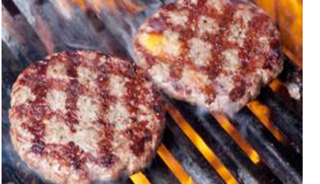
ପାଣି ଶରୀରର ହାନୀକାରକ ତତ୍ତ୍ୱକୁ ବାହାରକୁ ବାହାର କରି ଶାରୀରିକ ପ୍ରଶାଳୀରେ ନୂତନ ଶକ୍ତି ସୃଷ୍ଟି କରିଥାଏ । ସର୍ବତ, ଫଳସ, ନଡ଼ିଆ ପାଣି ଭଳି ପାଣି ଜିନିଷ ପିଇବା ଉଚିତ୍ । ଶାରୀରିକ ସତେଜ ରହିବା ପାଇଁ ପ୍ରୋଟିନ୍ ଯୁକ୍ତ ଖାଦ୍ୟ ନିଜ ଖାଦ୍ୟରେ ଗ୍ରହଣ କରିବା

ଅଧିକାଂଶ ସମୟ ଲୋକଙ୍କର ଅଭିଯୋଗ ରହିଆସିଛି ଯେ, ସେମାନେ ଅଳ୍ପ କାମ ରେ ଜଳଦି ଅଳ୍ପପତ୍ତି । କିଛି ବ୍ୟକ୍ତି ଏଭଳି ବି ଅଛନ୍ତି ଯିଏ କିଛି କାମ ନ କରି ମଧ୍ୟ ଅକ୍ଳାପଣ ଅନୁଭବ କରନ୍ଥାନ୍ତି । ଶରୀରରେ ଶକ୍ତିର କମି ଫଳରେ ଜଣେ ବ୍ୟକ୍ତି ଅକ୍ଳାପଣ ଅନୁଭବ କରିଥାଏ । ତେଣୁ ଶରୀରକୁ ଶକ୍ତିଶାଳୀ ବନାଇବାପାଇଁ ଆପଣ ଆପଣଙ୍କ ଖାଦ୍ୟରେ ଦିନରୂପୀରେ ପ୍ରୋଟିନ୍ ଯୁକ୍ତ ଖାଦ୍ୟ ସାମିଲ କରନ୍ତୁ । ପୁରା ଦିନ ପାଣି କିମ୍ବା କିଛି ତରଳ ପଦାର୍ଥ ପିଇବା ଉଚିତ୍ ।