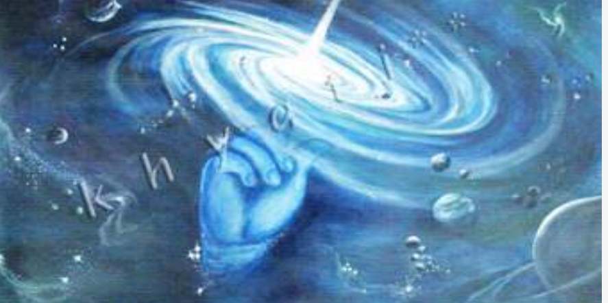
କାବନରେ କୌଣସି ଜିନିଷ ହଜିଯିବା, ହଜିଯାଇଥିବା ଜିନିଷ ଖୋଜିଲେ ନ ମିଳିବା ଆଦି ସମସ୍ୟା ମନକୁ ଭାରାଭାର କରିଦିଏ । ଏଭଳି

ପରିସ୍ଥିତିରେ କାର୍ତ୍ତିକେୟଙ୍କୁ ରାଜା ଯିଏ ହେଉ ବ୍ୟତୀତ ତଥା ଉତ୍ତରୀନ ବିଷ୍ଣୁଙ୍କ ସୁଦର୍ଶନ ଚକ୍ରର ଅବତାର ବୋଲି କୁହାଯାଇଥାଏ । ତାଙ୍କର ସାଧନା କରିବା ଦ୍ୱାରା ଏହି ସବୁ ସମସ୍ୟାରୁ ତୁରନ୍ତ ମୁକ୍ତି ମିଳିଥାଏ । ପୁରାଣରେ ବର୍ଣ୍ଣିତ ହୋଇଛି ଯେ ସୁଦର୍ଶନ ଚକ୍ର ଯେ କୌଣସି ଦିନକୁ ଯାଇ ହଜିଥିବା ଜିନିଷ ଖୋଜି ଆଣିବାର ସାହାଯ୍ୟ କରିଥାଏ । ଏହାର ସାଧନା ପାଇଁ ଦୀପାଳୀଙ୍କୁ ପୂର୍ଣ୍ଣ ଅଧିକାର ଉତ୍ତର ଦିନ ପଠାଇ ମୁହଁ କରି ବସନ୍ତ । ହଜିଯାଇଥିବା ଜିନିଷକୁ ଭାବନାରେ ଆଣି ଉତ୍ତରୀନ ବିଷ୍ଣୁଙ୍କର ସୁଦର୍ଶନ ଚକ୍ରକୁ ସୁରକ୍ଷା କରି ଧ୍ୟାନ କରନ୍ତୁ ।