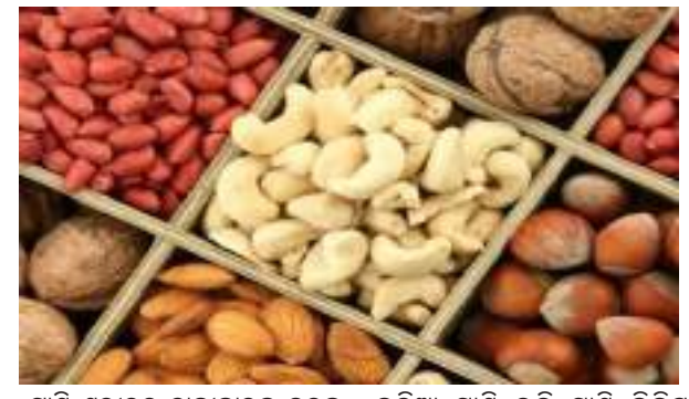
ଅଧିକାଂଶ ସମୟ ଲୋକଙ୍କର ଅଭିଯୋଗ ରହିଆସିଛି ଯେ, ସେମାନେ ଅଳ୍ପ କାମ ରେ ଜଳଦି ଅଳ୍ପପତ୍ତି । କିଛି ବ୍ୟକ୍ତି ଏଭଳି ବି ଅଛନ୍ତି ଯିଏ କିଛି କାମ ନ କରି ମଧ୍ୟ ଅକ୍ଳାପଣ ଅନୁଭବ କରନ୍ଥାନ୍ତି । ଶରୀରରେ ଶକ୍ତିର କମି ଫଳରେ ଜଣେ ବ୍ୟକ୍ତି ଅକ୍ଳାପଣ ଅନୁଭବ କରିଥାଏ । ତେଣୁ ଶରୀରକୁ ଶକ୍ତିଶାଳୀ ବନାଇବାପାଇଁ ଆପଣ ଆପଣଙ୍କ ଖାଦ୍ୟରେ ଦିନରୂପୀରେ ପ୍ରୋଟିନ୍ ଯୁକ୍ତ ଖାଦ୍ୟ ସାମିଲ କରନ୍ତୁ । ପୁରା ଦିନ ପାଣି କିମ୍ବା କିଛି ତରଳ ପଦାର୍ଥ ପିଇବା ଉଚିତ୍ ।

ଅଧିକାଂଶ ସମୟ ଲୋକଙ୍କର ଅଭିଯୋଗ ରହିଆସିଛି ଯେ, ସେମାନେ ଅଳ୍ପ କାମ ରେ ଜଳଦି ଅଳ୍ପପତ୍ତି । କିଛି ବ୍ୟକ୍ତି ଏଭଳି ବି ଅଛନ୍ତି ଯିଏ କିଛି କାମ ନ କରି ମଧ୍ୟ ଅକ୍ଳାପଣ ଅନୁଭବ କରନ୍ଥାନ୍ତି । ଶରୀରରେ ଶକ୍ତିର କମି ଫଳରେ ଜଣେ ବ୍ୟକ୍ତି ଅକ୍ଳାପଣ ଅନୁଭବ କରିଥାଏ । ତେଣୁ ଶରୀରକୁ ଶକ୍ତିଶାଳୀ ବନାଇବାପାଇଁ ଆପଣ ଆପଣଙ୍କ ଖାଦ୍ୟରେ ଦିନରୂପୀରେ ପ୍ରୋଟିନ୍ ଯୁକ୍ତ ଖାଦ୍ୟ ନିଜ ଖାଦ୍ୟରେ ଗ୍ରହଣ କରିବା