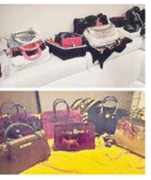
ଭୁଲରେ ମାଲେସିଆର ଜଣେ ୨୧ ବର୍ଷର ଛାତ୍ରୀ ଜିନିଷକୁ ଖାତାକୁ ଆସିଥିଲା ୩୧କୋଟି ଟଙ୍କା । ୨୦୧୪ ଜୁଲାଇ ମାସରେ ଏ ସମ୍ପର୍କରେ ଜିନିଷ ଜଣିପାରିଥିଲେ । ପରେ ଏହି ଟଙ୍କା ଗୋଟେ ମୋ ବ୍ୟାପୀ ଠାଉଛନ୍ତି । ପରେ ଘଟଣାଟି କୋର୍ଟରେ ପହଞ୍ଚିଥିଲା । ଗତ ମଙ୍ଗଳବାର ଦିନ ତାହାଙ୍କୁ ସେହିଭଳି କୋର୍ଟରେ ଜିନିଷ ଉପସ୍ଥାପନ ହୋଇ ନିକ ସୁକ୍ତି ରଖିଥିଲେ । ପରେ ଏହି ମାମଲାର କୋର୍ଟ ତାଙ୍କୁ ସମ୍ମାନ ସହ ମୁକ୍ତି କରିଛି ।