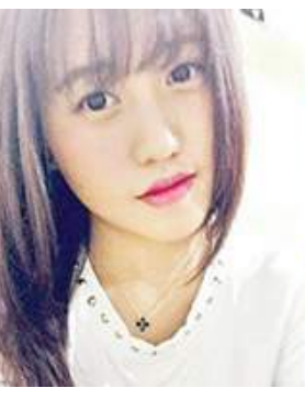
ଅଧିକାରୀମାନେ ଜଣକ ସ୍ଥାନରେ ଅନ୍ୟଜଣଙ୍କ ଆକାଉଣ୍ଟରେ ଟଙ୍କା ଜମା କରିଦେଇଛନ୍ତି । ବ୍ୟାଙ୍କର ଏହି ଭୁଲ ଯୋଗୁଁ ଜଣେ ଛାତ୍ରୀଙ୍କ କୋର୍ଟର ଚକ୍ର କାଟିବାକୁ ପଡ଼ିଛି । ମାମଲାର ୨୦୧୨ ମସିହାର ବ୍ୟାଙ୍କ ପକ୍ଷରୁ

ସିଡ଼ନୀ ଭାରତରେ ନୋଟରବ ନିଷ୍ପତ୍ତି କାରଣରୁ ଅନେକ କଳାଧନକୁ ଧଳା କରିବା ପାଇଁ ଅନ୍ୟମାନଙ୍କ ଆକାଉଣ୍ଟରେ ଅର୍ଥ ଜମା କରୁଥିବା ଘଟଣା ଏବେ ଦେଖିବାକୁ ମିଳୁଛି । ସେହିପରି ଭୁଲରେ ମଧ୍ୟ ବ୍ୟାଙ୍କ