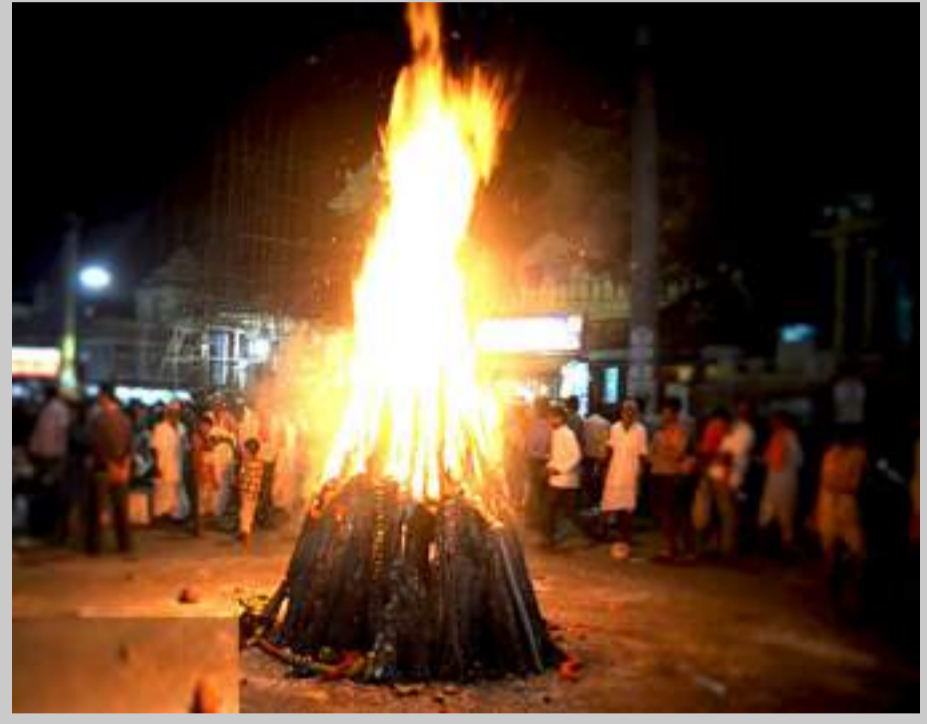
ଶୀତ ଋତୁର ଶେଷ ମାସ ମାସର ସାଧାରଣତଃ ଅଗ୍ନି ଦେବତାଙ୍କ ପୂଜା ପୂର୍ଣ୍ଣମାକୁ ଅଗିରା ପୂର୍ଣ୍ଣମା କହିଥାନ୍ତି । ଶ୍ରୀପଞ୍ଚମୀ ଦିନ ଠାରୁ ଆରମ୍ଭ ହୋଇଥାଏ । କାରଣ ସରସ୍ୱତୀଙ୍କୁ ଦେବତା ଅଗ୍ନି ବୋଲି କୁହାଯାଇଛି ।

ଗାଁ ଠାରୁ ସହର ପର୍ଯ୍ୟନ୍ତ ସବୁଠି ଅଗିରା ଏକ ପରିଚିତ ଦୃଶ୍ୟ । ପ୍ରକୃତରେ ଅଗ୍ନି ଦେବତାଙ୍କ ପୂଜା ବୈଦିକ ଯୁଗରୁ ରହିଆସିଛି । ବୈଦିକ ଭାଷାରେ - 'ଅଗ୍ନି ମିଳେ ପୁରୋହିତ' ଶ୍ରେଣୀ ବେଦରେ ଅଗ୍ନି ହେଉଛି ପ୍ରଥମ ଦେବତା । ଓଡ଼ିଆ ଜନଜୀବନରେ ଚିର ପରିଚିତ ଅଗିରା ପୂର୍ଣ୍ଣମା ଏକ ପରିଚିତ ଦିନଟି । କେବଳ ଗାଁରେ ନୁହେଁ ସହରରେ ମଧ୍ୟ ଛକ ସ୍ଥାନ ମାନଙ୍କରେ ଧାନ ନଡ଼ା ଏକତ୍ର କରାଯାଇ ଏହାକୁ ପୂଜାର୍ଚ୍ଚନା କରି ଅଗ୍ନି ସଂଯୋଗ କରାଯାଇଥାଏ । ଏଥିରେ ବାଜରା ଓ ଅନ୍ୟାନ୍ୟ ପରିବା ପୋଡ଼ି ଖାଇଲେ କିଛି ଚର୍ମରୋଗ ହୋଇନଥାଏ ବୋଲି ଲୋକବିଶ୍ୱାସ ରହିଛି । ଏହିଦିନରୁ ବାସନ୍ତ ମାସ ମାସର ଶୀତ ବିଦାୟ ନେଇ ବସନ୍ତ ଋତୁର ମୁଦ୍ରା ସମାପନ ଭିତରେ ଗ୍ରୀଷ୍ମଋତୁକୁ ସ୍ୱାଗତ କରାଯାଇଥାଏ ।