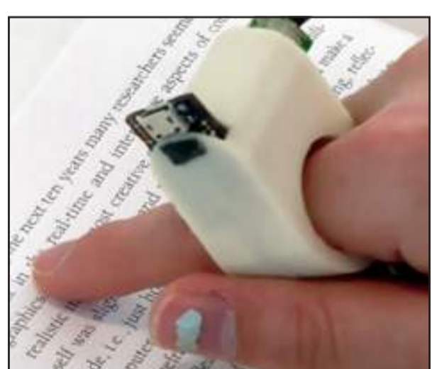
ଶିଖାଯାଇପାରେ । ଦୃଷ୍ଟିହୀନଙ୍କ ପାଇଁ ହେପ୍ଟିକ ଟେକନିକରେ ତିଆରି ଏହି ସ୍ପାଟ୍ ଓଡ଼ିଆ ସ୍ପଷ୍ଟ ମୂଲ୍ୟରେ ମିଳୁଥିବାରୁ ଏହା ଅଧିକ ଆଦୃତ କରୁ ପସ ଆଶା ରଖିଛନ୍ତି । ସେମାନଙ୍କ ମତରେ ଦୃଷ୍ଟିହୀନଙ୍କୁ ଏହି ସୁବିଧା ଯୋଗାଇ ଦେବା ଲାଗି ପୂର୍ବରୁ ଏହି ଉପକରଣ ତିଆରି ହୋଇଥିଲେ ମଧ୍ୟ ତାହାର ଆକାରୁଆଁ ମୂଲ୍ୟ ଯୋଗୁ ବ୍ୟବହାର କରିବା ସମ୍ଭବ ପକ୍ଷେ ସମ୍ଭବ ହୋଇପାରୁ ନଥିଲା । କିନ୍ତୁ ଏହି ସ୍ପାଟ୍ ଓଡ଼ିଆ ସମସ୍ତ ଦୃଷ୍ଟିହୀନଙ୍କୁ ସୁହାଇବା ବୋଲି ସେମାନେ ସୂଚିତ କରିଛନ୍ତି । ଏହି ସ୍ପାଟ୍ ଓଡ଼ିଆ ଯେ କୌଣସି କ୍ୟୁ ଟ୍ୟୁ ସହିତ ସଂଯୋଗ କରାଯାଇ କରୁରୀ ସୂଚନା ପଢ଼ାଯାଇପାରେ । ଏହି ସ୍ପାଟ୍ ଓଡ଼ିଆରେ ପ୍ରଥମେ ମେସେଜ୍, ମୋବାଇଲ୍ ଫୋନ୍‌କୁ ଆସେ । ପରେ ଏହା ସିଂହିତ କଣ୍ଠ ଛାତ ଆପ୍ଲିକେସନ୍, ଉଚ୍ଚ ମେସେଜ୍ ହେଲ୍, ଭାଷାରେ ଅନୁବାଦ କରିଥାଏ । ମେସେଜ୍ ପ୍ରାପ୍ତ ହେବା ପରେ ତତ୍ତର ଭାଇଲେଟର ଯୁକ୍ତରୁ ସତର୍କ କରିଦେଇଥାଏ ।

ଦୃଷ୍ଟିହୀନ ଯୁବପିଢ଼ିକ ପାଇଁ ଖୁସି ଖବର । ଏବେ ସେମାନେ ବି ଇ-ରିଡିଂ କରିପାରିବେ । ସାଧାରଣ ଯୁବପିଢ଼ିକ ପରି ଇଣ୍ଟରନେଟରେ ନିଜ ପସନ୍ଦର ବହି, ମାଗାଜିନ୍ ପଢ଼ିବା ସହ ମେସେଜ୍ ଦିଆନିଆ କରିପାରନ୍ତେ । ତାହା ପୁଣି ଖୁବ୍ କମ୍ ଖର୍ଚ୍ଚରେ । ନିକଟରେ ଏକ ନୂଆ ଟେକ୍ନୋଲୋଜି ଉଦ୍ଭାବନ କରି ଚର୍ଚ୍ଚାରେ ପରିସରକୁ ଆସିଛି ଦକ୍ଷିଣ କୋରିଆର ଏକ ନୂଆ କମ୍ପାନୀ । ଦୃଷ୍ଟିହୀନମାନଙ୍କୁ ଇ-ରିଡିଂ ସୁବିଧା ଯୋଗାଇ ଦେବା ଲାଗି ଉଚ୍ଚ କମ୍ପାନୀ ତିଆରି କରିଛି ଏକ ହେଲ୍ ସ୍ପାଟ୍ ଅପ୍ଲାଇ । କେବେକ ଏତିକି ନୁହେଁ, ହୃଦ୍, ନାମକ ଏହି ସ୍ପାଟ୍ ଓଡ଼ିଆ ସାହାଯ୍ୟରେ ହେଲ୍ ଭାଷା ମଧ୍ୟ ହୋଇପାରିବ ବୋଲି କମ୍ପାନୀ