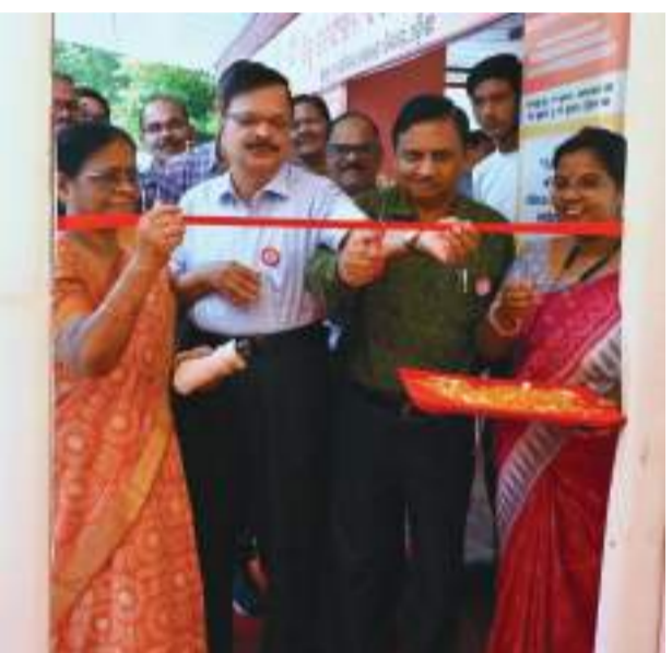
ଡ.ଏସ୍.ଏ. ଆର ୨ଟି ନୂତନ ଭାରତର ପରିଚୟ ନୂତନ, ପରିବାର ନିୟୋଜନ ପ୍ରତି ଦମ୍ପତୀ ସମ୍ମାନ । ରାଜ୍ୟରେ ୨୬ ଜୁନ ରୁ ୨୪ ଜୁଲାଇ ୨୦୨୪ ପର୍ଯ୍ୟନ୍ତ ବିଶ୍ୱ ଜନସଂଖ୍ୟା ଦିବସ ଅଭିଯାନ ପାଳିତ ହେଉଛି । ଜୁନ ୨୬ ତାରିଖରୁ ୧୦ ଜୁଲାଇ ପର୍ଯ୍ୟନ୍ତ ଜନସଂଖ୍ୟା ସଚେତନତା ପକ୍ଷ (ମୋବିଲାଇଜେସନ ଫୋର୍ଡନାଲଟ) ଏବଂ ଜୁଲାଇ ୧୧ ରୁ ୨୪ ତାରିଖ