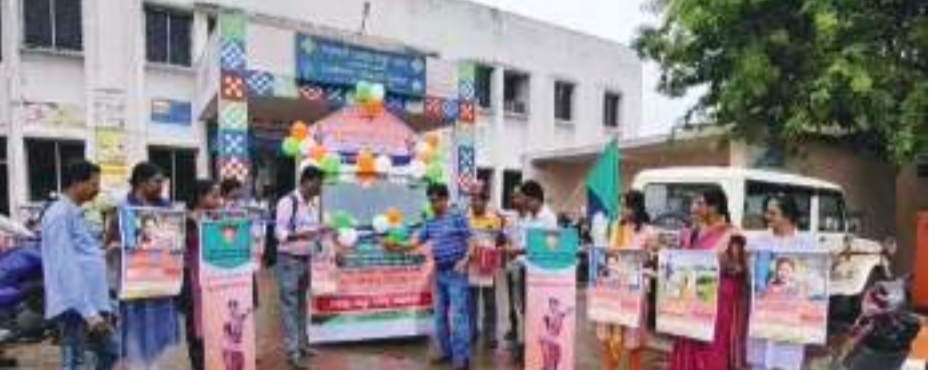
ପତ୍ରିକା ବଣ୍ଟନ ଗାଁ ଗାଁ ବୁଲି, ସ୍ୱାସ୍ଥ୍ୟ କାନ୍ଦୁରେ ବାଟାଁ ଛୋଟ ପରିବାର ସଚେତନତା ବାର୍ତ୍ତା ବାଣ୍ଟିଥିଲେ । ଏଇ ସେବା ବାଲକାଟି ଗୋଷ୍ଠୀ ସ୍ୱାସ୍ଥ୍ୟ କେନ୍ଦ୍ରରେ ଉପଲବ୍ଧ ଅଛି, ଯାହା ଜନସାଧାରଣଙ୍କୁ ଜଣାଇବା ପାଇଁ ବଡ଼ ପୋଷ୍ଟର ବାଲକାଟୀ ଗୋଷ୍ଠୀ ସେବାକେନ୍ଦ୍ରରେ ଗର୍ଭନିରୋଧ ପାଇଁ ସୂଚନା ଲେଖା ଯିବା ସହିତ ଚିକିତ୍ସାଲବ୍ଧ ଭିତରେ ଏକ ଜନସଚେତନତା କକ୍ଷ ଖୋଲା ଯାଇ ଗର୍ଭନିରୋଧର ବିଭିନ୍ନ ଉପକରଣମାନ ଜନସାଧାରଣଙ୍କ ସଚେତନତା ଲାଗି ରଖାଯାଇଛି । ଗର୍ଭ