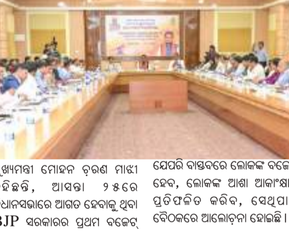
ମୁଖ୍ୟମନ୍ତ୍ରୀ ମୋହନ ଚରଣ ମାଝୀ କହିଛନ୍ତି, ଆସନ୍ତା ୨୫ରେ ବିଧାନସଭାରେ ଆଗତ ହେବାକୁ ଥିବା BJP ସରକାରର ପ୍ରଥମ ବଜେଟ୍

ଭୁବନେଶ୍ୱର, ୧୨।୭।୨୪ (ପି.ଏନ.): ବିଜେପି ସରକାରର ପ୍ରଥମ ବଜେଟ୍ ପାଇଁ ଲୋକସେବା ଭବନରେ ଆଜି ଦସିଥିଲା ପ୍ରାକ୍ ବଜେଟ୍ ପରାମର୍ଶ ବୈଠକ । ଯେଉଁଥିରେ ଯୋଗ ଦେଇଥିଲେ ପୂର୍ବତନ ଅର୍ଥମନ୍ତ୍ରୀ, ଅର୍ଥ ସଚିବ ଓ ଅର୍ଥନୀତି ବିଶାରଦଙ୍କ ସମେତ ମୋଟ ୧୫୦ରୁ ଅଧିକ ଅଂଶଦାରୀ ଯୋଗଦେଇ ନିର୍ବାଚନୀ ପ୍ରତିଶ୍ରୁତି । ଏଥିପାଇଁ ନୂଆ ଯୋଜନା ଆଣିଲେ, ସରକାରଙ୍କୁ କେତେ ବୋଧ୍ ସହିବାକୁ ପଡିବ ଏଥିପାଇଁ କେଉଁଠୁ ଅର୍ଥ ଆସିବ ସେନେଇ ମଧ୍ୟ ବିଶେଷଜ୍ଞଙ୍କ ମତାନ୍ତର ନିଆଯାଇଛି । ପ୍ରାକ୍ ବଜେଟ୍ ବୈଠକ ପରେ