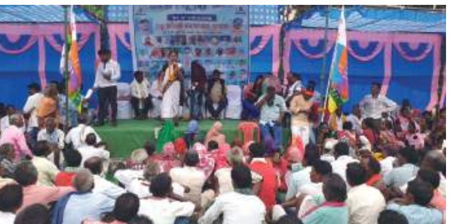
ମଣ୍ଡିରେ ବିକ୍ରି ସକାଶେ ଅନୁମତି ପ୍ରଦାନ, ଜଙ୍ଗଲ ଜମି ପଢ଼ାରେ କୃଷି ରଖି ପ୍ରଦାନ, ମହାତ୍ମା ଗାନ୍ଧୀ ଜାତୀୟ ଗ୍ରାମ୍ୟ ନିର୍ଦ୍ଧିତ କର୍ମନିୟୁତା ଯୋଜନାରେ ଜମି ମରାମତୀ, ଜିଲ୍ଲାର ଅନୁସୂଚିତ ଯୋଜନାରେ ପରିଚାଳିତ ବିଦ୍ୟାଳୟରେ ହେଉଥିବା ବ୍ୟାପକ ଦୁର୍ଦ୍ଦିନୀତ ଅତିତ, ଆଦିବାସୀଙ୍କର ସ୍ୱତନ୍ତ୍ର ବିକାଶ ପାଇଁ ପ୍ରଚ୍ଛନ୍ନ ଯୋଜନାରେ ଖର୍ଚ୍ଚ ନ ହୋଇ ପଡ଼ି ରହିଥିବା ଟଙ୍କା ର ସୁବିନିଯୋଗ କରିବାପାଇଁ ଉଲ୍ଲେଖ କରିଛନ୍ତି ।