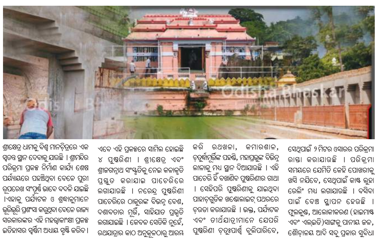
ଶ୍ରୀକ୍ଷେତ୍ର ଆମକୁ ବିଶ୍ୱ ମାନଚିତ୍ରରେ ଏକ ସ୍ୱତନ୍ତ୍ର ସ୍ଥାନ ଦେବାକୁ ଯାଉଛି । ଶ୍ରୀମନ୍ଦିର ପରିକ୍ରମା ପ୍ରକଳ୍ପ ନିର୍ବାହୀ କାର୍ଯ୍ୟ ଶେଷ ପର୍ଯ୍ୟାୟରେ ପହଞ୍ଚିଥିବା ବେଳେ ପୁରୀ ରୂପରେଖ ସଂପୂର୍ଣ୍ଣ ଭାବେ ବଦଳି ଯାଇଛି । ଏହାକୁ ପର୍ଯ୍ୟଟକ ଓ ଶ୍ରଦ୍ଧାଳୁମାନେ ଭୁଲିଛନ୍ତି ପ୍ରକାଶ କରୁଥିବା ବେଳେ ରାଜ୍ୟ ସରକାରଙ୍କର ଏହି ମହତ୍ତ୍ୱାକାଂକ୍ଷୀ ପ୍ରକଳ୍ପ ଚଳିତସମୟ ସ୍ୱର୍ଣ୍ଣ ଅଧ୍ୟାୟ ସୃଷ୍ଟି କରିବ ।

ପୁରୀ, ୮।୧ (ପି.ଏନ): ପୁରୀକୁ ପ୍ରତିଦିନ ହଜାର ହଜାର ଭକ୍ତ, ପର୍ଯ୍ୟଟକ ଓ ତୀର୍ଥଯାତ୍ରୀ ଆସିଥାନ୍ତି । ଶ୍ରୀମନ୍ଦିର ଏବଂ ବେଳାଭୂମି ପରେ ଅନେକ ଶ୍ରୀକ୍ଷେତ୍ରର ବିଭିନ୍ନ ତୀର୍ଥ ପୁଷ୍କରିଣୀକୁ ବୁଲି ଦେଖିଥାନ୍ତି । କେହି କେହି ମାନସିକ ରକ୍ଷା ତୀର୍ଥ ପୁଷ୍କରିଣୀ କୁଳରେ ଚିଲତପଣ, ମୁଣ୍ଡନ ଆଦି କରିଥା'ନ୍ତି । ତୀର୍ଥ ପୁଷ୍କରିଣୀ ସହ ଅନେକ ଭକ୍ତ ଓ ବିଶ୍ୱାସ ଯୋଡ଼ି ହୋଇଛନ୍ତି । ରାଜ୍ୟ ସରକାର ପୁରୀକୁ ବିଶ୍ୱସ୍ତରାୟ ଐତିହ୍ୟ ସହରେ ପରିଣତ କରିବା ଲାଗି ଉଦ୍ୟମ କରି ରଖୁଥିବା ବେଳେ ଏଥିରେ ତୀର୍ଥ ପୁଷ୍କରିଣୀକୁ ସାମିଲ କରିଛନ୍ତି । ପଞ୍ଚତୀର୍ଥ ମଧ୍ୟରୁ ଶୁଭେତରଗା, ମାର୍କଣ୍ଡେୟ, ଉଦ୍ଧୃତମୁନି ସହ ଅନ୍ୟତମ ତୀର୍ଥ ପୁଷ୍କରିଣୀ ନରେନ୍ଦ୍ର ପୌରୀ ନିର୍ବାହୀ ଅଧିକାରୀ ଏବଂ ପୁନରୁଦ୍ଧାର କରାଯାଇଛି । ମୁଖ୍ୟମନ୍ତ୍ରୀ ନବୀନ ପଟ୍ଟନାୟକଙ୍କର ବଳିଷ୍ଠ ଉଦ୍ୟମ ଆଜି ଫଳଦାୟୀ ହେବାରେ ଲାଗିଛି । ସେଦିନର ଚିତ୍ରାଧାରୀ ଆଜି ପୁରୀ