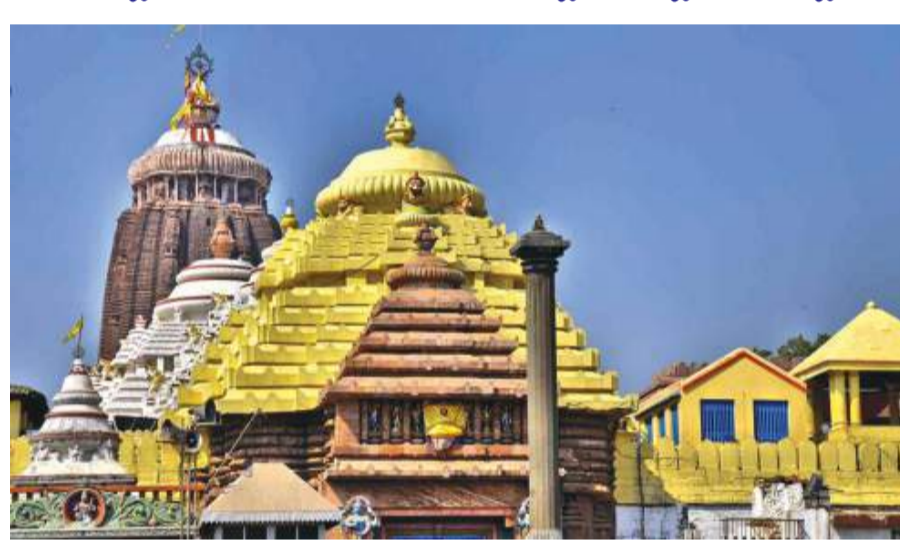
ନିର୍ମାଣକୁ ନେବ। ପରିକ୍ରମା ପ୍ରକଳ୍ପ ୧୨ଟିରୁ ଅଧିକ ଲୋକାର୍ଯ୍ୟ ହେବ। ଏହି ଉପଯୋଗୀ ସମାବେଶରେ ସାଲିସ୍ ହେବାକୁ ରାଜ୍ୟ ତଥା ଦେଶର ବିଭିନ୍ନ ଭାଗରୁ ଆସୁଥିବା ଶ୍ରଦ୍ଧାଳୁ, ପର୍ଯ୍ୟଟକମାନଙ୍କ ନିମନ୍ତେ ସ୍ୱତନ୍ତ୍ର ବ୍ୟବସ୍ଥା କରାଯାଇଛି। ବଡ଼ଦାଣ୍ଡର ଉଭୟ ପାର୍ଶ୍ୱରେ ଥିବା କୋଠାର ଛାତ ଉପରେ ବସିବାର ବ୍ୟବସ୍ଥା ହେବ। ଜିଲ୍ଲା ପ୍ରଶାସନ ମଧ୍ୟ ଏବେଇ ବଡ଼ଦାଣ୍ଡରେ ଥିବା ବିଭିନ୍ନ ମଠ ଓ କୋଠାର ମାଲିକଙ୍କୁ ଚିଠି ଲେଖୁଛନ୍ତି।

ଭୁବନେଶ୍ୱର, ୫।୧(ପି.ଏନ): ପୁରୀରୁ ମହାପ୍ରଭୁ ଶ୍ରୀଜୀଉଙ୍କୁ ନିର୍ବାହୀ ପରିକ୍ରମା ପ୍ରକଳ୍ପ (ଏଡିଏମ୍)ର ନିର୍ମାଣ କାର୍ଯ୍ୟ ତ୍ୱଚ୍ଚାପରେ ୧୧ଟିରୁ ଅଧିକ ଶେଷ ହେବ। ଆଉ ସୁରକ୍ଷା ଦୃଷ୍ଟିରୁ ୧୪ଟିରୁ ଅଧିକ ପୁଲିସ୍ ଫୋର୍ସ ଆବଦ୍ଧି ପୁରୀ ପ୍ରକଳ୍ପ ନିର୍ମାଣକୁ ନେବ। ମୁଖ୍ୟ ସଚିବ ପ୍ରଦୀପ କୁମାର ଜେନା ଆଜି ଏହି ସୂଚନା ଦେଇଛନ୍ତି। ପରିକ୍ରମା ପ୍ରକଳ୍ପ କାର୍ଯ୍ୟର ସମାପ୍ତ କରିବା ପରେ ଗଣମାଧ୍ୟମକୁ ପ୍ରତିକ୍ରିୟା ଦେଇ ଶ୍ରୀ ଜେନା କହିଛନ୍ତି ଯେ, ଚଳିତମାସ ୧୧ଟିରୁ ଅଧିକ ନିର୍ମାଣ କାର୍ଯ୍ୟ ଶେଷ କରିବାକୁ ଓଡ଼ିଶା ଟ୍ରଷ୍ଟ କର୍ମଚାରୀଙ୍କୁ ନିର୍ଦ୍ଦେଶ ଦିଆଯାଇଛି। ଓଡ଼ିଶା ଟ୍ରଷ୍ଟ ପ୍ରକଳ୍ପ କାର୍ଯ୍ୟକୁ ଶ୍ରୀମନ୍ଦିର ପ୍ରଶାସନକୁ ହସ୍ତାନ୍ତର କରିବେ। ଏହାପରେ ଜାନୁଆରୀ ୧୪ରୁ ଏସବୁ ଆବଦ୍ଧିର ସୁରକ୍ଷା ପାଇଁ ପୁରୀ ପୁଲିସ୍ ନିକ