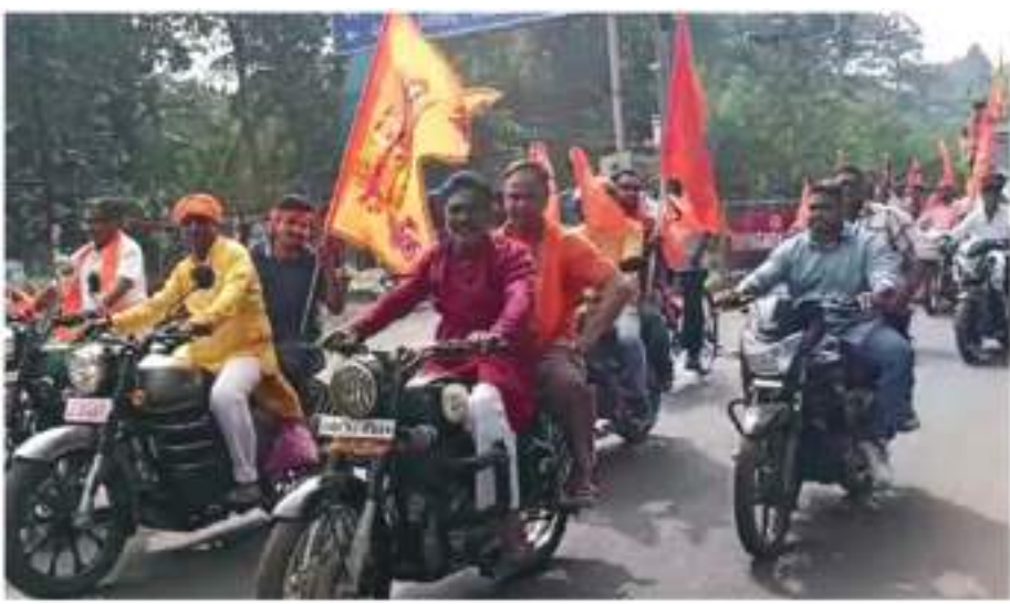
ଯୋଗଦାନ ଦେଇଥିଲେ ! ତାରି ଆଡ଼େ ଜୟ ଶ୍ରୀରାମ ଧ୍ୱନିରେ ସହରପୁରା ରାମ ମଠ ହୋଇଥିଲା ! ତୋଟ ସହ ବିଜୁ ପଟ୍ଟନାୟକ ମଣ୍ଡପ ଠାରେ ଶେଷ ହୋଇଥିଲା ।

ରାୟଗଡ଼ା, (ପି.ଏନ)- ଆଜି ପବିତ୍ର ପ୍ରଭୁ ଶ୍ରୀରାମଙ୍କ ପ୍ରାଣ ପ୍ରତିଷ୍ଠାକୁ ନେଇ ସାରା ଦେଶ ବଡ଼ସ୍ୱର ମୁଖର ହୋଇଛି । ସେହିପରି ରାୟଗଡ଼ା ସହରରେ ମଧ୍ୟ ଗେରୁଆ ମଠ ହୋଇଛି ପ୍ରତ୍ୟେକ ସ୍ଥାନରେ ପ୍ରଭୁ ଶ୍ରୀରାମ ଓ ହନୁମାନଙ୍କ ପତାକା ଲଗାଯାଇ ସୁନ୍ଦର ଭାବେ ସୁସଜ୍ଜିତ କରାଯାଇଛି । ବିଶେଷକରି ସହରରେ ବିଭିନ୍ନ ଶ୍ରୀରାମ ମନ୍ଦିରରେ ଆଲୋକ ମାଳା ସହ ଗେରୁଆ ମଠ କରାଯାଇଛି । ପ୍ରଭୁଶା ରାମ ମନ୍ଦିର ଠାରୁ ଏକ ବିରାଟ ବାଇକ ରାଲି ବାହାରି ସହର ପରାକ୍ରମା କରି ଶେଷରେ ବିଜୁ ପଟ୍ଟନାୟକ ମଣ୍ଡପ ଠାରେ ଶେଷ ହୋଇଥିଲା । ଏହି ପବିତ୍ରତାରେ ଗୋଟିଏ ଡି.ସେ ଗାଡ଼ି ସହ ୧୦୦୦ ରୁ ଉର୍ଦ୍ଧ୍ୱ ଲୋକ ଯୋଗଦାନ ଦେଇଥିଲେ । ଏହି ବାଇକ ରାଲି ରେ ବକରଜୀ ଦଳ, ବିଶ୍ୱହିନ୍ଦୁ ପରିଷଦ ସହ ବହୁ ସଂଖ୍ୟକ ଶ୍ରୀ ରାମଙ୍କ ଭୋକ୍ତ