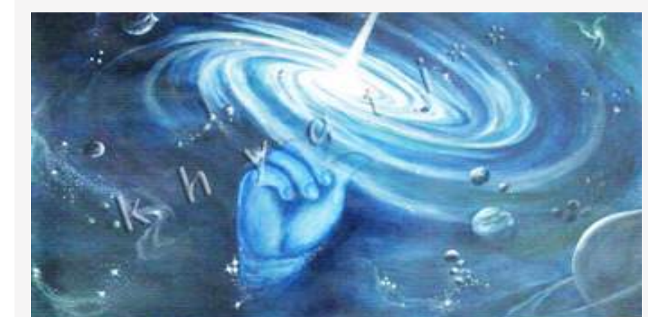
କାବନରେ କୌଣସି ଜିନିଷ ହଜିଯିବା, ହଜିଯାଇଥିବା ଜିନିଷ ଖୋଜିଲେ ନ ମିଳିବା ଆଦି ସମସ୍ୟା ମନକୁ ଭାରାଭାର କରିଦିଏ । ଏଭଳି

ପରିସ୍ଥିତିରେ କାର୍ତ୍ତିକାଶ୍ୱିନୀ ରାଜା ଯିଏ ହେଉ ବ୍ୟତୀତ ତା ଉତ୍ତରାଧିକାରୀ ବିଷ୍ଣୁଙ୍କ ସୁଦର୍ଶନ ଚକ୍ରର ଅବତାର ବୋଲି କୁହାଯାଇଥାଏ । ତାଙ୍କର ସାଧନା କରିବା ଦ୍ୱାରା ଏହି ସବୁ ସମସ୍ୟାରୁ ଉଦ୍ଧୃତ ମୁକ୍ତି ମିଳିଥାଏ । ପୁରାଣରେ ବର୍ଣ୍ଣିତ ହୋଇଛି ଯେ ସୁଦର୍ଶନ ଚକ୍ର ଯେ କୌଣସି ଦିନକୁ ଯାଇ ହଜିଥିବା ଜିନିଷ ଖୋଜି ଆଣିବାର ସାଧନା କରିଥାଏ । ଏହାର ସାଧନା ପାଇଁ ଦୀପାଳୀ ପୂର୍ଣ୍ଣିମା ଅଥବା ଉତ୍ତର ଦିଗ ପଟକୁ ମୁହଁ କରି ବସନ୍ତ । ହଜିଯାଇଥିବା ଜିନିଷକୁ ଭାବନାରେ ଆଣି ଉତ୍ତର ଦିଗକୁ ବସି ସୁଦର୍ଶନ ଚକ୍ରକୁ ସ୍ମରଣ କରି ଧ୍ୟାନ କରନ୍ତୁ ।