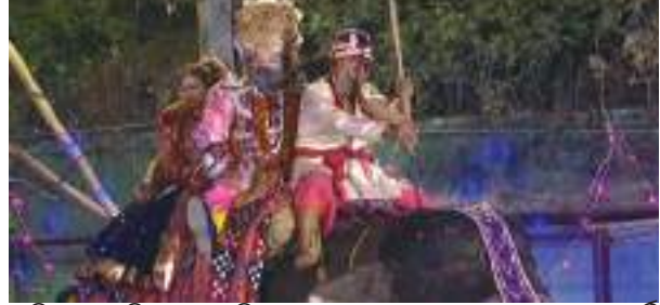
ଗାନ୍ଧ୍ୟାଦି କରି କଂସଙ୍କ ସଂହାରଣ ଦେବକୀଙ୍କୁ କାରାଗାରରେ ଭରି ଆରୋହଣ ପରେ ବସୁଦେବ-କରିବେ ମହାରାଜ କଂସ ।