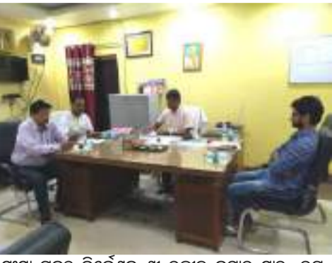
କେନ୍ଦ୍ରାପଡ଼ା (ପିଏନ): କେନ୍ଦ୍ରାପଡ଼ା ବ୍ଲକ ଅନ୍ତର୍ଗତ ଭାଗବତପୁର ଗ୍ରାମ ପଞ୍ଚାୟତରେ ବୁକ୍ ଷ୍ଟାଲ ମେଳା ସ୍ୱାସ୍ଥ୍ୟମେଳା ଓ ପଲ୍ଲୀରେ ପ୍ରଶାସନ କାର୍ଯ୍ୟକ୍ରମ ଅନୁଷ୍ଠିତ ହୋଇଯାଇଛି । କେନ୍ଦ୍ରାପଡ଼ା ବିଧାନ ସଭା ଶାଖାରେ ଏକ ସମାବେଶ ଯୋଗେଇ ଏଥିରେ ମୁଖ୍ୟ ଅତିଥି ଭାବେ ଯୋଗଦେଇ କାର୍ଯ୍ୟକ୍ରମକୁ ଉଦ୍‌ଘାଟନ କରିଥିଲେ । ଏହି ଅବସରରେ ବିଧାନ ସଭା କମିଟିର ସଭ୍ୟମାନେ କର୍ମକ୍ରମର ଉଦ୍‌ଘାଟନ କରିଥିଲେ । ଏହି ଅବସରରେ ବିଧାନ ସଭା କମିଟିର ସଭ୍ୟମାନେ କର୍ମକ୍ରମର ଉଦ୍‌ଘାଟନ କରିଥିଲେ । ଏହି ଅବସରରେ ବିଧାନ ସଭା କମିଟିର ସଭ୍ୟମାନେ କର୍ମକ୍ରମର ଉଦ୍‌ଘାଟନ କରିଥିଲେ ।