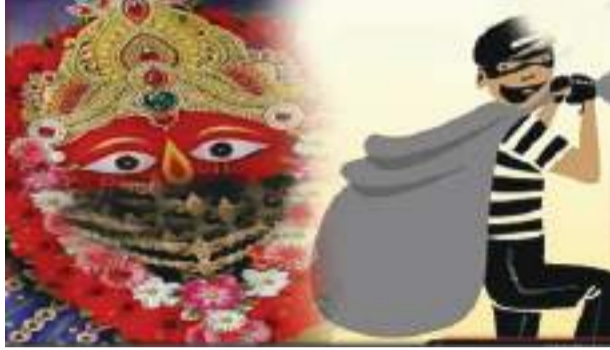
ସେମାନେ ଅସତ୍ୟାପଣ ବ୍ୟକ୍ତ କରିଛନ୍ତି । ତେବେ ଦିନକୁ ଦିନ ଦୋରୀ, ମୁଖ୍ୟ ବ୍ୟାଧାର କାରଣ ପାଲଟିଛି ।

କଲେକ୍ଟର, ୧୩।୧ (ପି.ଏନ.): ଭୋଗରାଜ କାନପୁର ଗାଁସ୍ଥିତ ତାରିଣୀ ମନ୍ଦିରରୁ ଦୋରୀ ହେବା ଘଟଣା ସାମ୍ନାକୁ ଆସିଛି । ବିଳମ୍ବିତ ରାତିରେ ମା' ତାରିଣୀଙ୍କ ପିତୃଳ ନିର୍ମିତ ପ୍ରତିମାକୁ କିଛି ଦୁର୍ବଳ ନେତୃତ୍ୱବା ଜଣା ପଡ଼ିଛି । ସେମାନେ ମନ୍ଦିର ବାଦ ବାକରୁ କନ୍ଧାଧିକ ଟଙ୍କା ସହ ଠାକୁରାଣୀଙ୍କ ସୁନା ଅଳଙ୍କାର ମଧ୍ୟ ଲୁଚି ନେଇଛନ୍ତି । ଏହି ଘଟଣାକୁ ନେଇ ଉଚ୍ଚ ଅଂଚଳରେ ଚର୍ଚ୍ଚାର ବିଷୟ ପାଲଟିଛି । ଏହା ଗ୍ରାମବାସୀଙ୍କ ମନରେ ଆତୀତ ଦେଇଥିବାରୁ