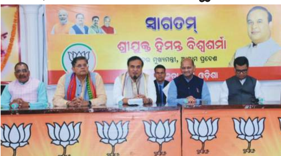
ରାଜ୍ୟ କାର୍ଯ୍ୟାଳୟ ହେଉଛି ମୋ ପାଇଁ ମନ୍ଦିର । ସେଥିପାଇଁ ଦର୍ଶନ କରିବାକୁ ଆସିଥିଲି । ବିଜେପି ଆଗାମୀ ନିର୍ବାଚନରେ ରାଜ୍ୟରେ ଭଲ ପ୍ରଦର୍ଶନ ପ୍ରତିଶ୍ରୁତ ଲୋକ ଭୋଟ ଦେବେ । ବିଜେପିର ଲୋକସଭାରେ ୩୮ ପ୍ରତିଶତ, ବିଧାନସଭାରେ ୩୨ ପ୍ରତିଶତ ଲୋକ ଭୋଟ ଦେବେ । ଯଦି ଓଡ଼ିଶାରେ ନବୀନ ଟ୍ରାଷ୍ଟ ଆଜି ତାହାଙ୍କୁ ବିଜେପିକୁ ୩୮ ପ୍ରତିଶତ ଭୋଟ କେମିତି ମିଳିଲା ?