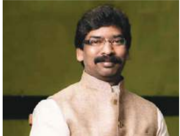
ଥର ପାଇଁ କାରି ହୋଇଥିବା ସମନର ଶେଷ ତାରିଖ ଥିଲା ଡିସେମ୍ବର ୩ । ସୋରେନ୍ ଆଜି ପର୍ଯ୍ୟନ୍ତ ଇଡ଼ି ଆଗରେ ହାଜର ହୋଇନାହାନ୍ତି । ୧୪ ଅଗଷ୍ଟ ୨୦୨୩ରେ ଇଡ଼ି ପକ୍ଷରୁ ତାଙ୍କୁ ପ୍ରଥମ ସମନ ପଠାଯାଇଥିଲା । ସୋରେନ୍ ପ୍ରଥମେ ସୁପ୍ରିମକୋର୍ଟ ଏବଂ ପରେ ଝାଡ଼ଖଣ୍ଡ ହାଇକୋର୍ଟରେ ଇଡ଼ିର ତଦନ୍ତ ଉପରେ ରୋକ ଲଗାଇବାକୁ ବାଦି କରିଥିଲେ । ତେବେ ସୋରେନଙ୍କ ଆବେଦନକୁ ଉଭୟ କୋର୍ଟ ଖାରଜ କରିଥିଲେ ।

ରାଞ୍ଚି, ୧୩।୧ (ପି.ଏନ.): ଅର୍ଥ ହେଉଥିବା ମାମଲାରେ ଇଡ଼ି ପୁଣିଥରେ ଝାଡ଼ଖଣ୍ଡ ମୁଖ୍ୟମନ୍ତ୍ରୀ ହେମନ୍ତ ସୋରେନଙ୍କୁ ସମନ କରାଯାଇଛି । ଇଡ଼ି ହେମନ୍ତ ସୋରେନଙ୍କୁ ଏକ ଟ୍ରିପ ପଠାଇ ହାଜର ହେବାକୁ ଏକ ନୂଆ ଡେମାଣ୍ଡ ନାହିଁ । ତେବେ ସମନ ସତ୍ତ୍ୱେ ସେ କାହିଁକି ହାଜର ହେଉନାହାନ୍ତି ବୋଲି ଇଡ଼ି ପୁଣି କରାଯାଇଛି । ଇଡ଼ି ହେମନ୍ତ ସୋରେନଙ୍କୁ ଜାନୁଆରୀ ୧୬ରୁ ୨୦ ତାରିଖ ଯାଏଁ କାର୍ଯ୍ୟାଳୟରେ ହାଜର ହେବାକୁ କହିଛି । ଖାସ୍ କଥା ହେଉଛି ହେମନ୍ତଙ୍କୁ ଅଷ୍ଟମ ଥର ପାଇଁ ଇଡ଼ି ସମନ କରାଯାଇଛି । ଏହାପୂର୍ବରୁ ହେମନ୍ତ ସୋରେନ ସପ୍ତମ ଥର ପାଇଁ ଇଡ଼ି ଦ୍ୱାରା ଡାକ୍ତରୀଭାବରେ ହାଜର ହୋଇନଥିଲେ । ଇଡ଼ି ଦ୍ୱାରା ସପ୍ତମ