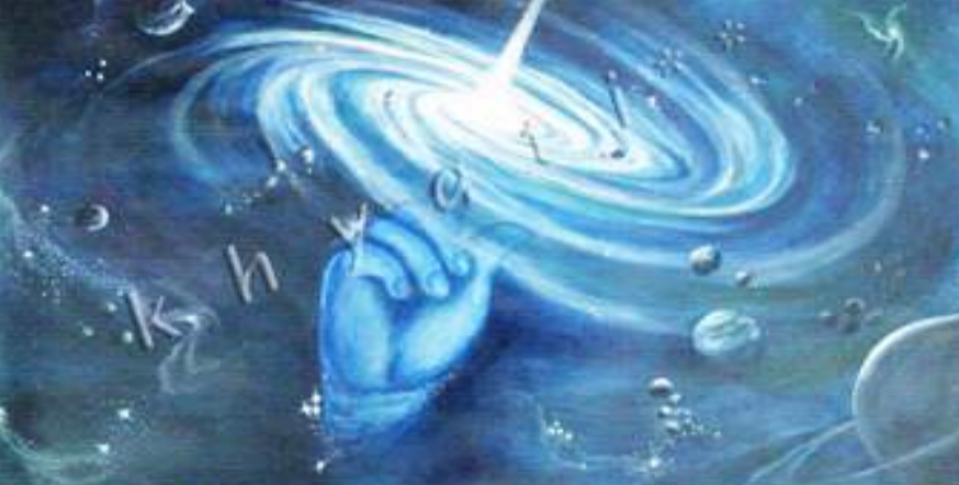
କାବନରେ କୌଣସି ଜିନିଷ ହଜିଯିବା, ହଜିଯାଇଥିବା ଜିନିଷ ଖୋଜିଲେ ନ ମିଳିବା ଆଦି ସମସ୍ୟା ମନକୁ ଭାରାନ୍ତ କରିଦିଏ । ଏଭଳି

ପରିସ୍ଥିତିରେ କାର୍ତ୍ତିକେୟଙ୍କୁ ରାଜା ଯିଏ ହେଉ ବଂଶର ତଥା ଭଗବାନ ବିଷ୍ଣୁଙ୍କ ସୁଦର୍ଶନ ଚକ୍ରର ଅବତାର ବୋଲି କୁହାଯାଇଥାଏ । ତାଙ୍କର ସାଧନା କରିବା ଦ୍ୱାରା ଏହି ସବୁ ସମସ୍ୟାରୁ ଉଦ୍ଧୃତ ମିଳିଥାଏ । ପୁରାଣରେ ବର୍ଣ୍ଣିତ ହୋଇଛି ଯେ ସୁଦର୍ଶନ ଚକ୍ର ଯେ କୌଣସି ଦିନକୁ ଯାଇ ହଜିଥିବା ଜିନିଷ ଖୋଜି ଆଣିବାର ସାଧନା କରିଥାଏ । ଏହାର ସାଧନା ପାଇଁ ଦୀପାଳୀ ପୂର୍ଣ୍ଣିମା ଅଥବା ଭଗବାନ ବିଷ୍ଣୁଙ୍କୁ ପୂଜା କରିବା ଦିନ ଚକ୍ର ମୁହଁ କରି ବସନ୍ତ । ହଜିଯାଇଥିବା ଜିନିଷକୁ ଭାବନାରେ ଆଣି ଭଗବାନ ବିଷ୍ଣୁଙ୍କର ସୁଦର୍ଶନ ଚକ୍ରକୁ ସ୍ମରଣ କରି ଧ୍ୟାନ କରନ୍ତୁ ।