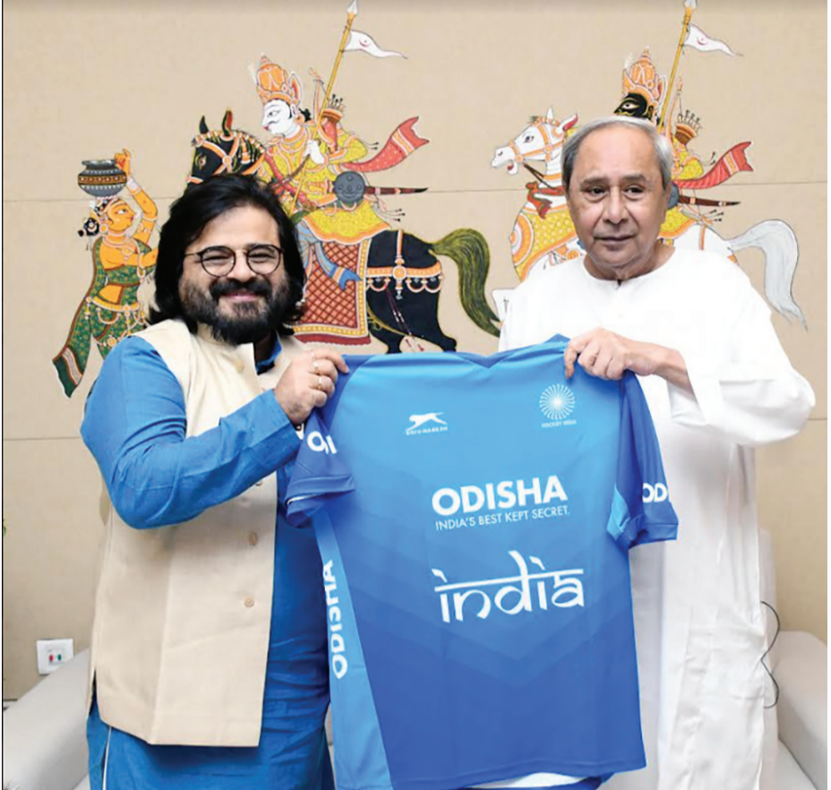
ବଲିଉଡ ମ୍ୟୁଜିକ କମ୍ପୋଜର ପ୍ରୀତମ ମୁଖ୍ୟମନ୍ତ୍ରୀ ନବୀନ ପଟ୍ଟନାୟକଙ୍କୁ ଭେଟୁଛନ୍ତି ।