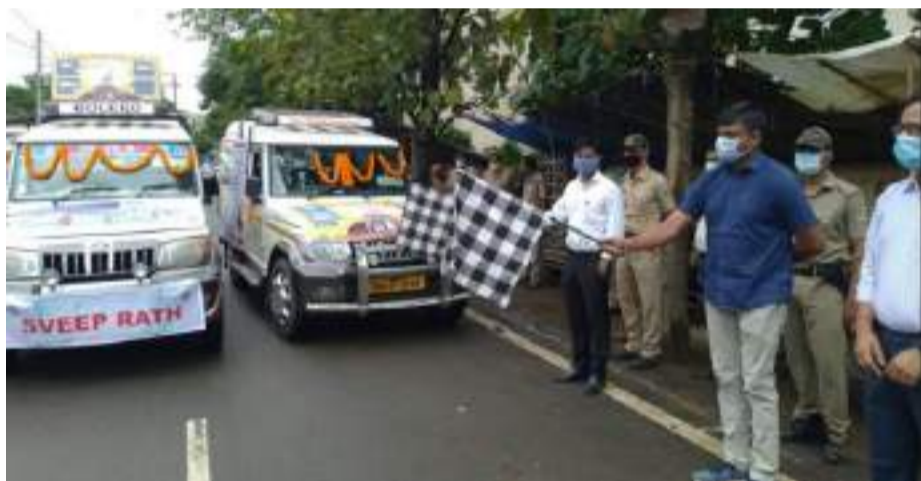
କରାଯାଇପାରିବ, ଇତିଏମ୍-ଭିଡିପାଟ ମେସିନର ବ୍ୟବହାର ଏବଂ ଉପ-ନିର୍ବାଚନରେ ଭୋଟରମାନଙ୍କ