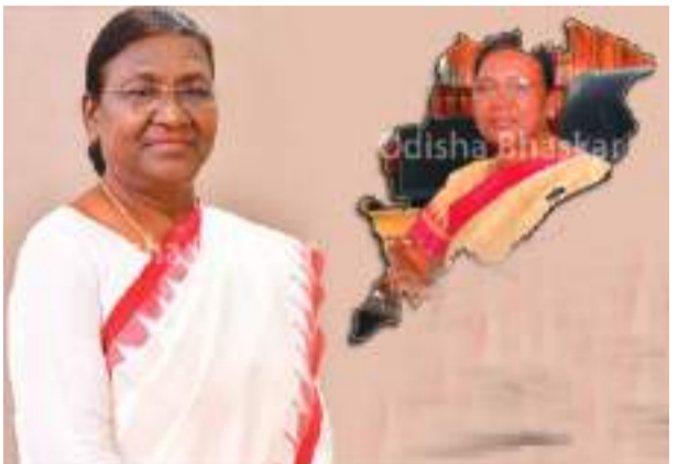
ଯୋଗ ଦେବା ନେଇ ପୂର୍ତ୍ତା ରହିଛି। କାଲି ରତ୍ନକ ବିଶ୍ୱବିଦ୍ୟାଳୟର ସମାବର୍ତ୍ତନ ଉତ୍ସବରେ ଯୋଗ ଦେବେ ରାଷ୍ଟ୍ରପତି ମୁର୍ମୁ। ତେବେ ମହାମହିମ ଗସ୍ତ ପାଇଁ କଟକରୁ ସୁରକ୍ଷା ବ୍ୟବସ୍ଥା କରାଯାଇଛି।

ଭୁବନେଶ୍ୱର, ୨୮।୨ (ପି.ଏନ.): ଦେଶର ରାଷ୍ଟ୍ରପତି ତଥା ଓଡ଼ିଆ ମାଟିର ଚର୍ଚ୍ଚିତ ଗୌରବ ରାଷ୍ଟ୍ରପତି ଆଜି ନିଜ ରାଜ୍ୟ ଅଭିମୁଖେ ଆସୁଛନ୍ତି। ଆଜିଠାରୁ ୪ ଦିନିଆ ଗସ୍ତରେ ରହିବେ ମହାମହିମ ରାଷ୍ଟ୍ରପତି ଶ୍ରୀମତୀ ଦ୍ରୌପଦୀ ମୁର୍ମୁ। ଏହି ୪ ଦିନ ମଧ୍ୟରେ ଖୋର୍ଦ୍ଧା, କଟକ, ମୟୂରଭଞ୍ଜ, ଗଞ୍ଜାମ ଏବଂ ସମ୍ଭଲପୁରରେ ବିଭିନ୍ନ କାର୍ଯ୍ୟକ୍ରମରେ ଯୋଗ ଦେବା ନେଇ ପୂର୍ତ୍ତା ରହିଛି। ଆଜି ଦିଲ୍ଲୀରୁ ପହଞ୍ଚି ମା' କିନ୍ଦକେଶ୍ୱରୀ ମନ୍ଦିର ଦର୍ଶନ କରିବେ ଶ୍ରୀମତୀ ମୁର୍ମୁ। ଏହାପରେ ଆସବାବାଳି କେନ୍ଦ୍ରରେ ଏବଂ ଭୁବନେଶ୍ୱରର କାର୍ଯ୍ୟକ୍ରମରେ ସେ