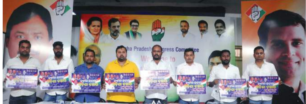
ସୁବକ ସୁବତାମାନଙ୍କର ସ୍ୱାର୍ଥ ଅବହେଳିତ। ଶିଶୁଚଳର ସୁବକ ସୁବତାମାନେ ଧୂଳି,ଧୂଆଁ, ଧୂସର ଯୋଗୁଁ ଏକ ବିପଦ ସଂକୂଳ ପରିବେଶରେ ଜୀବନ ଯାପନ କରୁଛନ୍ତି, ରୋଗାଗ୍ରସ୍ତ ହେଉଛନ୍ତି। ସେମାନଙ୍କର ଆବଶ୍ୟକ ଖର୍ଚ୍ଚ ସମ୍ପଦ ଲୁଚି ହେଉଛି। ଶିଶୁ ସେଠାରେ ଅବସ୍ଥାପିତ ଘରୋଇ ଶିଶୁରେ ନିମ୍ନୁତ ପାଇଁ ସ୍ଥାନୀୟ ସୁବକ ସୁବତାଙ୍କର ଅଧିକାର ନାହିଁ।