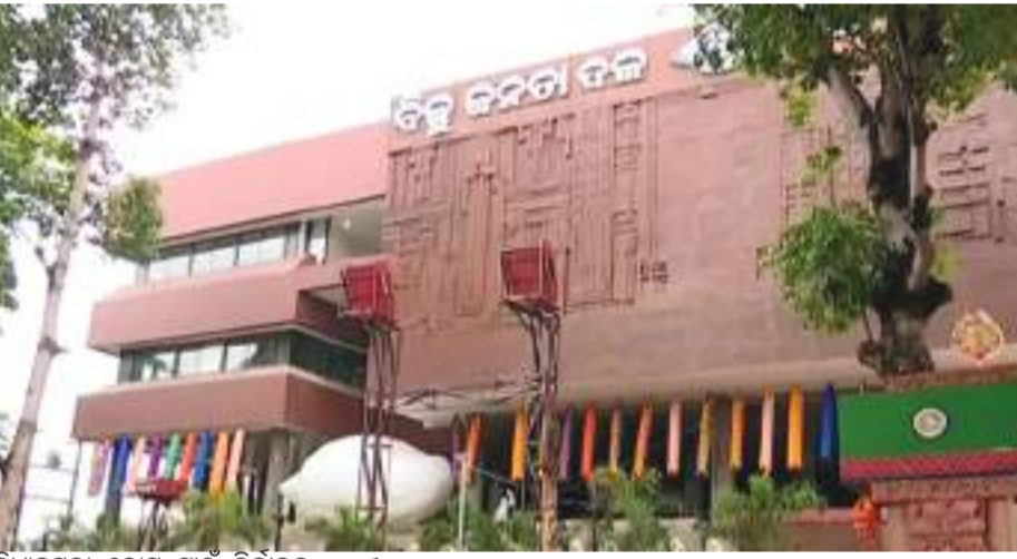
ବିଧାନସଭା ଭୋଟ ପାଇଁ ନିର୍ବାଚନ ଆରମ୍ଭର ବିଧି ଲାଗୁ ହେବା ପୂର୍ବରୁ କମିଶନଙ୍କ ଏଭଳି ଆଦେଶ ଶାସକ ବିଜେଡିକୁ ଅନୁସାରେ ପକାଇଛି।

ଭୁବନେଶ୍ୱର, ୨୮।୨ (ପି.ଏନ.): ସାଧାରଣ ନିର୍ବାଚନକୁ ଦୃଷ୍ଟିରେ ରଖି ନିଜ ଦଳୀୟ ଚିହ୍ନ 'ଶଙ୍ଖ'କୁ ସରକାରୀ ବିଜ୍ଞାପନରେ ଉପଯୋଗ କରିବା ଶାସକ ବିଜେଡିକୁ ମହଙ୍ଗା ପଡ଼ିଛି। ଆଜି ନିର୍ବାଚନ କମିଶନ ଏନେଇ କଡ଼ା ଆଦେଶ ପୋଷଣ କରି ଉଭୟ ଓଡ଼ିଶା ସରକାର ଓ ବିଜେଡିକୁ ଜବାବ ଦାଖଲ ପାଇଁ ନିର୍ଦ୍ଦେଶ ଦେଇଛନ୍ତି। ମାର୍ଚ୍ଚ ୨ ତାରିଖ ବା ଶନିବାର ସନ୍ଧ୍ୟା ଏନେଇ ସଂସଦର ଉଭୟ ଦଳର ରାଜ୍ୟ ସରକାର ଓ ବିଜେଡିକୁ ଚାରିଦିନ କରାଯାଇଛି ନିର୍ଦ୍ଦେଶ ଅନୁସାରେ, ସାଧାରଣ ଲୋକଙ୍କ ବିକସ ଅର୍ଥରେ ସମତାପାତ୍ର ବିଜେଡି ସରକାର 'ଶଙ୍ଖ' ଚିହ୍ନ ରଖି କୋଟି କୋଟି ଟଙ୍କାର ବିଜ୍ଞାପନ ଦେଉଥିବାକୁ ଗୁରୁତର ସହ ନେଇଛନ୍ତି। ରାଜ୍ୟରେ ଉଭୟ ଲୋକସଭା ଓ