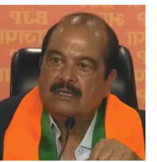
ଅସୁସ୍ଥତା କାରଣରୁ ଭୋଟ ଦେବାକୁ ଆସି ନଥିଲେ । ତେଣୁ ୩୫-୩୩ରେ

ବାପା ମା' ଆଗରେ ହାଉଁସ ଧକ୍କାରେ ଚାଲିଗଲା କୋମଳମତି ଶିଶୁକନ୍ୟାର ଜୀବନ ରାଉରକେଲା/କୋକିଳା, ୨୭।୨ (ପି.ଏନ.): ବାପା ମା' ଆଗରେ ହାଉଁସ ଧକ୍କାରେ ଚାଲିଗଲା କୋମଳମତି ଶିଶୁକନ୍ୟାର ଜୀବନ । ନିଶ୍ଚିତ ମୃତ୍ୟୁମୁଖରୁ ଅଳ୍ପକେ ବର୍ତ୍ତିଯାଇଛନ୍ତି ଉଭୟ ଦମ୍ପତି । ଆଜି ସଂଖ୍ୟା ପ୍ରାୟ ସାତେ ଖଟାରେ ଲହୁଣିପତା କୁଳ ବରପୁଅ ନିର୍ବାହୀଙ୍କୁ ଛକରେ ଏମିତି ଘଟଣା ଘଟିଛି । ଲହୁଣିପତା ପୂଜିତ ଦୁର୍ଗପୂଜାରେ ହାଉଁସକୁ କବଚ କରିବା ସହ ହାଉଁସରୁ ଆନାରେ ଅଟକ ରଖିଛି । ଶତପୁରର ଦାଦିରେ ସ୍ଥାନୀୟ ଲୋକ ରାଖାଯୋଗେ କରିଥିଲେ । ସ୍ଥାନୀୟ ପୁଲିସ ପହଞ୍ଚି ଉତ୍ତେଜିତ ଲୋକଙ୍କୁ ବୁଝାସୁଝା କରିବା ପରେ ପରିସ୍ଥିତି ସ୍ଥାବ ପଡିଥିଲା ।