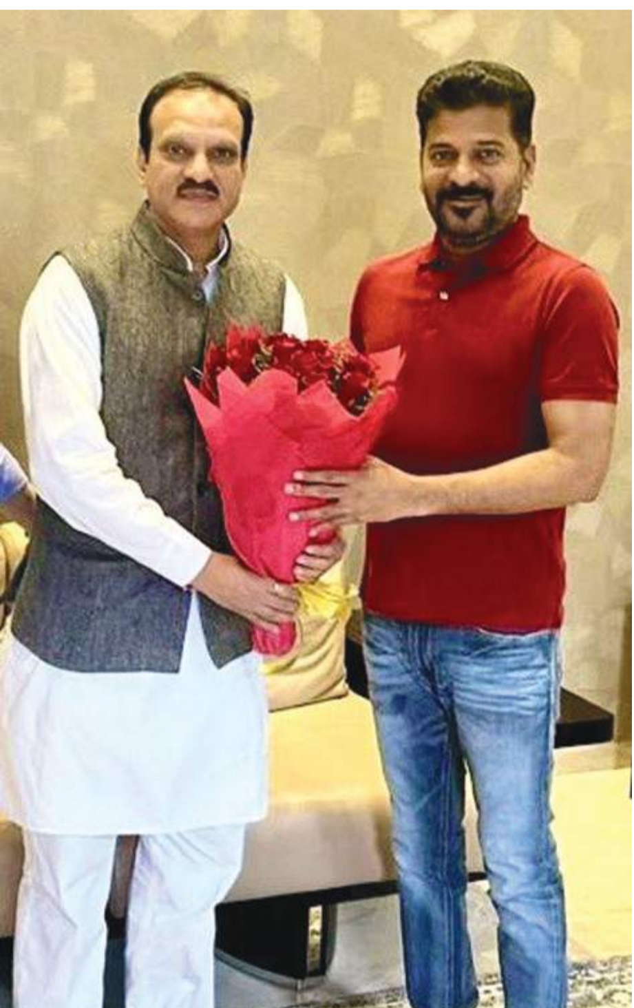
ରାଜସ୍ଥାନର କଂଗ୍ରେସ ରାଜ୍ୟସଭା ଏମପି ନିରଜ ଡାକି ତେଲେଜାନାର ଭାବି ମୁଖ୍ୟମନ୍ତ୍ରୀ ରେବନ୍ତ ରେଡ୍ଡିଙ୍କୁ ପୁଷ୍ପଗୁଞ୍ଜ ସହ ସ୍ୱାଗତ କରୁଛନ୍ତି

ନୂଆପଡ଼ା, ୬।୧୨(ପି.ଏନ.): ନୂଆପଡ଼ା ଜିଲ୍ଲାରେ ଏବେ ଡ଼ାଖୀକୁ ବାତ୍ୟା ଭୟ ଯାଉଛି। ଧାନ ମଣ୍ଡରେ ହଜାର ହଜାର ବସ୍ତା ଜଳାଣି ବଳି ନୂଆପଡ଼ାରେ ପଡ଼ିବାରୁ ଆଜିଠାରୁ ଜିଲ୍ଲାରେ ଝିପିଝିପ ବର୍ଷା ଆରମ୍ଭ ହୋଇଥିବାବେଳେ ଅମଳ ଧାନ ବିଲରେ, ଖଜାରେ ଭିଜୁଛି। ଯୋଗାଣ ବିଭାଗର ଅବହେଳା ଯୋଗୁଁ ମଣ୍ଡରେ ହଜାରହଜାର ବସ୍ତା ଧାନ ବିକ୍ରି ଅପେକ୍ଷାରେ ଗୁରୁତ ହୋଇଛି। ଗତକାଳି ସଂଖ୍ୟା ପୁଣି ମଣ୍ଡରେ ୪୮୪ ଜଣ ଡ଼ାଖୀ ୪୫ ହଜାର ୫୮୭ ବାସ୍ତା ଧାନ ମଣ୍ଡରେ ପଡ଼ିଛି। ସେଥିରୁ ଖରିଆରୋଡ଼ ମଣ୍ଡରେ ୬୫ ଜଣ ଡ଼ାଖୀ ୬୮୦୨ ବସ୍ତା, ବେଲପୁରୀ ମଣ୍ଡରେ ୧୪୫୫, ମୋହରାଡ଼ି ମଣ୍ଡରେ ୨୫ ଜଣ ୨୭୯୭, ସାହିପଲ ମଣ୍ଡରେ ୧୨ ଜଣ ୧୧୦୮, କୋମନା ବୁଦ୍ଧ ଲକ୍ଷ୍ମୀ ମଣ୍ଡରେ ୨୯ ଜଣ ୨୨୯୩, କାଣ୍ଡେଡ଼ତା ମଣ୍ଡରେ ୨୧ ଜଣ ୧୪୫୧, ମଖାପଦର ମଣ୍ଡରେ ୨୧ ଜଣ ୨୭୩୦ ବସ୍ତା ଧାନ ମଣ୍ଡରେ ପଡ଼ିବାରୁ।