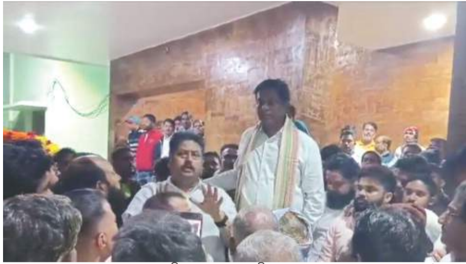
କରାଯାଇଥିଲା। ବିଶାଳ ମହିଷାପଦାରେ ଆୟୋଜିତ ସଭାକୁ ଶୋଭାଯାତ୍ରାରେ ତାଙ୍କୁ ଯୋଗଦାନକାରୀ ପାଞ୍ଚୋଟି ନିଆଯାଇଥିଲା। ଯେଉଁଥିରେ ହଜାର ହଜାର ବିଜେଡି କର୍ମୀ ଉପସ୍ଥିତ ଥିଲେ।

ଭୁବନେଶ୍ୱର, ୬।୧୨(ପି.ଏନ.): ସଂସଦ ପଢ଼ାଣି ଆଗରେ 'ମୁକ୍ତି' ହଟାଓ ନାରୀଦେଲେ ବିଜେଡି କର୍ମୀ। ତା' ପୁତ୍ରୀ ଜିଲ୍ଲା ପର୍ଯ୍ୟଟନ ସଂସ୍ଥା ନାସରାଫିଲ୍ଡ ଉପସ୍ଥିତରେ। ୨୦୨୪ ସାଧାରଣ ନିର୍ବାଚନ ପୂର୍ବରୁ ବିଜେଡିର ଏପରି କରଣ ଦେଖିବାକୁ ମିଳିଛି ଉଦ୍‌ଦମ୍ପନରେ। ସଂସଦ ମଞ୍ଚାଳତା ମଣ୍ଡଳ ଭାଷଣ ଦେଉଥିବା ବେଳେ 'ମୁକ୍ତି' ହଟାଓ ନାରୀ ଦେବାରୁ ଅଧିକାରୀ ପକ୍ଷରୁ ଅପହରଣ ହେଉଛି ସଂସଦ ନାସରାଫିଲ୍ଡ। ଗତ ଶୁକ୍ରବାର ସେ ଉଦ୍‌ଦମ୍ପନ ଜିଲ୍ଲା ଗସ୍ତରେ ଯାଇଥିଲେ। ଉଦ୍‌ଦମ୍ପନ ସେ ବାସୁଦେବପୁର ଅତିଥିଖଣ୍ଡ ଯାଇଥିଲେ। ବାସୁଦେବପୁର ବିଜେଡି ପକ୍ଷରୁ ତାଙ୍କୁ ଉଦ୍‌ଦମ୍ପନ ସ୍ୱାଗତ