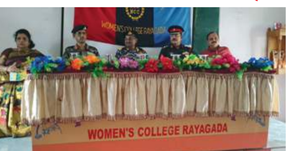
ବୃତ୍ତି, ସାହସ, ସାଥୀତା, ଅନୁଶୀଳନ, ନେତୃତ୍ୱ, ଧର୍ମ ନିରପେକ୍ଷ ଦୃଷ୍ଟିକୋଣ, ଦୁସାହସିକତାର ଆତ୍ମା ଏବଂ ଶିକ୍ଷାର୍ଥୀ ମାନଙ୍କ ମଧ୍ୟରେ ନିର୍ଦ୍ଦିଷ୍ଟ ସେବାର ଆଦର୍ଶକୁ ସେମାନଙ୍କୁ ଉପଯୋଗୀ