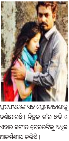
ପ୍ରପେସରଙ୍କ ସହ ପ୍ରେମକାହାଣୀକୁ ଦର୍ଶାଯାଇଛି । ନିଜକୁ ଗାଁର ଛବି ଓ ଏହାର ସଜ୍ଜାଟି ଟ୍ରେଲରଟିକୁ ଅଧିକ ଆକର୍ଷଣୀୟ କରିଛି ।

ନୂଆଦିଲ୍ଲୀ ସିନିକି ଓ ଶ୍ୱେତା ଚୂପାଠାକ ଅଭିନୀତ ଫିଲ୍ମ 'ହରାମ୍‌ଖୋର' ର ଟ୍ରେଲର ରିଲିଜ୍ କରାଯାଇଛି । ପୂର୍ବରୁ ଫିଲ୍ମକୁ ନେଇ କିଛି ସମସ୍ୟା ଦେଖାଦେଇଥିଲା । ମାତ୍ର ଫିଲ୍ମଟି ସମାଜକୁ ଏକ ସୁନ୍ଦର ବାର୍ତ୍ତା ପ୍ରଦାନ କରୁଥିବାରୁ ଏହାର ବ୍ୟାପକ ହଟ୍‌ଟାକ୍‌ଦିଆଯାଇଛି । ଗୁଜୁରାଟର ଏକ ଛୋଟ ଗାଁରେ ସୂଚି କରାଯାଇଛି ସମ୍ପୂର୍ଣ୍ଣ ଫିଲ୍ମ । ଶ୍ଳୋକ ଶର୍ମାଙ୍କ ନିର୍ଦ୍ଦେଶନାରେ ମାତ୍ର ୧୨ଦିନରେ ଶେଷ ହୋଇଛି ପୂରା ଫିଲ୍ମର ସୂଚି । ଫିଲ୍ମର କାହାଣୀରେ ଜଣେ ୧୪ ବର୍ଷର ଝିଅର ନିଜ