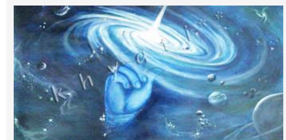
କାବନରେ କୌଣସି ଜିନିଷ ହଜିଯିବା, ହଜିଯାଇଥିବା ଜିନିଷ ଖୋଜିଲେ ନ ମିଳିବା ଆଦି ସମସ୍ୟା ମନକୁ ଭାରାନ୍ତ କରିଦିଏ । ଏଭଳି

ପରିସ୍ଥିତିରେ କାର୍ତ୍ତିକେୟଙ୍କୁ ରାଜା ଯିଏ ହେଉ ବଂଶର ତଥା ଉତ୍ତରାଧିକାରୀ ବିଷ୍ଣୁଙ୍କ ସୁଦର୍ଶନ ଚକ୍ରର ଅବତାର ବୋଲି କୁହାଯାଇଥାଏ । ତାଙ୍କର ସାଧନା କରିବା ଦ୍ୱାରା ଏହି ସବୁ ସମସ୍ୟାରୁ ଉଦ୍ଧୃତ ମିଳିଥାଏ । ପୁରାଣରେ ବର୍ଣ୍ଣିତ ହୋଇଛି ଯେ ସୁଦର୍ଶନ ଚକ୍ର ଯେ କୌଣସି ଦିନକୁ ଯାଇ ହଜିଥିବା ଜିନିଷ ଖୋଜି ଆଣିବାର ସାଧନା କରିଥାଏ । ଏହାର ସାଧନା ପାଇଁ ଦୀପାଳୀ ପୂର୍ଣ୍ଣିମା ଅଥବା ଉତ୍ତର ଦିଗ ପଟକୁ ମୁହଁ କରି ବସନ୍ତ । ହଜିଯାଇଥିବା ଜିନିଷକୁ ଭାବନାରେ ଆଣି ଉତ୍ତର ଦିଗକୁ ବସନ୍ତ ପୂର୍ଣ୍ଣିମା ପୂର୍ଣ୍ଣିମା ପୂର୍ଣ୍ଣିମା କରି ଧ୍ୟାନ କରନ୍ତୁ ।