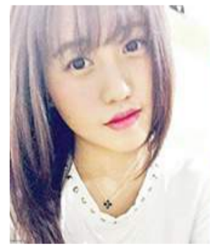
ଅଧିକାରୀମାନେ ଜଣକ ସ୍ଥାନରେ ଅନ୍ୟଜଣକ ଆକାଉଣ୍ଟରେ ଟଙ୍କା ଜମା କରିଦେଉଛନ୍ତି । ବ୍ୟାଙ୍କର ଏହି ଭୁଲ ଯୋଗୁଁ ଜଣେ ଛାତ୍ରୀଙ୍କ କୋର୍ଟର ଚକ୍ର କାଟିବାକୁ ପଡିଛି । ମାମଲାଟି ୨୦୧୨ ମସିହାର ବ୍ୟାଙ୍କ ପକ୍ଷରୁ

ସିଡନୀ ଭାରତରେ ନୋଟରବ ନିଷ୍ପତ୍ତି କାରଣରୁ ଅନେକ କଳାଧନକୁ ଧଳା କରିବା ପାଇଁ ଅନ୍ୟମାନଙ୍କ ଆକାଉଣ୍ଟରେ ଅର୍ଥ ଜମା କରୁଥିବା ଘଟଣା ଏବେ ଦେଖିବାକୁ ମିଳୁଛି । ସେହିପରି ଭୁଲରେ ମଧ୍ୟ ବ୍ୟାଙ୍କ