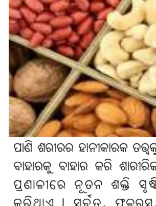
ପାଣି ଶରୀରର ହାନୀକାରକ ତତ୍ତ୍ୱକୁ ବାହାରକୁ ବାହାର କରି ଶାରୀରିକ ପ୍ରଶାଳୀରେ ନୂତନ ଶକ୍ତି ସୃଷ୍ଟି କରିଥାଏ । ସର୍ବତ, ଫଳସ, ନଡ଼ିଆ ପାଣି ଭଳି ପାଣି ଜିନିଷ ପିଇବା ଉଚିତ୍ । ଶାରୀରିକ ସତେଜ ରହିବା ପାଇଁ ପ୍ରୋଟିନ୍ ଯୁକ୍ତ ଖାଦ୍ୟ ନିଜ ଖାଦ୍ୟରେ ଗ୍ରହଣ କରିବା

ଅଳ୍ପାପଣ ସମୟ ଲୋକଙ୍କର ଅଭିଯୋଗ ରହିଆସିଛି ଯେ, ସେମାନେ ଅଳ୍ପ କାମ ରେ ଜଳଦି ଅଳ୍ପପତ୍ତି । କିଛି ବ୍ୟକ୍ତି ଏଭଳି ବି ଅଛନ୍ତି ଯିଏ କିଛି କାମ ନ କରି ମଧ୍ୟ ଅଳ୍ପ ଅନୁଭବ କରନ୍ଥାନ୍ତି । ଶରୀରରେ ଶକ୍ତିର କମି ଫଳରେ ଜଣେ ବ୍ୟକ୍ତି ଅଳ୍ପ ଅନୁଭବ କରିଥାଏ । ତେଣୁ ଶରୀରକୁ ଶକ୍ତିଶାଳୀ ବନାଇବାପାଇଁ ଆପଣ ଆପଣଙ୍କ ଖାଦ୍ୟରେ ଦିନରତ୍ୟାରେ ପ୍ରୋଟିନ୍ ଯୁକ୍ତ ଖାଦ୍ୟ ସାମିଲ କରନ୍ତୁ । ପୁରା ଦିନ ପାଣି କିମ୍ବା କିଛି ତରଳ ପଦାର୍ଥ ପିଇବା ଉଚିତ୍ ।