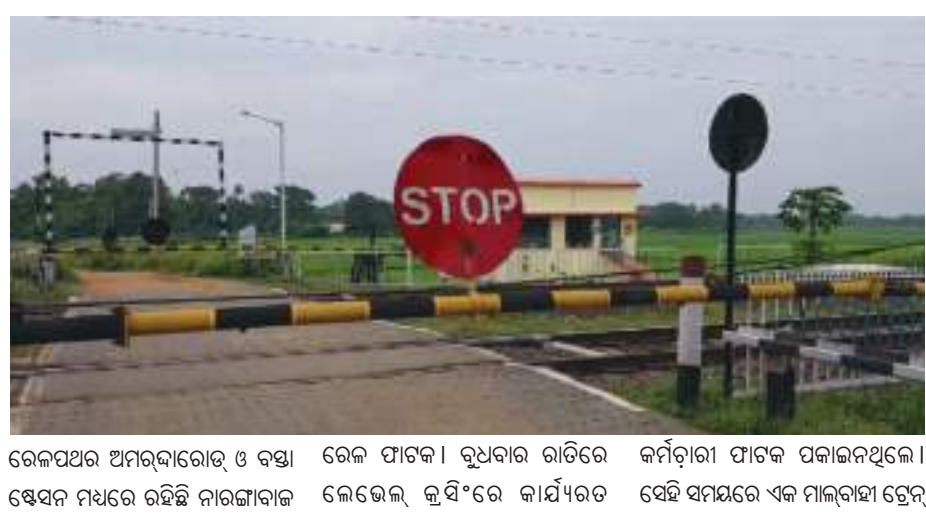
ରେଳପଥର ଅମରଦାରୋଡ଼ ଓ ବସ୍ ଷ୍ଟେସନ୍ ମଧ୍ୟରେ ରହିଛି ନାଟକାଦାକ ରେଳ ଫାଟକ। ଦୁଇଦିନ ରାତିରେ ରେଳ ଲେଭେଲ୍ କୁସିଂରେ କାର୍ଯ୍ୟକର କର୍ମଚାରୀ ଫାଟକ ପକାଇନଥିଲେ। ସେହି ସମୟରେ ଏକ ମାଲବାହୀ ଟ୍ରେନ୍ ଅନୁଧ୍ୟାନ କରିଥିବା ଜଣାପଡିଛି।

ଭୁବନେଶ୍ୱର, ୨୪।୮।(ପି.ଏନ): ବାହାନଗା ରେଳ ଦୁର୍ଘଟଣାରୁ କିଛି ଶିଖିଲା ନାହିଁ ରେଳ ବିଭାଗ! ବ୍ୟସ୍ତକରୁ ନିଶା-ପୂର୍ବ ରେଳପଥରେ ଫାଟକ ନପକାଇ ଶୋଇ ପଡିଲେ ନିଶାରେ କର୍ମଚାରୀ। ଟ୍ରେନ୍ ଆସୁଥିବା ବେଳେ ଲୋକମାନେ ଫାଟକ ପକାଇଥିଲେ। ଦୁଇଦିନ ରାତିରେ ଏପରି ଘଟଣା ବାଲେଶ୍ୱର ଜିଲ୍ଲା କମରଦା ରୋଡ଼ ରେଳ ଷ୍ଟେସନ୍ ନିକଟରେ ଘଟିଛି। କହିବାକୁ ଗଲେ ଏକ ବଡ଼ ଧରଣର ରେଳ ଦୁର୍ଘଟଣାକୁ ଏପରି ଦିଆଯାଇପାରିବ। ଦକ୍ଷିଣ-ପୂର୍ବ