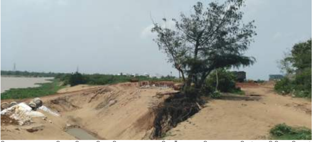
ବିପଦରେ ମଙ୍ଗଳା ମୁହାଣ ବାଲିବନ୍ଧ ବାଲିରେ ପୋତି ହେଉଛି ମୁହାଣ, ନଦୀରେ ଭାସୁଛି ଝାଉଁଶର ସବୁଜ ପରିବେଶ ନଷ୍ଟ ହେଉଛି । (ଫଟୋ-ଡି.ପି. ଗାଙ୍ଗୁଲି, ପୁରୀ)

କରିବ ଓ 'ଓଡ଼ିଶା ଦକ୍ଷତା ବିକାଶ ପ୍ରାଧିକରଣ'କୁ ଏ ଦିଗରେ କୋଟି କୋଟି ଟଙ୍କା ରାଜ୍ୟ ସରକାର ଯୋଗାଇ ଦେଇଥିଲେ । ମାତ୍ର ଏହା କେବଳ କାର୍ଯ୍ୟକ୍ରମରେ ସୀମିତ ରହିଯାଇଛି । ମୁଖ୍ୟମନ୍ତ୍ରୀ ନିୟୁତ ଦୃଷ୍ଟି କାର୍ଯ୍ୟକ୍ରମ ଅନ୍ତର୍ଗତ ଝିଲଡ଼ ଓଡ଼ିଶାରେ ୨୦୧୪-୧୫ ୨୦୧୬-୧୯ ମସିହା ମଧ୍ୟରେ ରାଜ୍ୟର ମୋଟ ୧୦.୩୮ଲକ୍ଷ ଯୁବକଯୁବତୀଙ୍କୁ ଦକ୍ଷତା ବିକାଶ ପ୍ରଶିକ୍ଷଣ ପ୍ରଦାନ କରାଯାଇଥିବା ସରକାର ଦାବି କରିଥିଲେ ମଧ୍ୟ ବାସ୍ତବ କ୍ଷେତ୍ରରେ ଏହି ପ୍ରଶିକ୍ଷଣ ନେଇଥିବା ଯୁବକଯୁବତୀଙ୍କ ସଂଖ୍ୟା ଏବେ କ'ଣ ରହିଛି ତାହା ଅସ୍ପଷ୍ଟ । ସେହିପରି ୨୦୧୯ରୁ ୨୦୨୪ ମସିହା ମଧ୍ୟରେ ମୋଟ ୧୫ଲକ୍ଷ ଅର୍ଥାତ୍ ବାର୍ଷିକ ୩ଲକ୍ଷ ଯୁବକଯୁବତୀଙ୍କୁ ଦକ୍ଷତା ବିକାଶ ପ୍ରଶିକ୍ଷଣ ଦେବାକୁ ଚାର୍ଜେଟ୍ ରଖିଥିବା ରାଜ୍ୟ ସରକାର ୨୦୧୯-୨୦ରେ ୩ଲକ୍ଷ ଯୁବକଯୁବତୀଙ୍କୁ ମିଶାଇଲେ ମୋଟ ୫.୭୮ଲକ୍ଷଙ୍କୁ ଦକ୍ଷତା ପ୍ରଶିକ୍ଷଣ ଦେଇଥିବା ଜଣାପଡିଛି । ତେବେ ବିଭିନ୍ନ ପ୍ରୋଜେକ୍ଟ କାର୍ଯ୍ୟକାରୀତା ଏକେଡ଼ମି(ପିଆଇଏ) ମାଧ୍ୟମରେ ୨୦୧୧-୧୨ ମୋଟ ୧.୧୨ଲକ୍ଷ ଯୁବକଯୁବତୀଙ୍କୁ ପ୍ରଶିକ୍ଷଣ ଦେଇଥିବା ରାଜ୍ୟ ସରକାର ସେମାନଙ୍କ ମଧ୍ୟରୁ ମାତ୍ର ୩୦ହଜାରଙ୍କୁ ଏପର୍ଯ୍ୟନ୍ତ ଡ୍ରେସମେଣ୍ଟ ଦେଇପାରିଛନ୍ତି ।