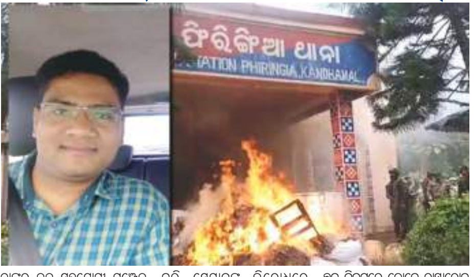
ତାଙ୍କର ଦୁଇ ସହଯୋଗୀ ଗଞ୍ଜେଇ ଦାକରରେ ସଂପୃକ୍ତ ଥିବା ଅଭିଯୋଗ କରି ସେମାନଙ୍କ ବିରୋଧରେ କାର୍ଯ୍ୟାନୁଷ୍ଠାନ ଗଠିତ କରି ଫିରିଙ୍ଗିଆ ଦୁଇ ନିକଟରେ ଲୋକେ ରାଷ୍ଟ୍ରରୋକ କରିଥିଲେ ।