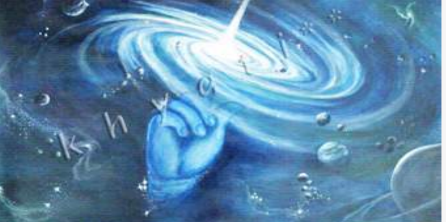
କାବନରେ କୌଣସି ଜିନିଷ ହଜିଯିବା, ହଜିଯାଇଥିବା ଜିନିଷ ଖୋଜିଲେ ନ ମିଳିବା ଆଦି ସମସ୍ୟା ମନକୁ ଭାରାନ୍ତ କରିଦିଏ । ଏଭଳି

ପରିସ୍ଥିତିରେ କାର୍ତ୍ତିକେୟଙ୍କୁ ରାଜା ଯିଏ ହେଉ ବ୍ୟତୀତ ତା ଭଗବାନ ବିଷ୍ଣୁଙ୍କ ସୁଦର୍ଶନ ଚକ୍ରର ଅବତାର ବୋଲି କୁହାଯାଇଥାଏ । ତାଙ୍କର ସାଧନା କରିବା ଦ୍ୱାରା ଏହି ସବୁ ସମସ୍ୟାରୁ ରକ୍ଷା ମୁକ୍ତି ମିଳିଥାଏ । ପୁରାଣରେ ବର୍ଣ୍ଣିତ ହୋଇଛି ଯେ ସୁଦର୍ଶନ ଚକ୍ର ଯେ କୌଣସି ଦିନକୁ ଯାଇ ହଜିଥିବା ଜିନିଷ ଖୋଜି ଆଣିବାର ସାହାଯ୍ୟ କରିଥାଏ । ଏହାର ସାଧନା ପାଇଁ ଦୀପାଳୀ ପୂର୍ଣ୍ଣିମା ଅଥବା ଭଗବାନ ବିଷ୍ଣୁଙ୍କୁ ପୂଜା କରିବା ଦିନ ଚକ୍ର ମୁହଁ କରି ବସନ୍ତ । ହଜିଯାଇଥିବା ଜିନିଷକୁ ଭାବନାରେ ଆଣି ଭଗବାନ ବିଷ୍ଣୁଙ୍କର ସୁଦର୍ଶନ ଚକ୍ରକୁ ସ୍ମରଣ କରି ଧ୍ୟାନ କରନ୍ତୁ ।