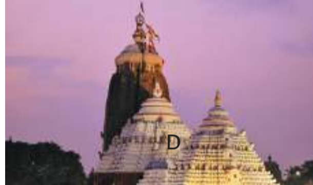
ପଶା ସଂକ୍ରାନ୍ତି ବା ମହାବିଷୁବ ସଂକ୍ରାନ୍ତି ପଡୁଥିବା ବେଳେ ସେହିଦିନଠାରୁ ଏହି ବ୍ୟବସ୍ଥା ଆରମ୍ଭ କରାଯିବ। ପ୍ରଥମ ପର୍ଯ୍ୟାୟରେ ସକାଳେ ଦ୍ୱାର ଫିଟା ସମୟରେ ଓ ସନ୍ଧ୍ୟା ଆରତି ବେଳେ ଦୁଇ ଜଣ ଲେଖାଏଁ ପ୍ରତିହାରୀ ସେବାୟତ ସିଂହଦ୍ୱାର ସମ୍ମୁଖରେ ମୁତୟନ ହେବେ। ପରବର୍ତ୍ତୀ ସମୟରେ ପୂଜା ଦିନରୁ ରାତି ପର୍ଯ୍ୟନ୍ତ ପ୍ରତିହାରୀ ସେବାୟତମାନଙ୍କୁ ମୁତୟନ କରାଯିବ।

ଭୁବନେଶ୍ୱର, ୧୨।୪ (ପି.ଏନ.): ବିଭିନ୍ନ ସମୟରେ ଅଣହିନ୍ଦୁମାନେ ଶ୍ରୀମନ୍ଦିର ଭିତରକୁ ପ୍ରବେଶ କରୁଥିବା ଦେଖାଯାଇଛି। ନିକଟ ଅତୀତରେ ମଧ୍ୟ ଏଭଳି ଖବର ଆସିଛି। ଅଣହିନ୍ଦୁ ପ୍ରବେଶକୁ ରୋକିବା ପାଇଁ ଶ୍ରୀମନ୍ଦିର ପ୍ରଶାସନ ଏବେ ଏକ ପଦକ୍ଷେପ ନେଇଛି। ଶ୍ରୀମନ୍ଦିରର ସିଂହଦ୍ୱାରରେ ପ୍ରତିହାରୀ ସେବକମାନଙ୍କୁ ମୁତୟନ କରିବାକୁ ନିଷ୍ପତ୍ତି ନେଇଛି। ୧୪ ତାରିଖରେ