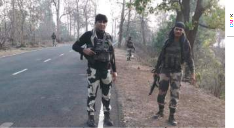
ରଖିଥିବା ବେଳେ କୌଣସି ଅପରାଧକୁ ଏତାହାକି ପାଇଁ ସମସ୍ତ ସକାଶ ରହିଛନ୍ତି। ସେହିପରି ଓଡ଼ିଶା ଓ ଛତିଶଗଡ଼ ସୀମାରେ ହାଇଆଲର୍ଟ କରି କରାଯାଇଛି। ସୀମାରେ କଡାକଡି ଯାଞ୍ଚ ଦାଲିଛି। ସମସ୍ତ ସାଧନାବହନ ସହ ସଂବେଦ କରାଯାଉଥିବା ବ୍ୟକ୍ତିଙ୍କୁ ଅଟକାଇ ପଡ଼ିବାପଡ଼ିବା କରାଯାଇଛି। ନକ୍ସଲ ଯେପରି ନିର୍ବାଚନକୁ ଭଣ୍ଡାର ନକରିପାରନ୍ତି ସେଥିପାଇଁ କଡାକଡି ପୁରସାକର୍ମୀଙ୍କୁ ବ୍ୟବସ୍ଥା କରାଯାଇଛି। ସୀମାରେ ଓଡ଼ିଶାର ପୁରସାକର୍ମୀ ଏବଂ ଛତିଶଗଡ଼ର ପୁରସାକର୍ମୀ ମିଳିତ ଭାବେ କୁହୁଥିବା ବେଳେ କୌଣସି ଅପରାଧକୁ ପିଲିଛି। ଆସନ୍ତାକାଳି ଠାରୁ ୧୫ ତାରିଖ ପର୍ଯ୍ୟନ୍ତ ନକ୍ସଲ ସଂଗଠନ ପକ୍ଷରୁ ଗାଁ ଗାଁରେ ସଚେତନତା ରାଲି ସହ ନିର୍ବାଚନକୁ ବର୍ଦ୍ଧନ କରିବା ପାଇଁ ଯେଉଁ ଆହ୍ୱାନ ଦିଆଯାଇଛି, ତାହା ଗୁରୁତ୍ୱ ସହ ନେଇଛି ପୁଲିସ। ପୁଣି ଆସନ୍ତା ୧୫ ତାରିଖ ଦିନ ୫ଟି ରାଜ୍ୟରେ ବନ୍ଦ ଠାକରା ଦିଆଯାଇଥିବାରୁ ତାକୁ ନେଇ ଏବେ ଠାରୁ ପୁଲିସ ସତର୍କତା ଅବଲମ୍ବନ କରୁଛି। ସମସ୍ତ ନକ୍ସଲ ପ୍ରବଣ ଅଂଶୁଳଗୁଡ଼ିକରେ ସର୍ବ ଅପରାଧକୁ ଭଣ୍ଡାର କରିଛି। ଗାଁ ଗାଁରେ ଥିବା ମିଳିସିଆକୁ ପୁଲିସ ଚାକିର କରିବ। ଜିଲ୍ଲାର ବ୍ରହ୍ମକୋଣ୍ଡା ବ୍ଲକ୍ରେ ମଧ୍ୟ ଏଥର ଶାନ୍ତିପୂର୍ଣ୍ଣ ମତଦାନ ହେବା ନେଇ ସମସ୍ତ ପ୍ରସ୍ତୁତି ସରିଛି। ସ୍ୱାଭିମାନ ଅଂଶୁଳରେ ନକ୍ସଲ ପ୍ରତିବର୍ଷ ନିର୍ବାଚନକୁ ଭଣ୍ଡାର କରିଆସୁଥିଲେ। ଏଥର କିନ୍ତୁ ସମସ୍ତ ଜନତା ନିର୍ଭୟରେ ନିଜ ନିଜ ଭୋଟଦାନ କରିପାରିବେ ବୋଲି କୁହାଯାଇଛି। ତେବେ ଆସନ୍ତା ତିନି ଦିନ ପୁଲିସ ଏବଂ ପୁରସାକର୍ମୀଙ୍କ ପାଇଁ ବଡ଼ ବ୍ୟାଞ୍ଜନ ହୋଇଥିବା ବେଳେ ଏହାକୁ କିପରି ମୁକାବିଲା କରୁଛି ଦେଖିବାକୁ ରାଜି ରହିଲା।

ମାଲକାନଗିରି, ୧୨।୪ (ପି.ଏନ.): ୨୦୨୪ ଲୋକସଭା ଏବଂ ବିଧାନସଭା ନିର୍ବାଚନକୁ ନେଇ ନକ୍ସଲ ସଂଗଠନର କେନ୍ଦ୍ରୀୟ କମିଟି ପ୍ରଥମରୁ ହିଁ ଲୋକଙ୍କୁ ଏଥିରେ ଭାଗ ନେବାକୁ ଆହ୍ୱାନ ଦେଇଛି। ତେବେ ଆସନ୍ତାକାଳି ଠାରୁ ନକ୍ସଲ ସଂଗଠନ ପକ୍ଷରୁ ଛତିଶଗଡ଼ ଏବଂ ମାଲକାନଗିରି ଜିଲ୍ଲାରୁ ପୁରୀମ ଗାଁଗୁଡ଼ିକରେ ନକ୍ସଲ ନିର୍ବାଚନକୁ ଭଣ୍ଡାର କରିବା ନେଇ ଚାଲିର ଆୟୋଜନ କରିବ ନେଇ ଘଷ୍ଟ କରିଛି। ଦୀର୍ଘ ଦିନ ଧରି ମାଲକାନଗିରି ଜିଲ୍ଲାରେ ନକ୍ସଲକର କୌଣସି ଗତିବିଧି କିମ୍ବା ଅପରାଧ ଘଟଣା ଘଟିନଥିଲେ ମଧ୍ୟ ନକ୍ସଲ ଚୁପ ଘଟଣା ଆଗକୁ ବିପଦ ଆସୁଥିବାର ଆଶଂକା କରାଯାଉଛି। ଛତିଶଗଡ଼ରେ ନକ୍ସଲ ପ୍ରତିଦିନ କୌଣସି ନା କୌଣସି ସ୍ଥାନରେ ହିଁ ଏହା ଘଟାଉଥିବା ବେଳେ ମାଲକାନଗିରିରେ ସେଭଳି କୌଣସି ଘଟଣା ଘଟୁ ନାହିଁ। କିନ୍ତୁ ପୁଲିସ ଏବଂ ପୁରସାକର୍ମୀ ସତର୍କତା ଅବଲମ୍ବନ କରୁଛନ୍ତି। ଆଗକୁ ଛତିଶଗଡ଼ରେ ଲୋକସଭା ଏବଂ ଓଡ଼ିଶାରେ ବିଧାନସଭା ନିର୍ବାଚନ ରହିଥିବାରୁ ଦିଲ୍ଲୀ ଠାରୁ ମାଲକାନଗିରି ପର୍ଯ୍ୟନ୍ତ ନକ୍ସଲ ବନମ ନେଇ ବୈଠକ ବସୁଛି। ନକ୍ସଲ ଗତିବିଧି ଉପରେ ଗୁରୁତ୍ୱ ଦିଆଯିବ ନେଇ