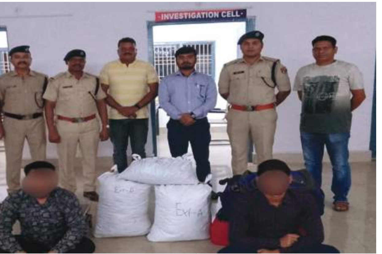
ପୂର୍ବତନ ରେଳବାଇ ରେଳ ପୁରୁଣା ବଳ (ଆରପିଏସ୍) ପକ୍ଷରୁ ଜାମ୍‌ଆରାକୁ ମାର୍ଚ୍ଚ - ୨୦୨୪ ମଧ୍ୟରେ ନିଷେଧ ସାମଗ୍ରୀ ଯଥା ଗଞ୍ଜେଇ ପରିବହନ ବିରୁଦ୍ଧରେ ବିଶେଷ ଅଭିଯାନ ଆରମ୍ଭ କରାଯାଇଥିଲା । ଏହି ସମୟ ମଧ୍ୟରେ ୫୬ ଟି ମାମଲା ରୁଜୁ କରାଯାଇ ପ୍ରାୟ ୧୦୬୦ କେଜି ଗଞ୍ଜେଇ କବଚ କରାଯାଇଥିଲା ଯାହାର ଆନୁମାନିକ ମୂଲ୍ୟ ୮୧,୨୧,୯୦୫/- ଅଟେ । ଏହି ସମୟରେ ୮୮ ଜଣ ଲୋକଙ୍କୁ ଗିରଫ କରାଯାଇ ଘଟଣା ଅଧିକାରୀଙ୍କୁ ଅଧିକ ଆକଳନକାରୀ କାର୍ଯ୍ୟାଳୟରେ ପାଇଁ ସମ୍ପୂର୍ଣ୍ଣ ବିଚାରଣା ହସ୍ତକାର କରାଯାଇଛି ।