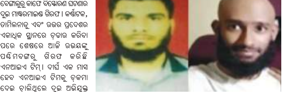
ନିର୍ଦ୍ଦେଶ ୨୦ ଲକ୍ଷ ଟଙ୍କାର ପୁରସ୍କାର ରାଶି ମଧ୍ୟ ଘୋଷଣା କରାଯାଇଥିଲା। ଏକାଧିକ ରାଜ୍ୟରେ ବୃତ୍ତାନ୍ତ ସମ୍ପାଦନ ପାଇଥିବା ଅନୁସନ୍ଧାନକାରୀ ସଂସ୍ଥା। ଏପ୍ରିଲ ୧୫ରୁ ଆରମ୍ଭ ହେବ ଗ୍ରୀଷ୍ମ ଲହରୀ, ତାପମାତ୍ରା ପୁଣି ଥରେ ୪୦ ଡିଗ୍ରୀରେ ପହଞ୍ଚିବ। ଭୁବନେଶ୍ୱର, ୧୨।୪ (ପି.ଏନ.): ଆଜିଠାରୁ ରାଜ୍ୟରେ ପାଗରେ ପରବର୍ତ୍ତନ ହେବା ସହିତ ଧାରଣାରେ ତାପମାତ୍ରା ବୃଦ୍ଧି ପାଇବ। ଆସନ୍ତା ୪ ଦିନ ମଧ୍ୟରେ ରାଜ୍ୟର ଅଧିକାଂଶ ସ୍ଥାନରେ ତାପମାତ୍ରା ୬-୮ ଡିଗ୍ରୀ ପର୍ଯ୍ୟନ୍ତ ବୃଦ୍ଧି ପାଇବ। ଏହାପରେ ରାଜ୍ୟରେ ପୁଣି ଥରେ ତାପମାତ୍ରା ୪୦ ଡିଗ୍ରୀରେ ପହଞ୍ଚିବ। ୧୯ ତାରିଖରେ ରାଜ୍ୟର ୪ଟି ସହରରେ ବୃଦ୍ଧି ମାସର ସବୁଠାରୁ ଥଣ୍ଡା ଦିନ ଅନୁଭୂତ ହୋଇଥିଲା। ବର୍ଷା ଓ ମେଘପୁଆ ଆକାଶ ପ୍ରଭାବରେ ଆଭ୍ୟନ୍ତରୀଣ ଓଡ଼ିଶାରେ ଦିନ ତାପମାତ୍ରାରେ ହ୍ରାସ ପାଇଥିଲା।