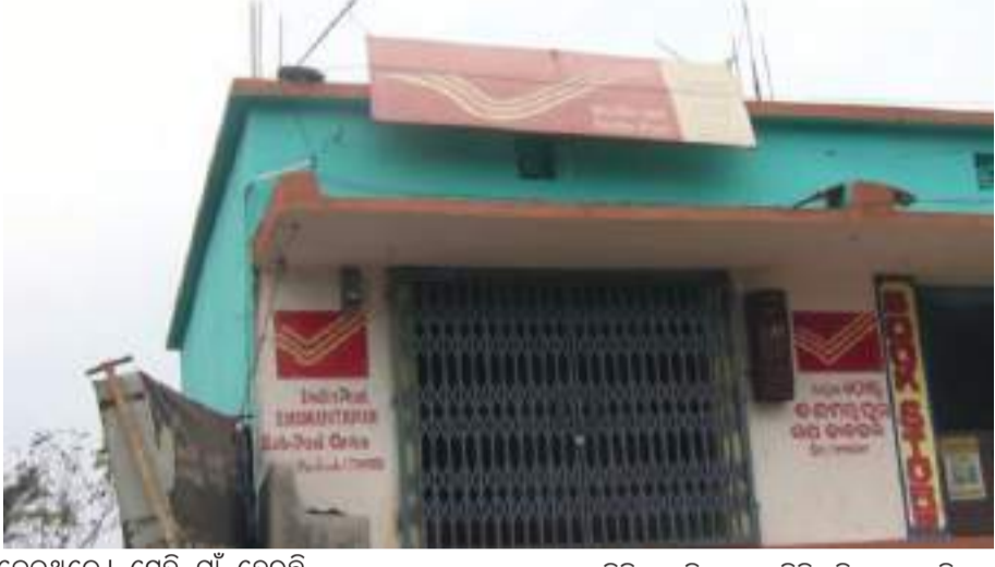
ଦେଇଥିଲେ। ସେହି ଗାଁ ହେଉଛି 'ଗମ୍ଭୀରାଗୁଡ଼ା'। ଯାହା ବର୍ତ୍ତମାନ ରାୟଗଡ଼ା ଜିଲ୍ଲା କାଶିପୁର ବ୍ଲକ୍ କୁଚେଇପଦର ପଞ୍ଚାୟତରେ ରହିଛି। ଏହି ଗାଁର ପୋଷ୍ଟାଲ୍ କୋଡ୍ ହେଉଛି- ୭୬୪୨୦୮। ଯାହା କୋରାପୁଟ ଜିଲ୍ଲାରେ ରହିଛି। କିନ୍ତୁ ସମସ୍ତ ଠିକଣା ଓ କାଗଜପତ୍ର ଗୁଡ଼ିକରେ ରାୟଗଡ଼ା ଜିଲ୍ଲାର ଠିକଣା ରହିଛି।

ଭୁବନେଶ୍ୱର, ୩୧ ।୩।(ପି.ଏନ.): ଏମିତି ଏକ ବିଚିତ୍ର ଗାଁ। ଯାହାର ପୋଷ୍ଟାଲ୍ ପିନ୍ କୋଡ୍ କୋରାପୁଟ ଜିଲ୍ଲାରେ ରହିଛି। ମାତ୍ର ଜିଲ୍ଲା ରାୟଗଡ଼ା। ଅର୍ଥାତ୍ ସରକାରୀ କାଗଜପତ୍ରରେ ଠିକଣା ରହିଛି ରାୟଗଡ଼ା ଜିଲ୍ଲା। ଏମିତି ଅଜବ ସମ୍ପର୍କ ଧରି ଦୀର୍ଘବର୍ଷ ହେଲା କୋରାପୁଟ ଅଞ୍ଚଳରେ ଥିବା ଗମ୍ଭୀରାଗୁଡ଼ା ଗାଁର ଲୋକମାନେ ରହିଛନ୍ତି। ଯାହାଫଳରେ ନାନା ଅସୁବିଧାରେ ପଡ଼ୁଛନ୍ତି। ଏନେଇ କେତେ କାହାକୁ ନେହୁରା ହେଲେ ମଧ୍ୟ କେହି ଶୁଣୁ ନାହାନ୍ତି। ତେଣୁ ସେମାନେ ଆଜି ଭୋଟି ବର୍ଜନ ପାଇଁ ଚେତାବନା ଦେଇଛନ୍ତି। ରଜାରାଜୁଡ଼ା ଶାସନ ସମୟରେ କନ୍ଧପୁର ମହାରାଜା ତାଙ୍କ ସଂପର୍କୀୟ ତଥା କାଶିପୁର ରାଜାଙ୍କୁ ତାଙ୍କ ଗଡ଼ଜାତର ଏକ ଗ୍ରାମରୂପେ